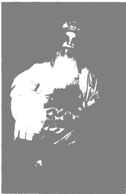
1981年钟祥京剧团攻老生，在《甘露寺》中扮演乔国公