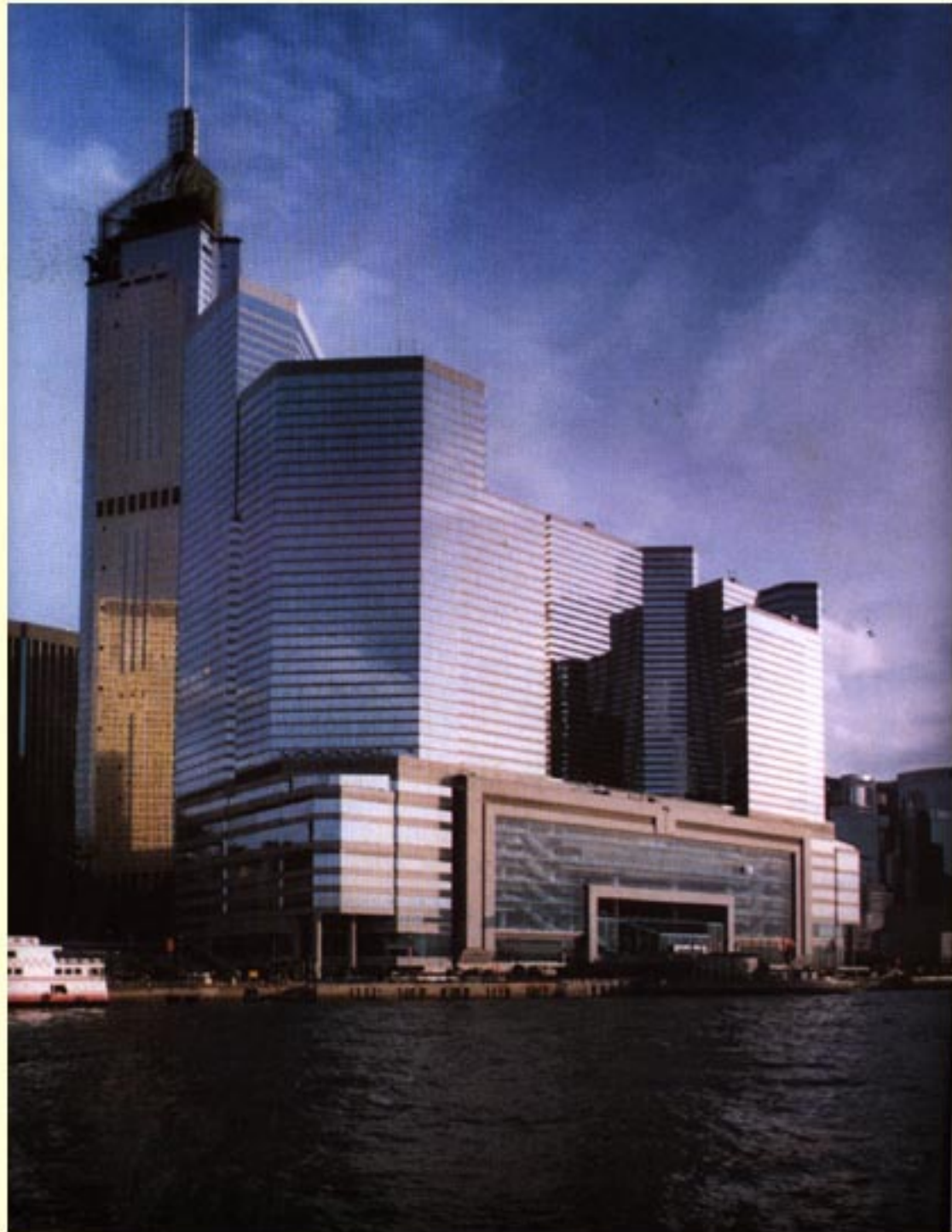
中环广场与会议展览中心