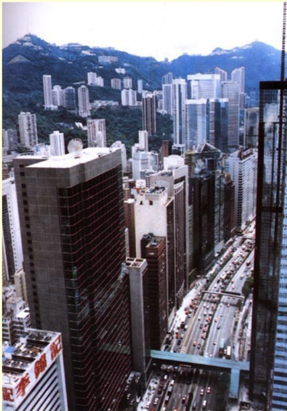
车水马龙的香港街道