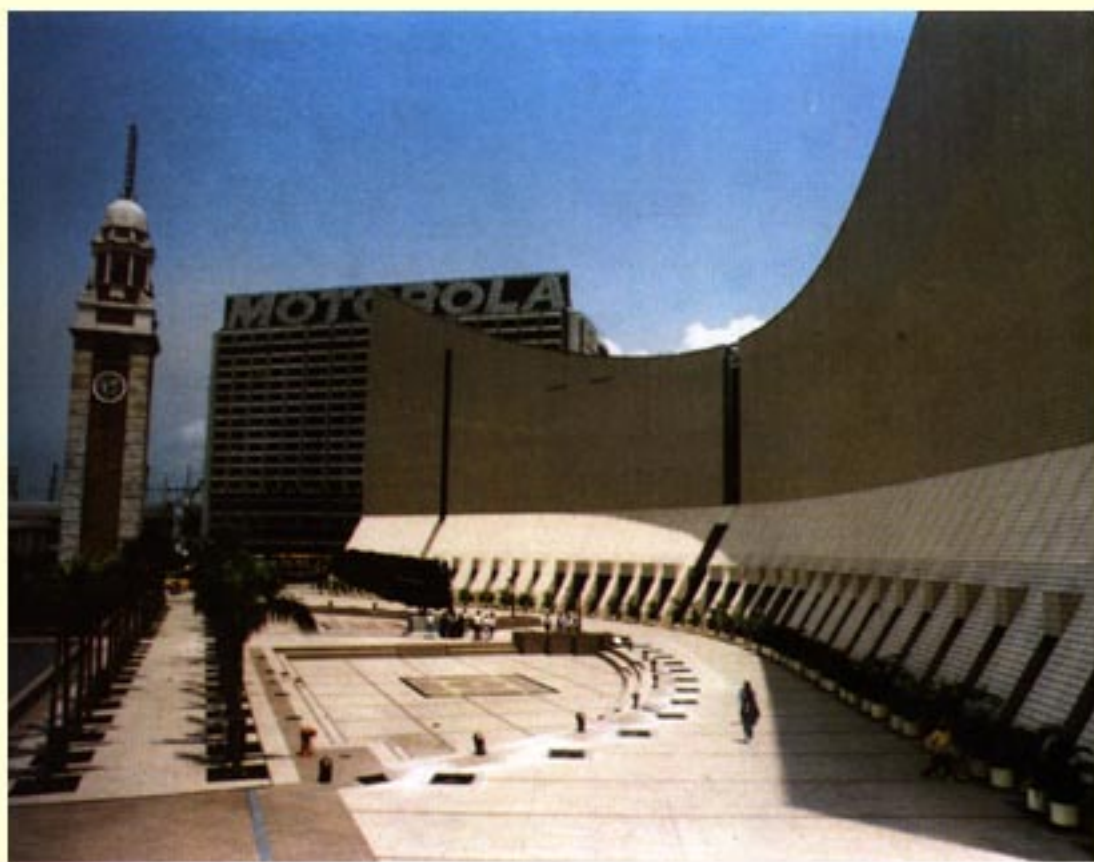
香港文化中心的一角