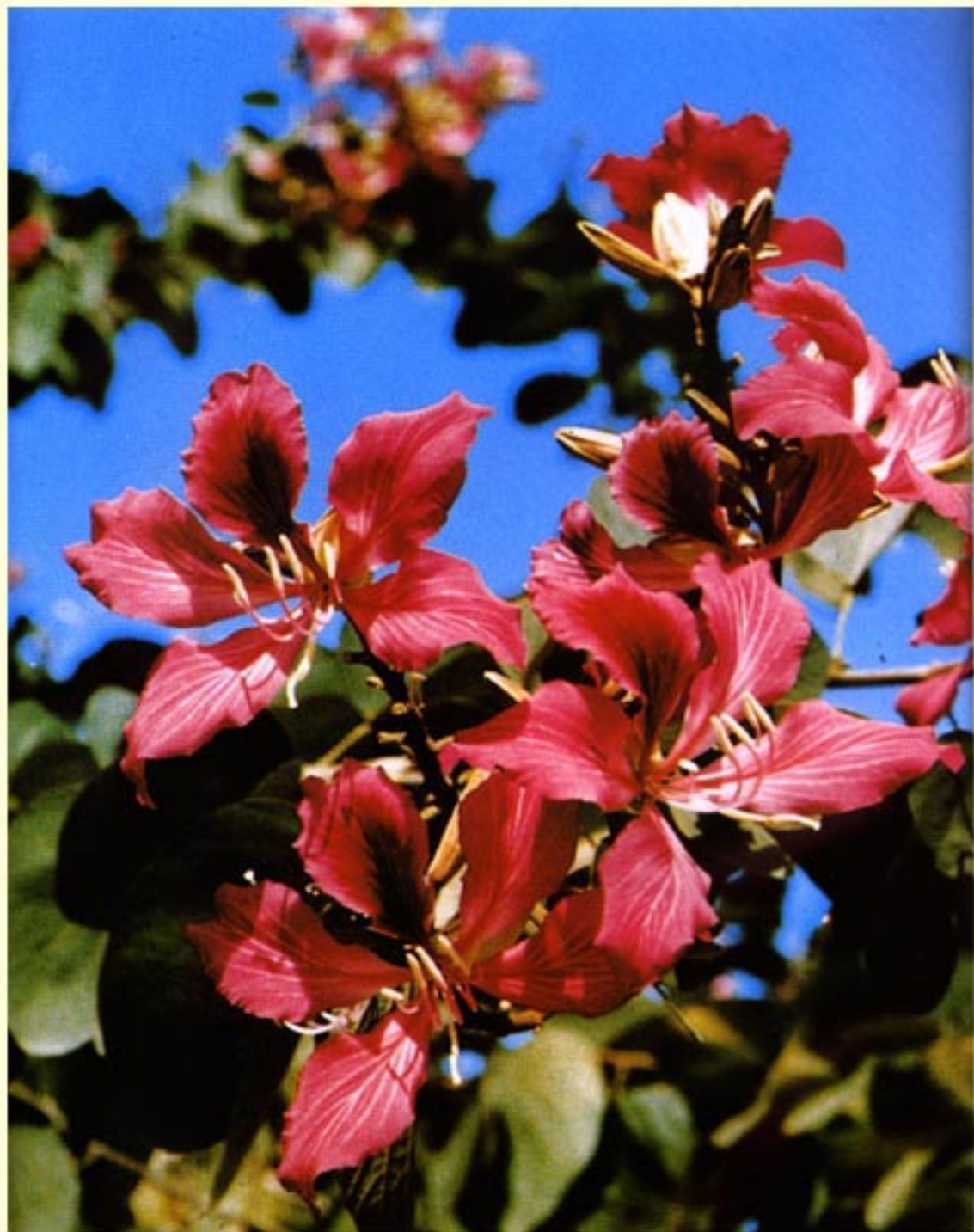
香港的市花紫荊花