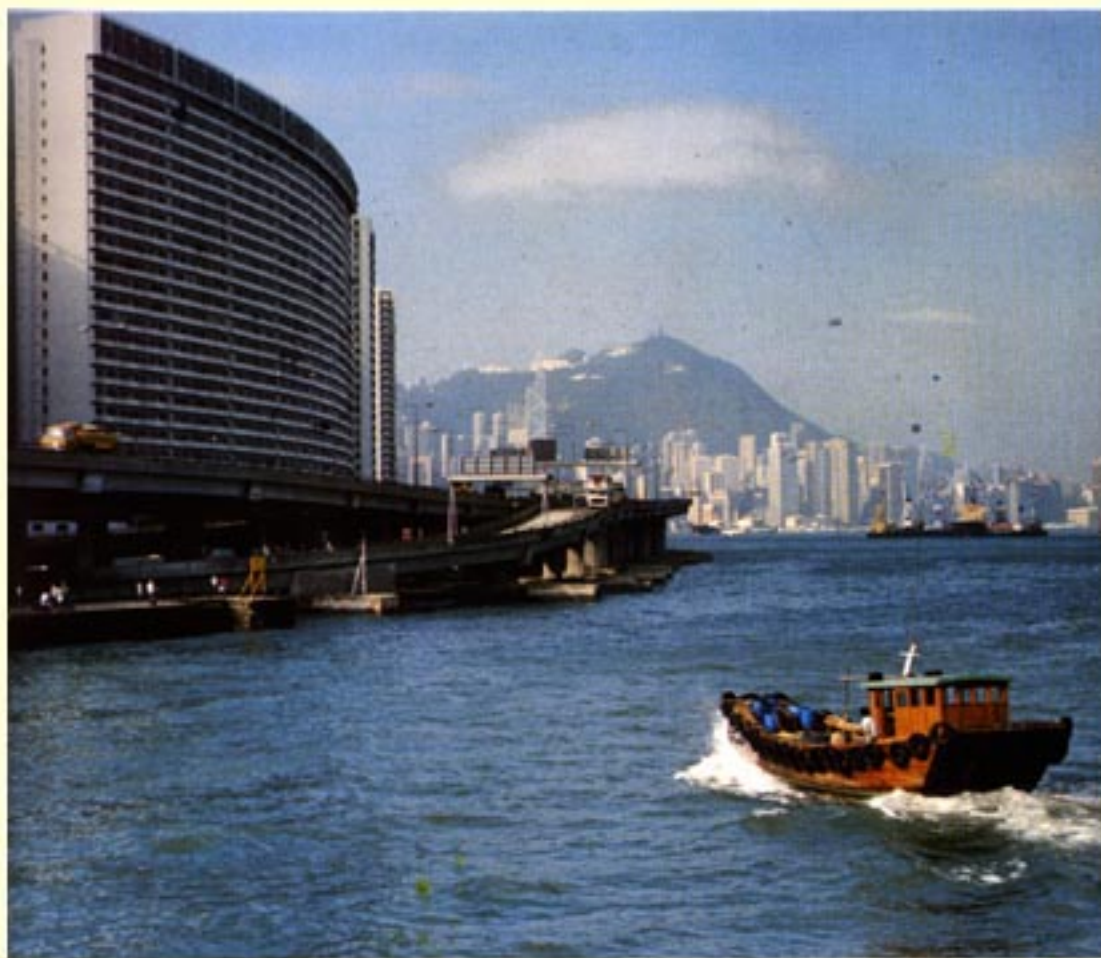
从北角望东区走廊