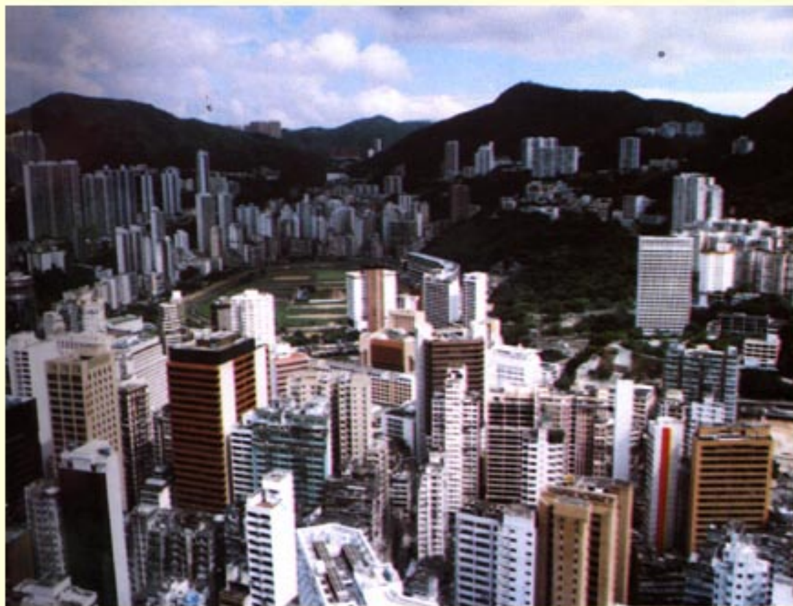
现代建筑群中的香港跑马地