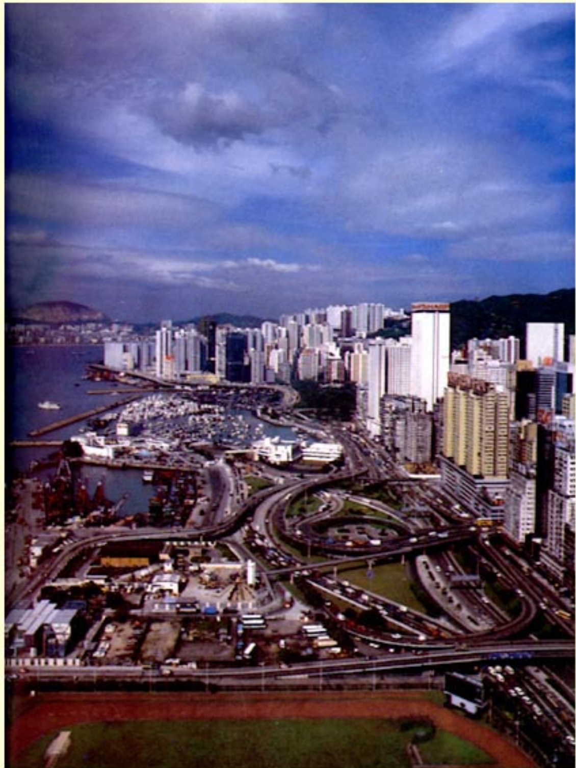
湾仔海底隧道口的立体交通网和东区走廊高速公路