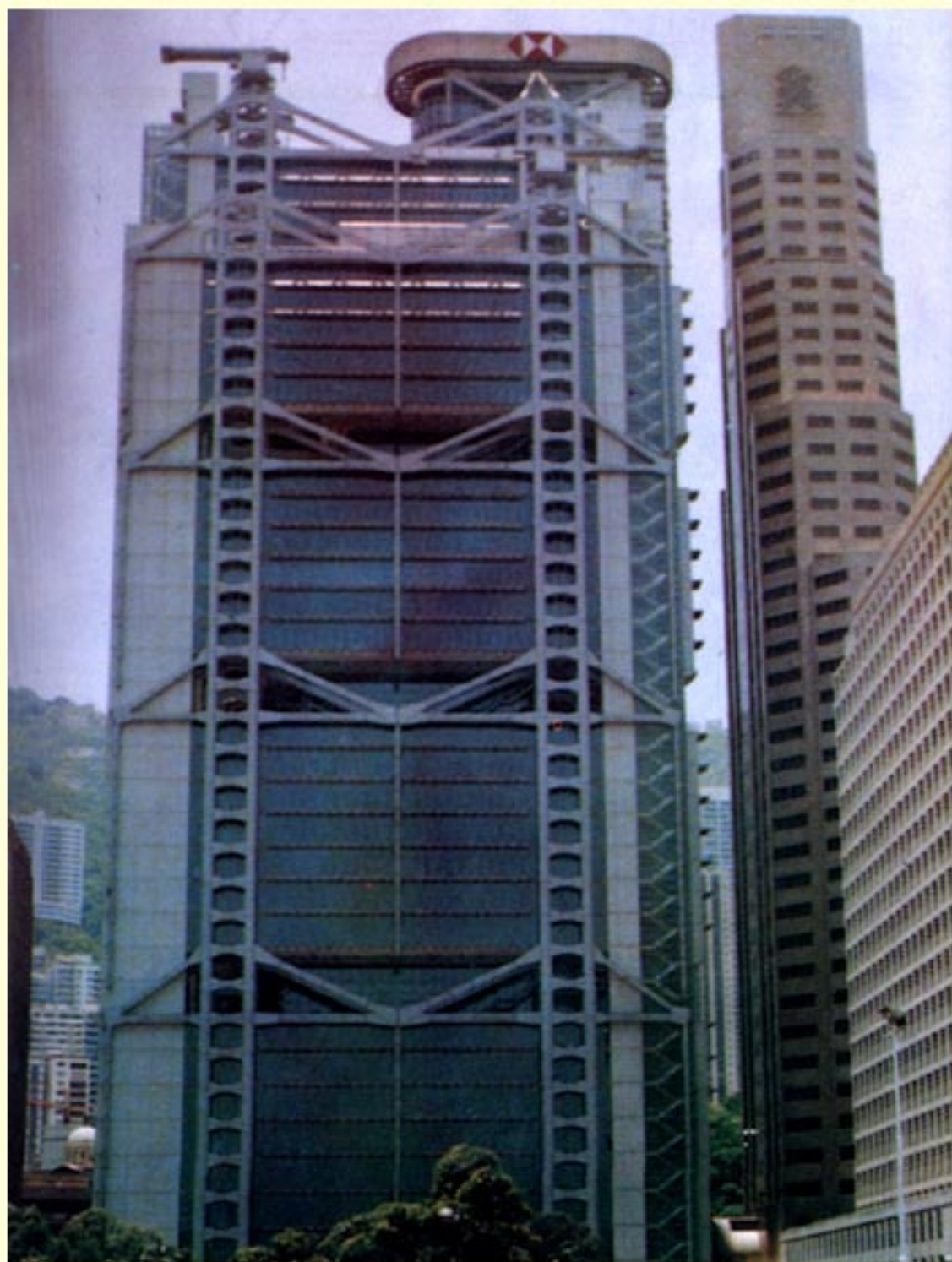
汇丰银行和渣打银行——香港享有发行货币权的英资银行