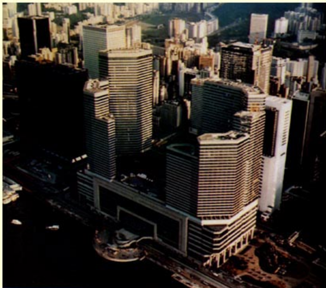
香港会议展览中心——远东最大的现代化国际会议展览场馆