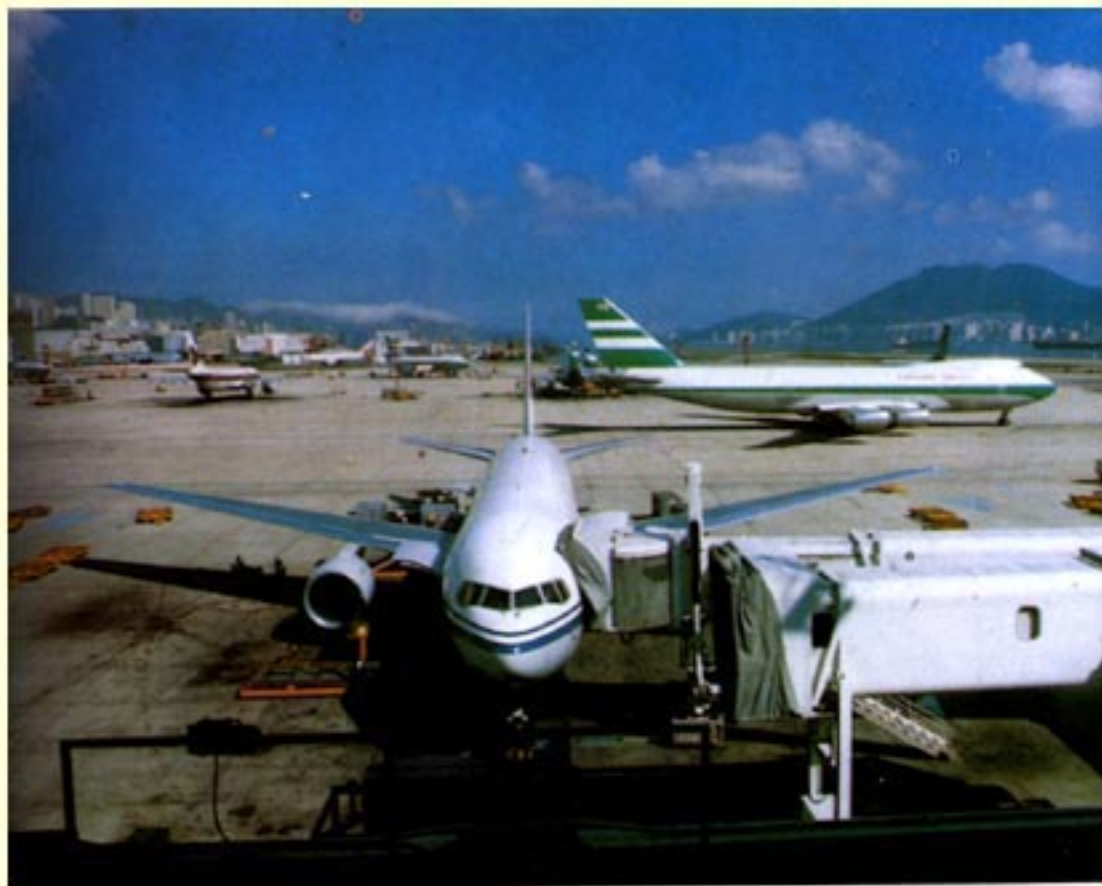
香港国际机场（启德机场）——远东最繁忙的国际航空港之一