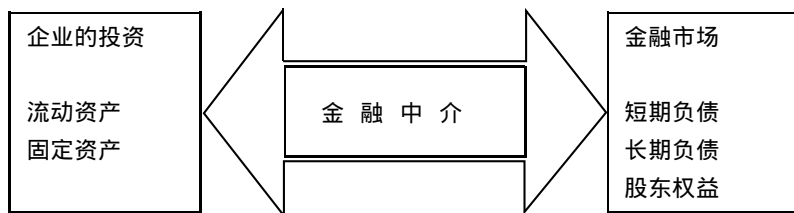
图 1-1 企业与金融市场间的现金流

可以说，公司财务经理所面临的一系列决策问题就是公司理财所要研究的基本问题。公司理财解决的是企业生产活动的资金运行问题。它是从微观的角度去分析公司财务问题，但又不仅仅局限于企业内部从事封闭式的理财活动，而是在特定的金融环境下，密切联系金融市场和金融机构从事理财活动。我们应当把公司理财看成是资金在企业内外不断流动、不断周转的一个动态过程（见图 1-1）。