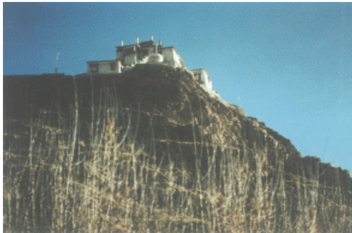
雍布拉冈 (建于公元前 3 世纪聂赤赞普时期，是西藏最早出现的交通要塞之一)