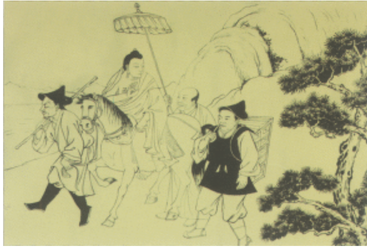
顿巴辛饶骑图 (顿巴辛饶是 教教主。相传公元前 3 世纪，教已由今阿里地区传到今山南、林芝等地)