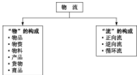
图1-1 摇物流的词义分解

从图1-1中可以看出物流是由“物”和“流”两个基本要素组成。“物”主要是指一切可以进行物理性位置移动的物资资料。如物品、物资、物料、货物、产品及商品等等；“流”主要是指动态性物理位移的模式，分为正