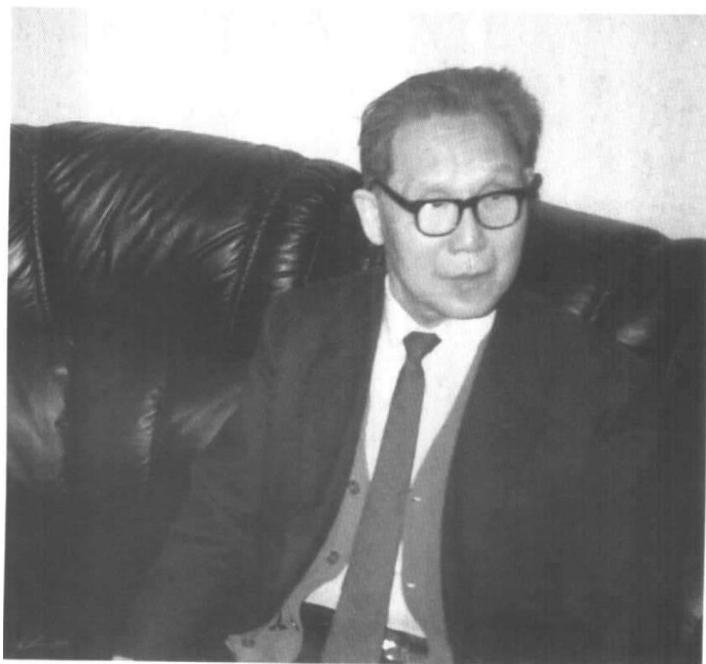
1993年3月16日 在广东湛江审定 中国农业银行高 级职称时留影