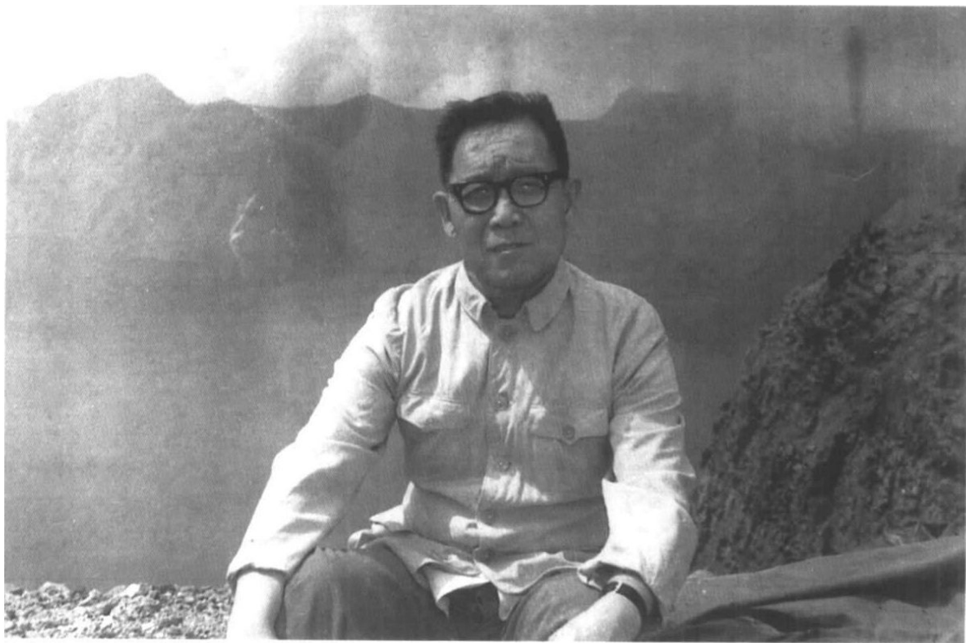
1981年8月摄于吉林长白山上