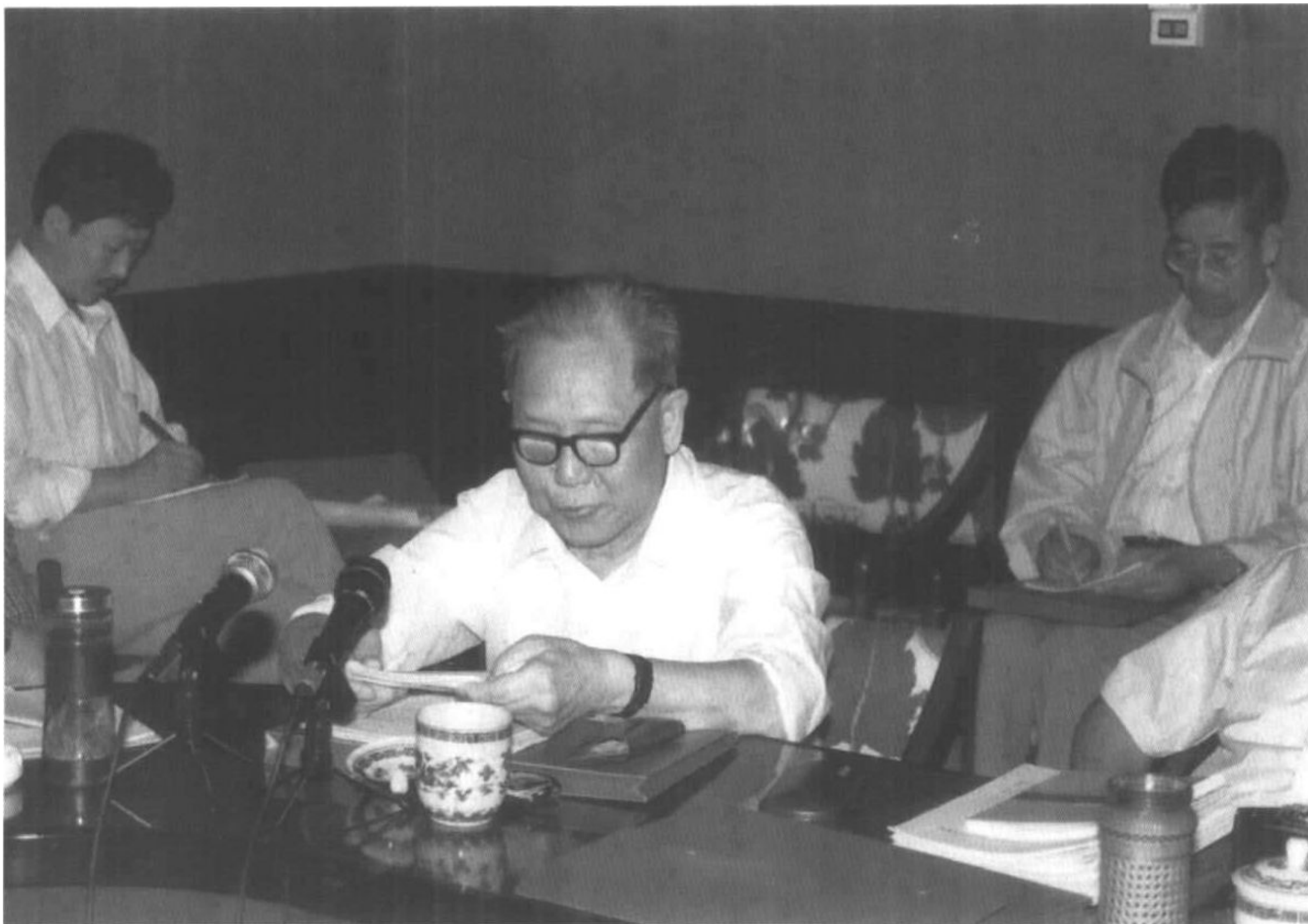
1997年9月在大连经济体制研讨会上发言