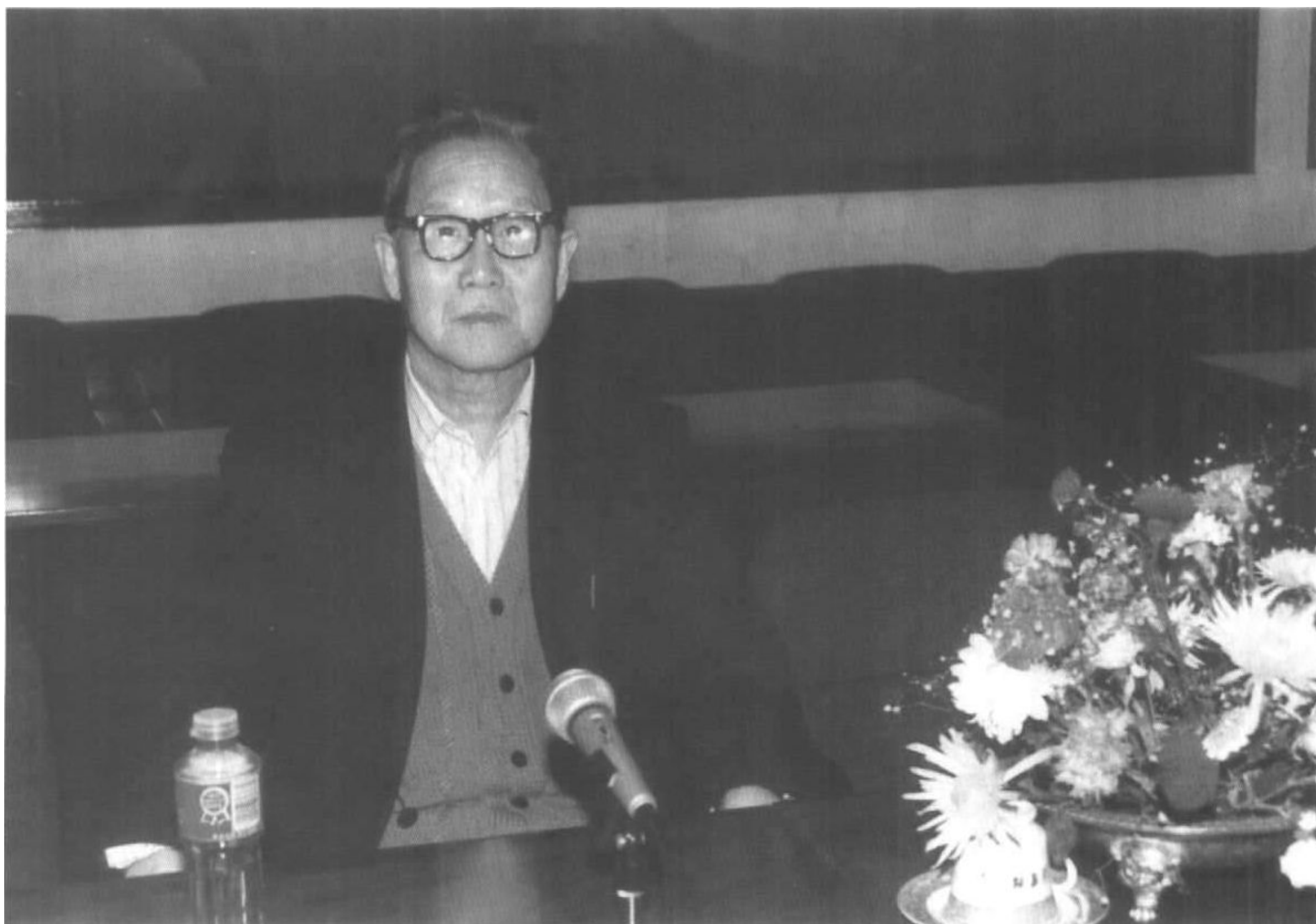
1997年在北京参加中国金融学会年会