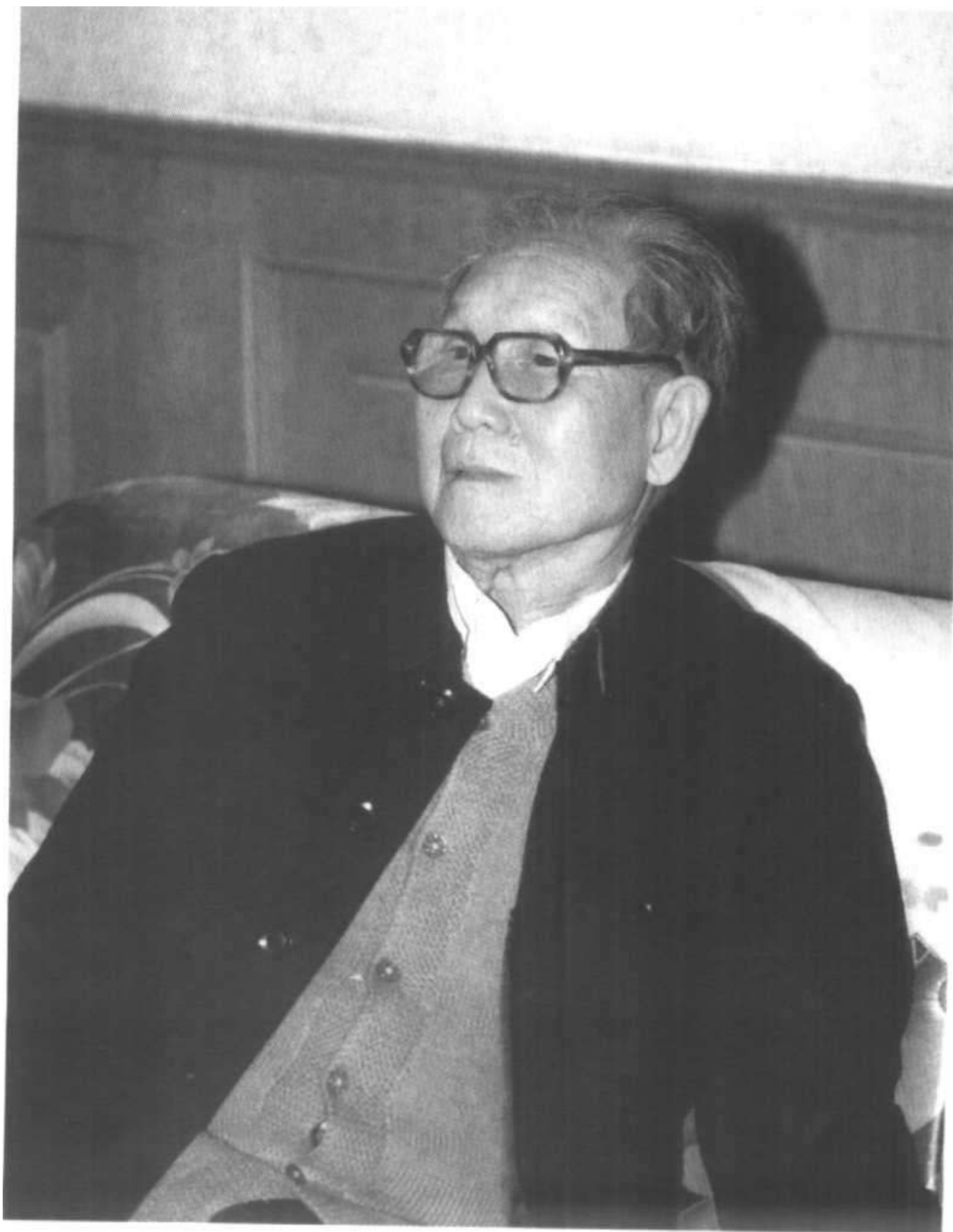
1998年3月7日于农业银行北京分行招待所“农行史（大纲）”讨论会上留影