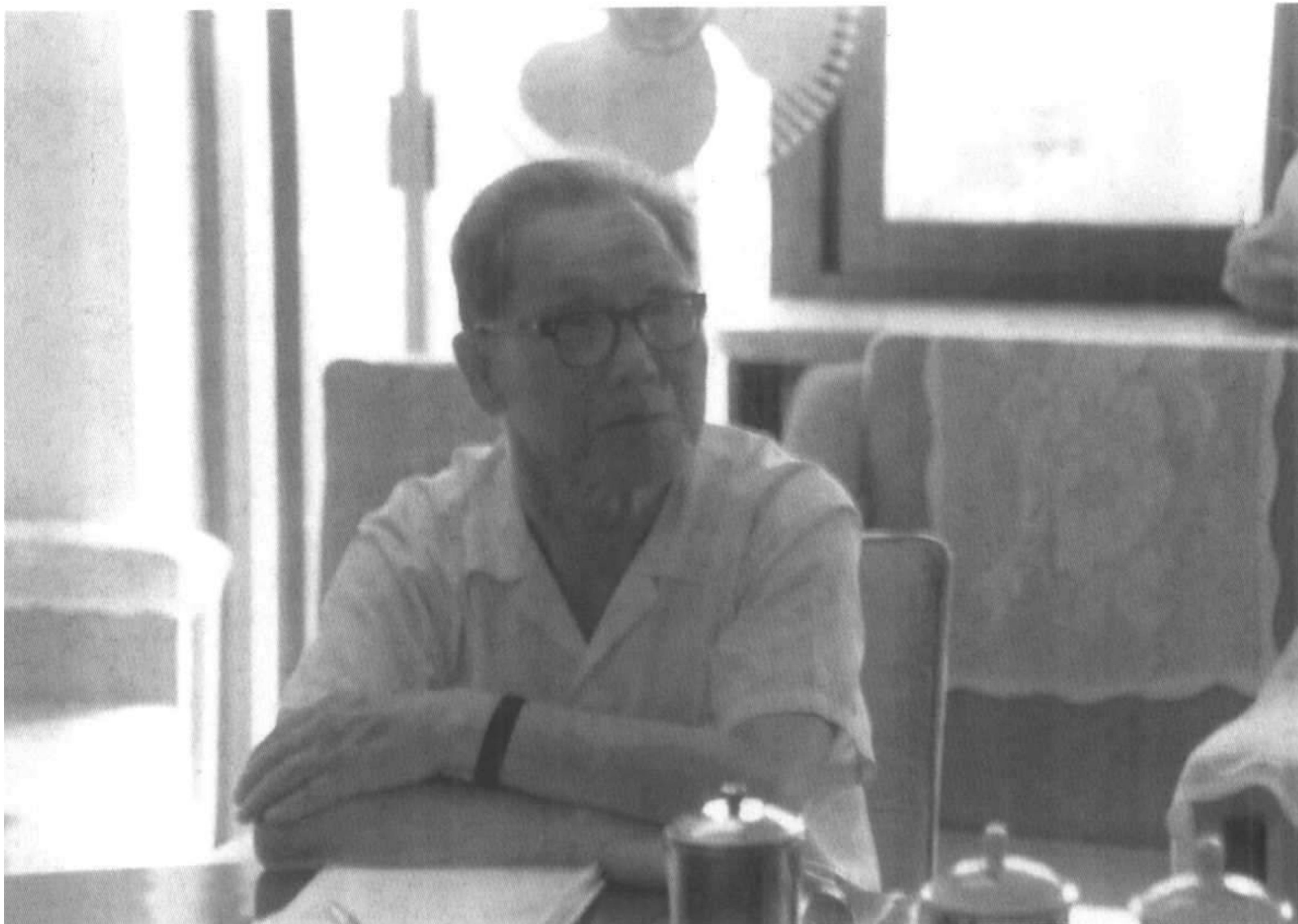
1989年7月29日摄于北戴河农业银行休养所会议室