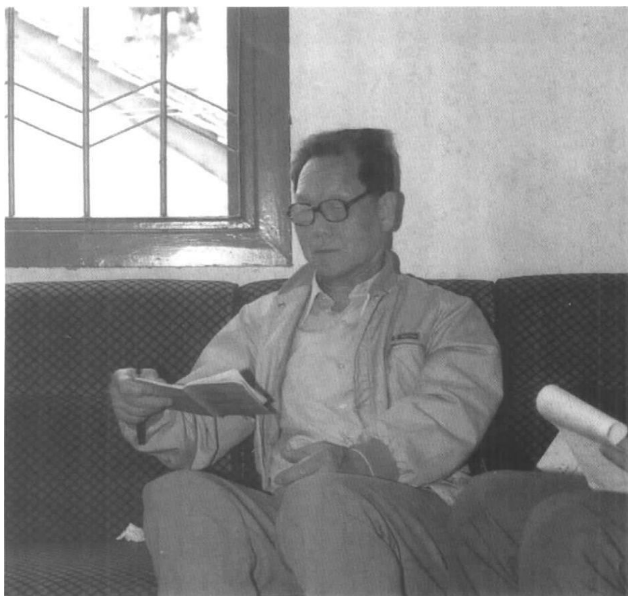
1989年在中国农业银行深圳市分行听取汇报