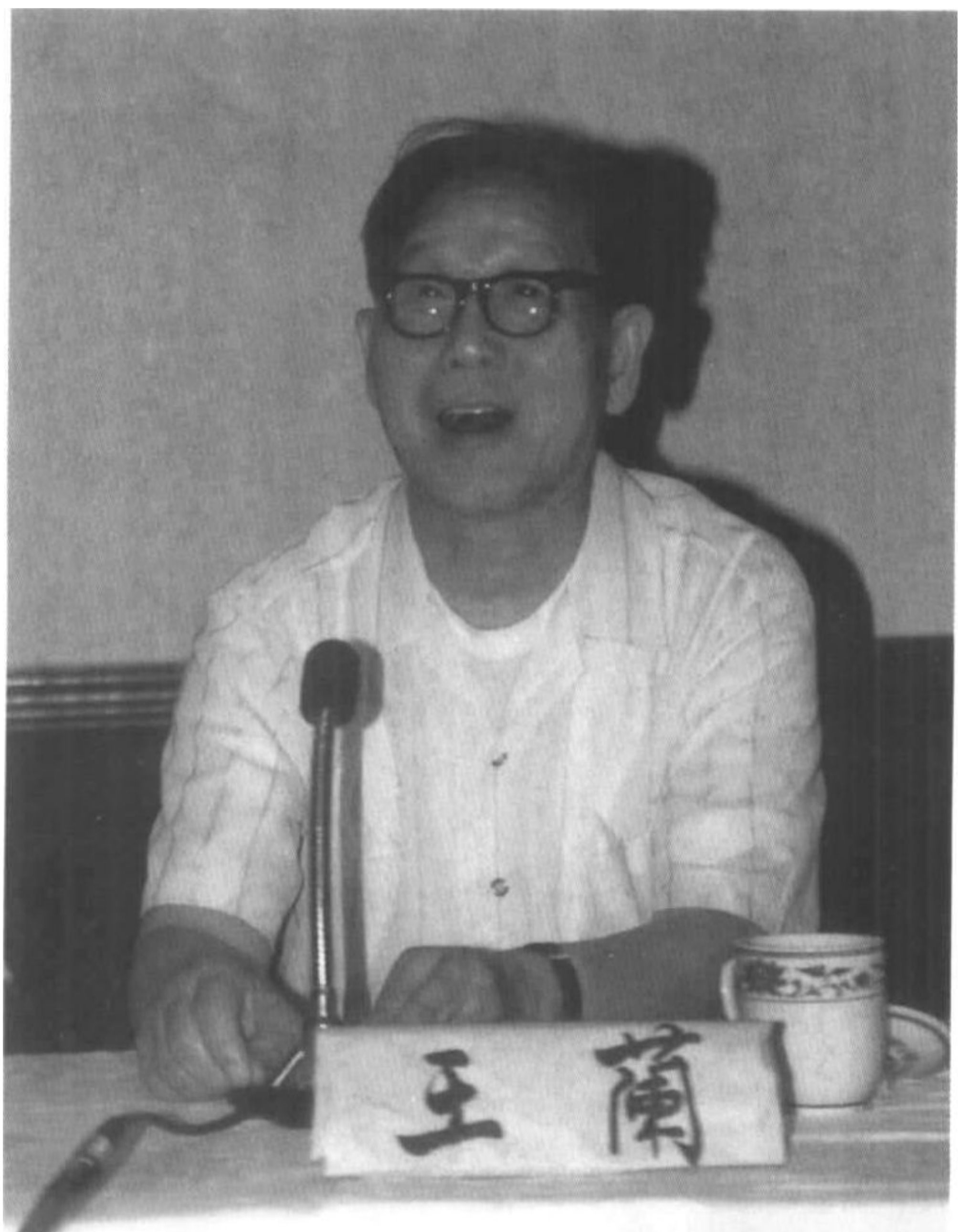
1993年7月10日在朝阳山庄评审会上讲话