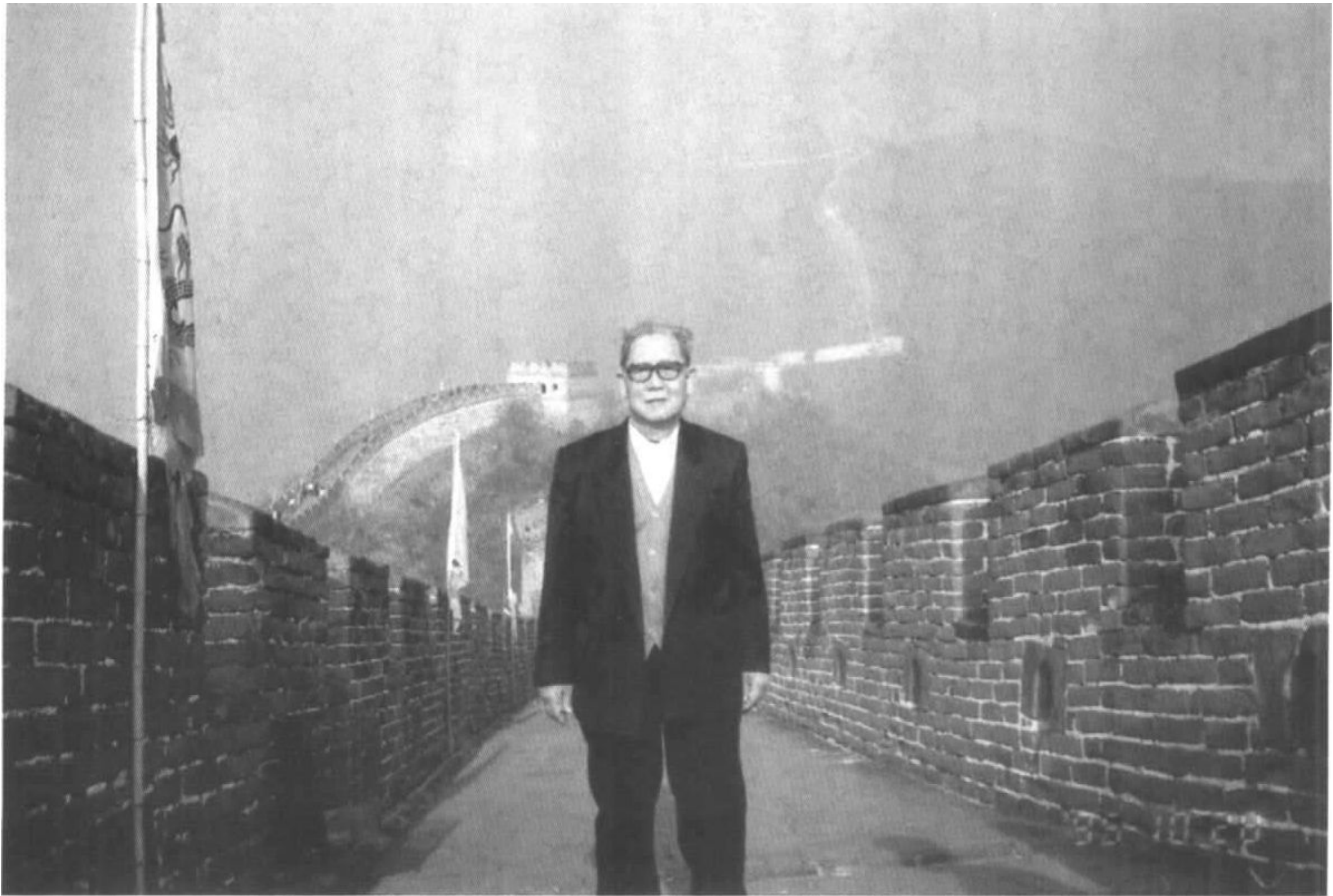
1995年摄于北京慕田峪长城