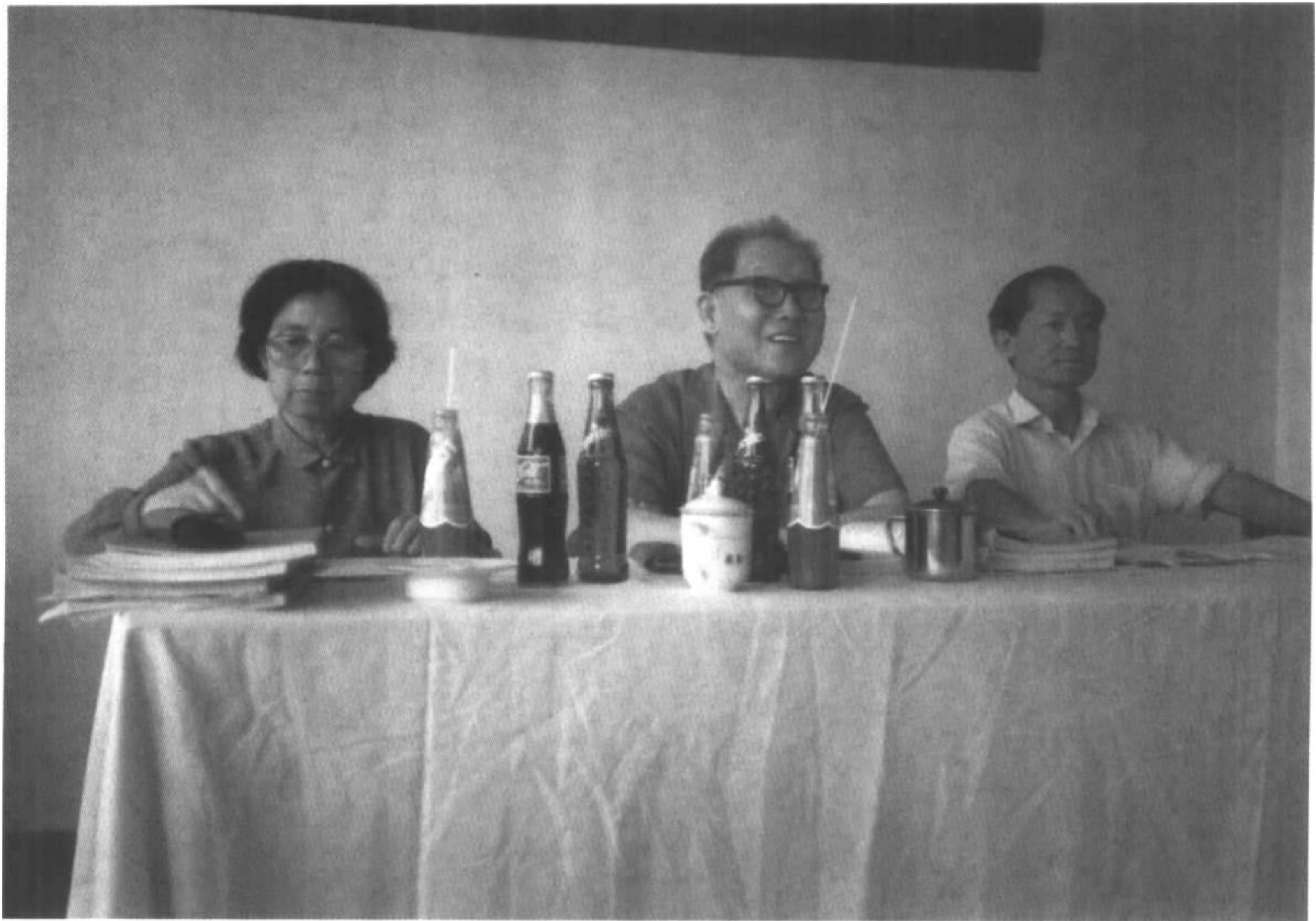
1993年6月8日在天津南开大学研究生答辩会上