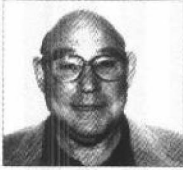
尼尔森 (Richard R. Nelson): 国家创新体系