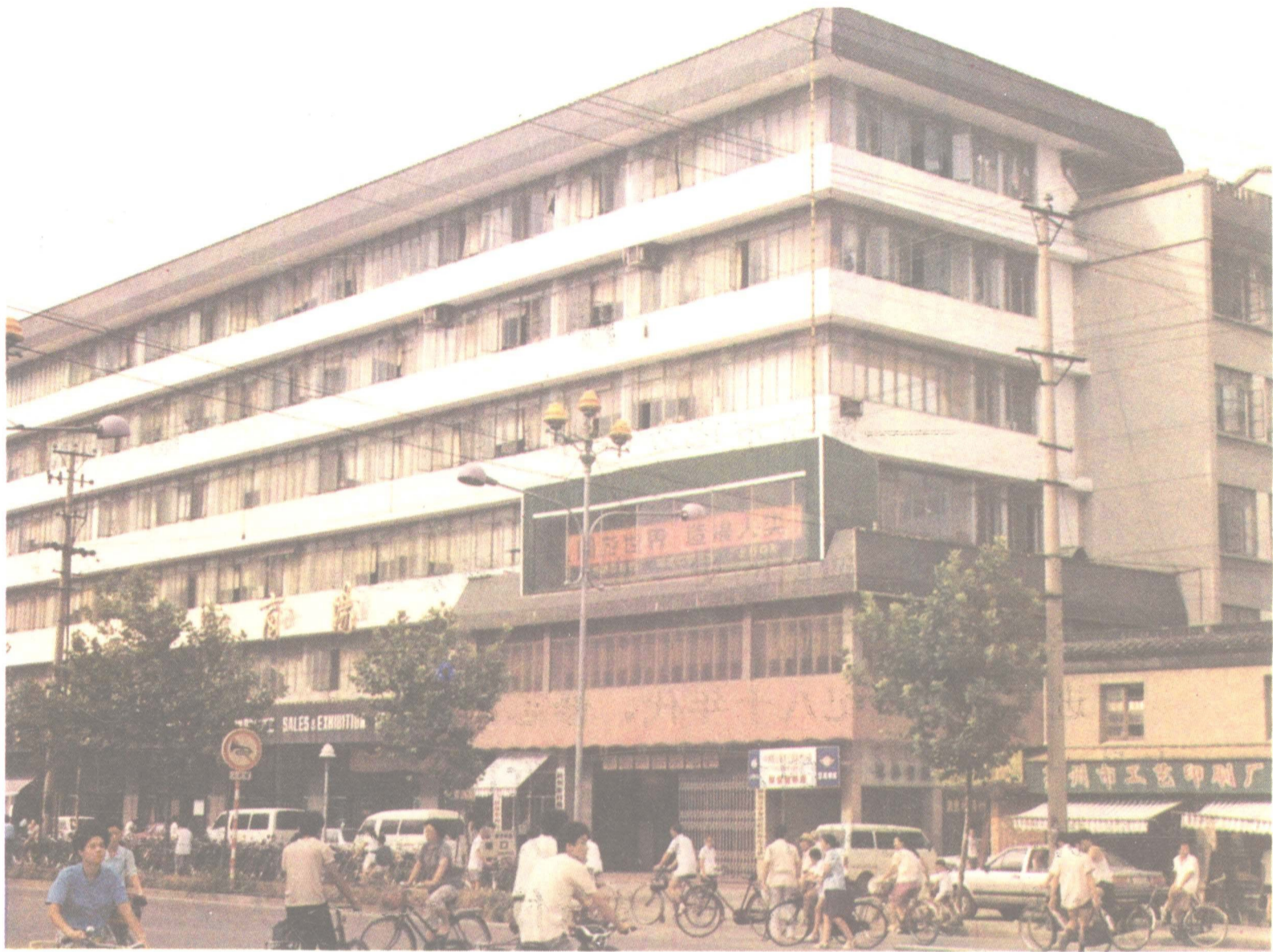
上图为 1985 年建成的外经贸办公大楼,位于人民路。大楼由主楼七层(含地下人防)和副楼五层组合而成,建筑总面积 5645m 2 。