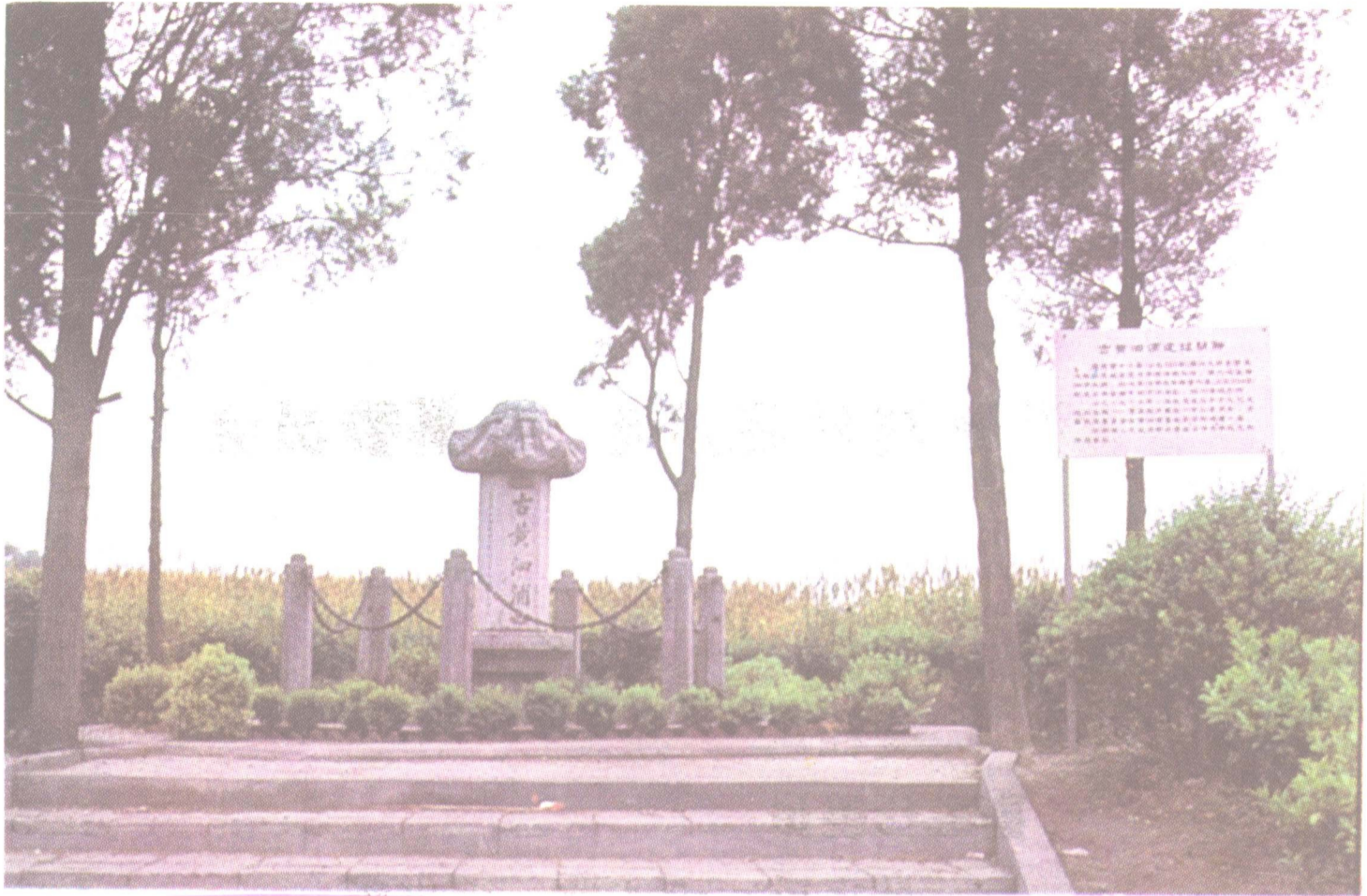
上图：黄泗浦为唐时吴地入海通道之一。公元753年（唐天宝十二年），高僧鉴真由此启航入海，东渡日本。图为1963年鉴真逝世一千二百周年纪念委员会所立之石经幢，上刻“古黄泗浦”四字。遗址在沙洲县（今张家港市）鹿苑镇西三百公尺处。