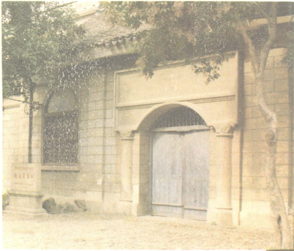
左图为清代苏州织造府旧址，位于带城桥下坊。公元1896年（清光绪二十二年），苏州关监督公署设于织造府内，直至1927年。