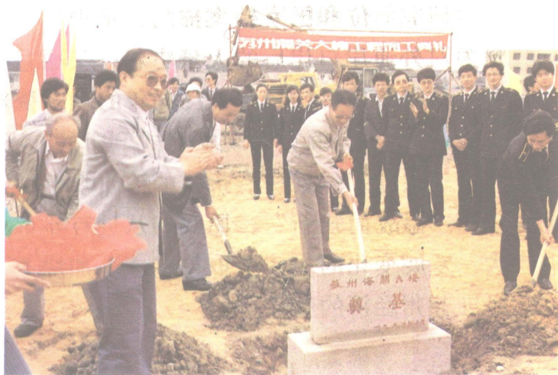
下图为苏州海关大楼奠基开工典礼照,1988 年 9 月,国务院批准设立苏州海关。