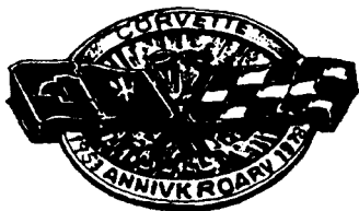
雪佛兰·克尔维特商标

克尔维特是美国通用公司雪佛兰部生产的高级运动车的商标，是沿用17世纪英国一种炮舰的名字。图形商标是1950年设计出来的，于1953年开始在克尔维特运动车上使用。