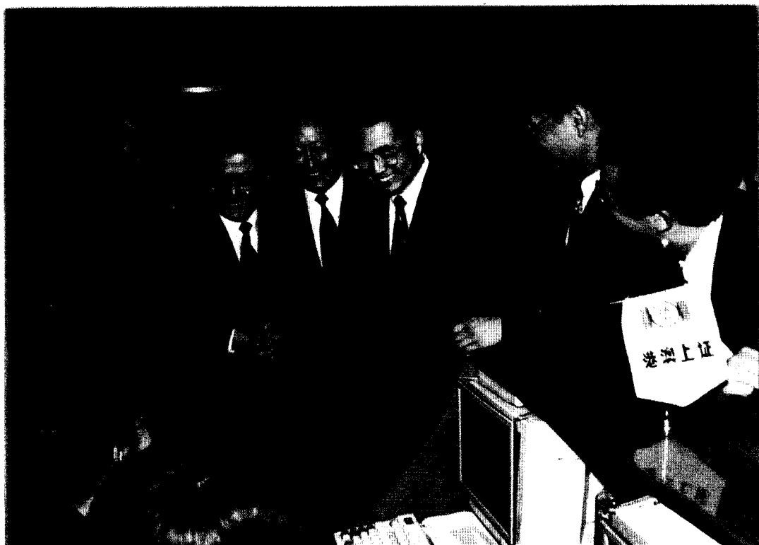
中共中央政治局常委、中央书记处书记胡锦涛视察上海证券交易所