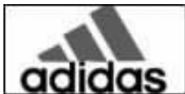
图怨(德国 阿迪达斯)

摇摇此外,随着外国商品的大量进入,一些“洋商标”也换上了中文外衣,这类商标汉译词语也应当属于我们商标语言的范畴,如“阿迪达斯”(粤译:运动服装)、“芬达”(云译:饮料)、“佳能”(悦译:胶卷)、“飘柔”(砾译:洗发露)等(见图怨-员);