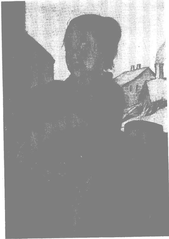
竹久 梦二：《怀抱包袱的女人》（长田干雄藏）