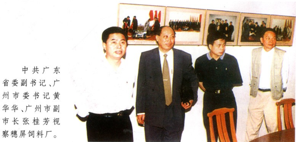
中共广东省副省长、广州市委书记黄华华、广州市副市长张桂芳视察穗屏饲料厂。