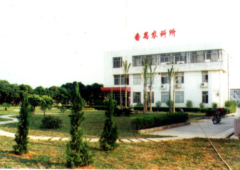
广州市番禺区农科所。