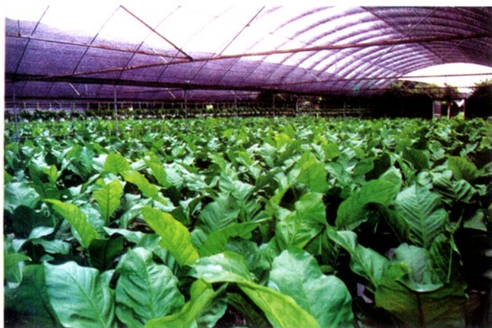
番禺化龙花卉中心的观叶花烛。