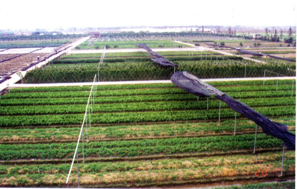
番禺农科所蔬菜基地。