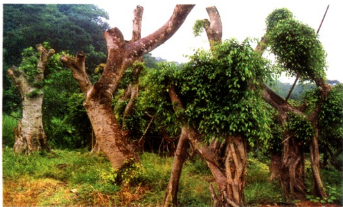
化龙花卉中心的榕树。