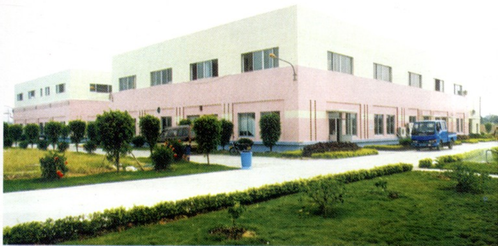
广州市从化顺昌源绿色食品有限公司外景。