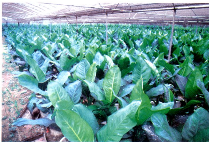
化龙花卉中心的荫生植物。