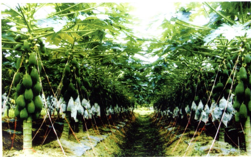
广州水果世界“美中红”木瓜生产基地。