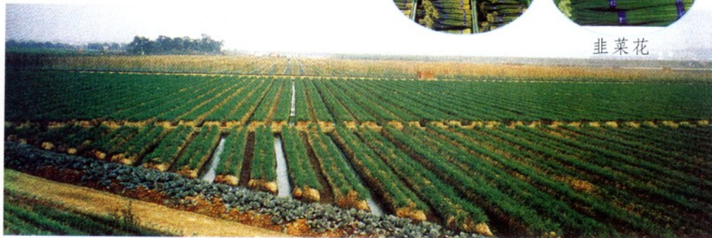
广东东升农场韭菜花基地。