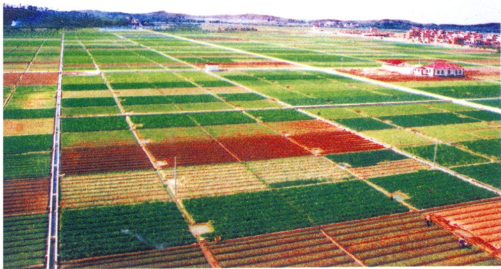
番禺农田标准化建设。