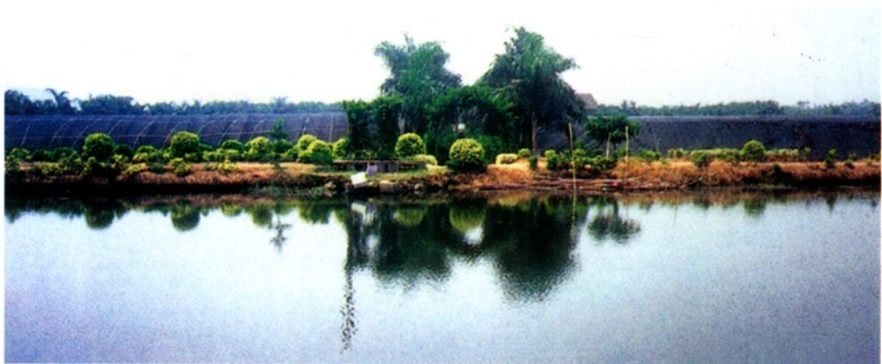
番禺化龙花卉中心观赏鱼养殖区。