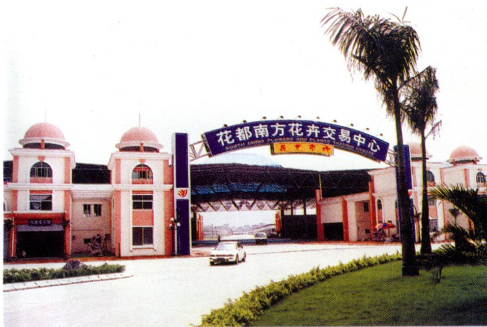
花都南方花卉交易中心。