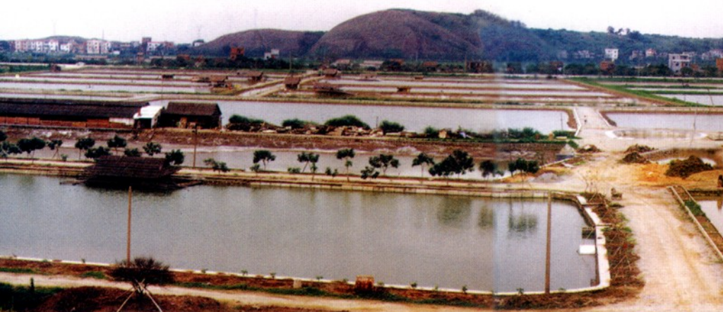
番禺小虎麻虾种苗繁育场全景。