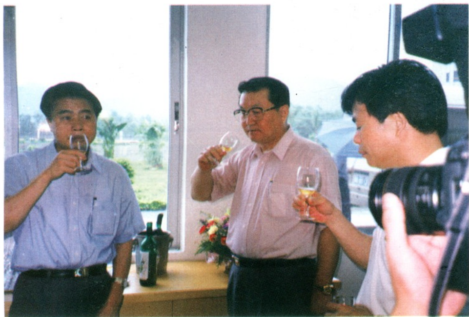
中共中央政治局委员、广东省委书记李长春和中共广东省委副书记、广州市委书记黄华华等领导品尝广州市从化顺昌源绿色食品有限公司的产品。