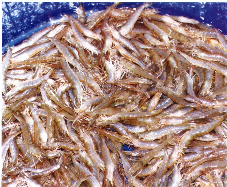
番禺小虎麻虾种苗繁育场。