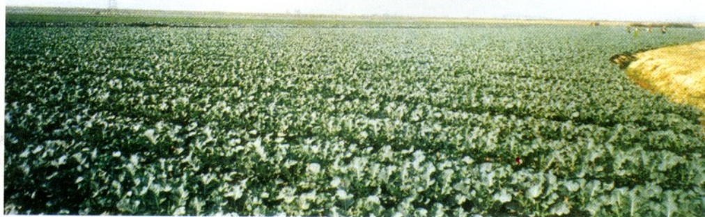
东升农场西兰花基地。