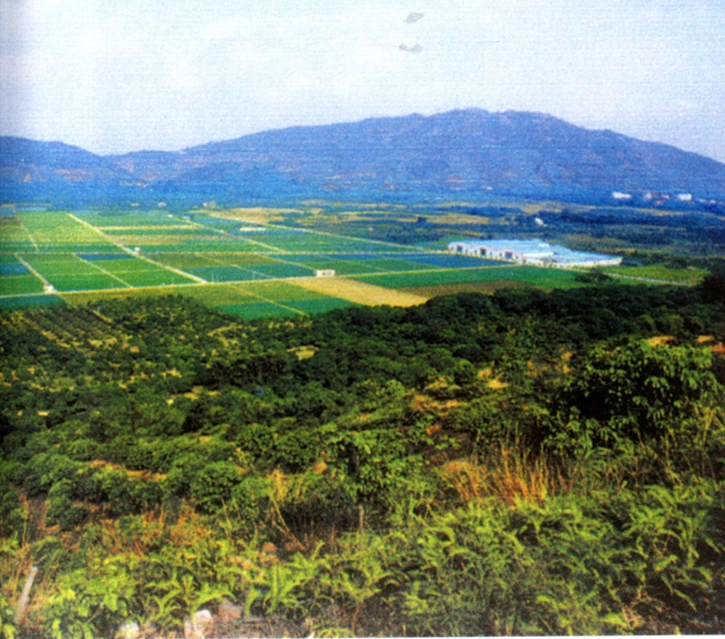
广州从玉菜场远眺。