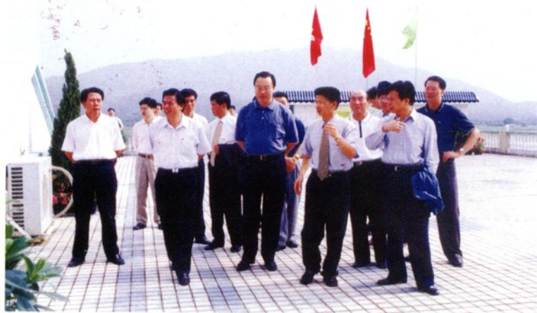
国家农业部部长杜青林（前左三）在中共广东省副省长、广州市委书记黄华华（前左二）等领导的陪同下视察从玉菜场。