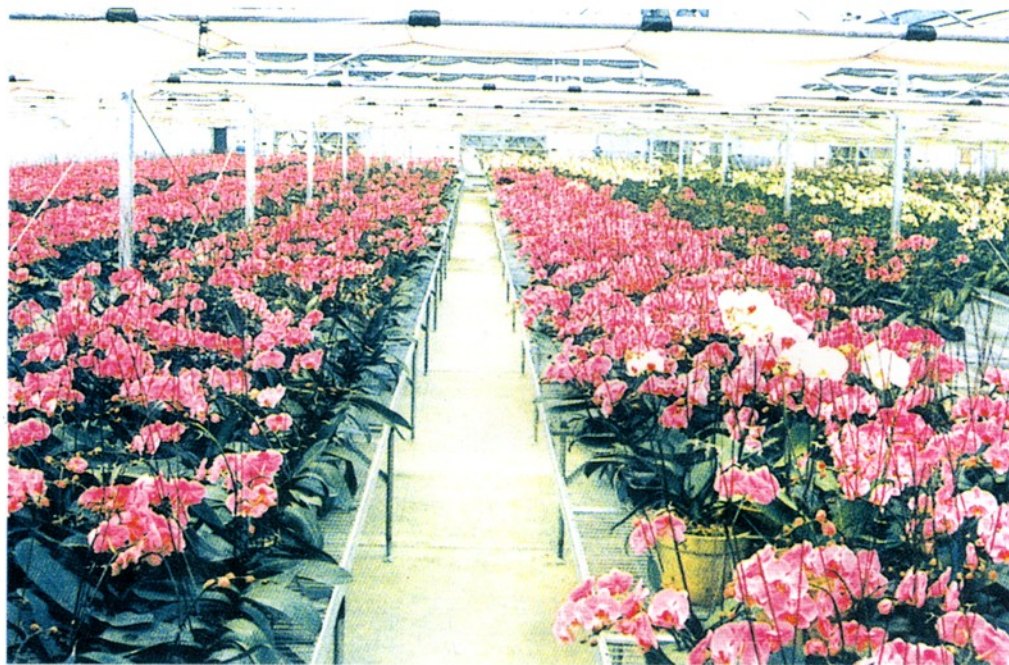
台湾陆仕公司生产的蝴蝶兰。