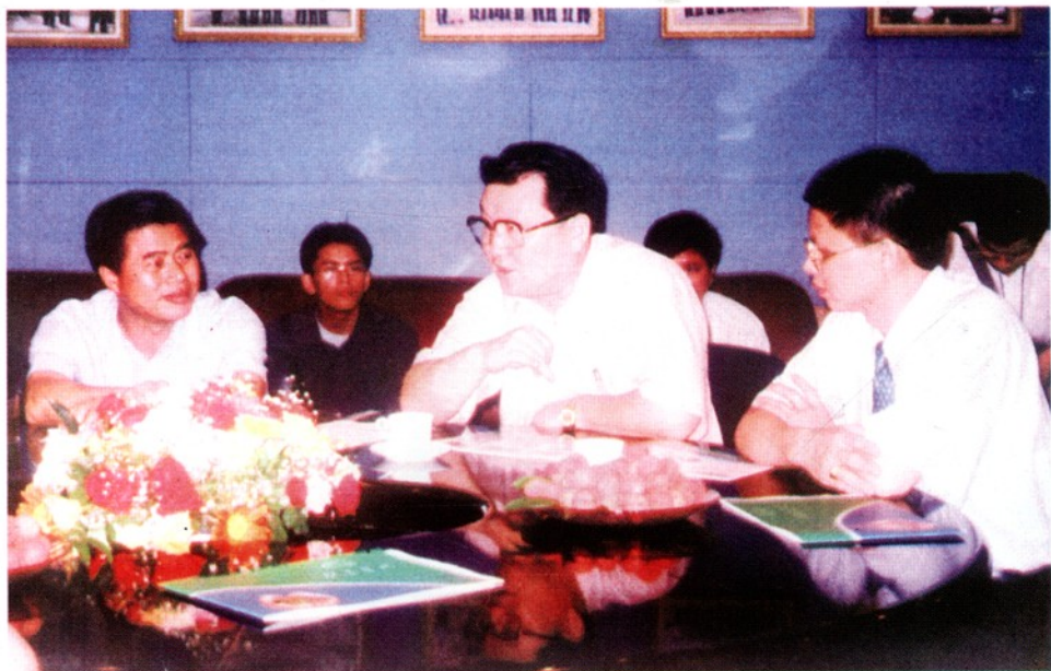
中共中央政治局委员、广东省委书记李长春和中共广东省委副书记、广州市委书记黄华华等领导在从玉菜场调研。