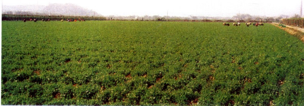
东升农场豆苗基地一角。