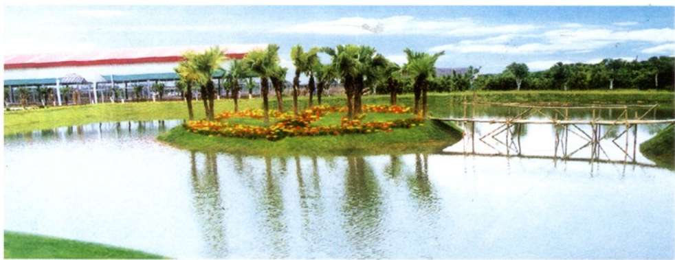
番禺化龙花卉中心湖景。