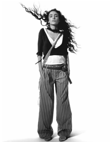
品牌 MANGO 的服装