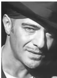
服装品牌迪奥的设计总监约翰·加里亚诺及其服装作品