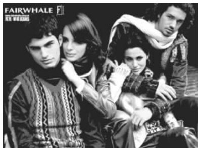
品牌马克·华菲的服装