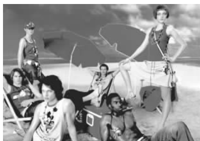
品牌 MICKEY 的服装