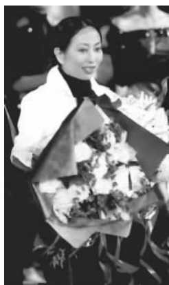
著名设计师吴海燕