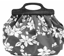
品牌 MIU MIU 的包