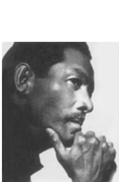
服装品牌三宅一生的设计总监三宅一生及其服装作品