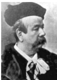
查尔斯·弗雷德里克·沃斯 (Charles Frederick Worth) 及其作品

狭义的服装产品规划含义是:针对目标消费群,对某个时间段内(单季、双季或一年等)上市的服装产品进行整体的规划与控制,尤其是规划整体产品的方向、结构、比例关系,以及各产品开发的前后关系等。“规”是制定方圆,确定方向与规则;“划”是计划、筹划,确定进度与细节。它所强调的是设计任务的清晰化,设计思维的有序化,设计进程的条理化,注重设计结果的结构性、逻辑性和搭配性。它涉及的范围涵盖了从构思到产品实现的全过程。