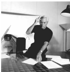
服装品牌阿玛尼的设计总监 乔治·阿玛尼及其服装作品

设计总监必须有自己独特的个性。因为他的深层次的思想和观念往往渗透在整个时装品牌当中,是时装品牌核心文化的重要组成部分。不同个性的设计总监适合不同类型的品牌。如著名时装品牌阿玛尼、三宅一生、阿玛尼、三宅一生和约翰·加里亚诺,他们鲜明的个性与品牌融为一体。乔治·阿玛尼的含蓄、内敛、优雅和注重细节的个性在他的服装产品中体现无遗,阿玛尼品牌已经成为这些词的