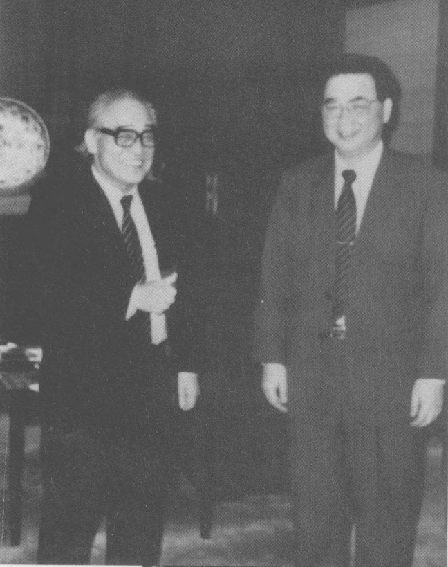
1984 年 4 月，中日友好协会名誉会长王震率 团访日时，在木村一三先生住宅作客情景