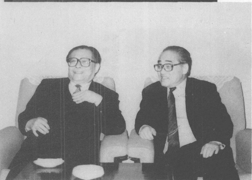
江泽民总书记与木村一三先生畅谈 中日经济合作前景 (1989年10月)