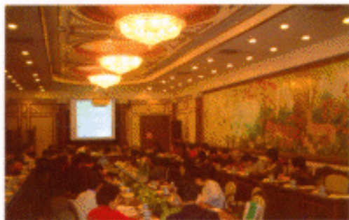
▲ 股票操作高级班培训现场