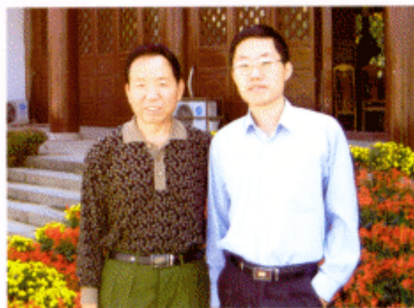
▲ 作者（左）与江汉合影