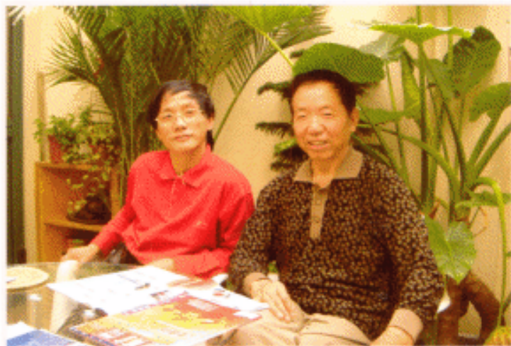
▲ 在股保华家采访时合影