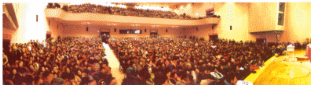
▲ 股林高手在上海演说，引起电影院暴满为历史罕见