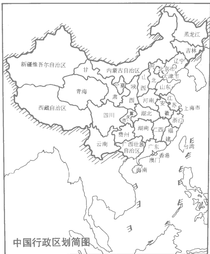
图 1 中国行政区划简图

列能够环绕地球赤道 40 多圈。世界上人口在 5000 万以上的国家被称为人口大国。我国人口在 5000 万以上的省就有 9 个。全国平均每平方千米人口密度 126 人。最密的江苏省每