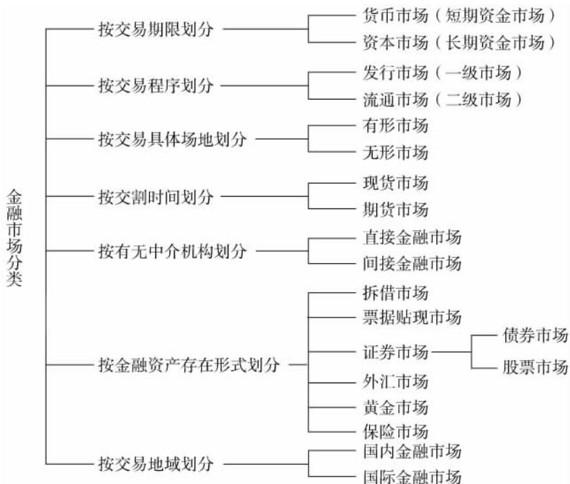
图 1-1 金融市场的分类

金融市场体系是依照特定规则形成的金融市场要素相互联系构成的整体。由于金融交易的对象、方式、条件、期限等要素的不同，人们可以从不同角度对金融市场进行分类，但通常谈论较多的主要是资本市场、货币市场、外汇市场、保险市场等。综合起来，金融市场体系是一个特殊的、独立的体系（如图 1-1 所示）。