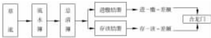
图 1-1 龙门账

我国最早出现的复式记账法是龙门账。它是明末清初由山西豪商傅青山(又称富山)参考当时的官厅会计设计出来的一种记账方法。它把全部账户划分为四大类,即“进”(收入类)、“缴”(支出类)、“存”(资产及债权)、“该”(负债及业主投资)这四大类。其关系为进原缴越存原该。每年年度决算时,也运用上述关系验算等式两边差额是否相等,并借以确定当年盈亏。这种双轨计算盈亏并验查账户平衡关系的方法称“合龙门”,龙门账由此得名(如图 1-1 所示)。