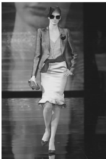
▲图 2-14-1(彩页 15)

致摩登的优雅,增添了几许年轻生动的气息,为经典性感添新意。意式时尚与简约主义碰撞出既年轻优雅又明朗利落的新风貌。(图 2-14-1)