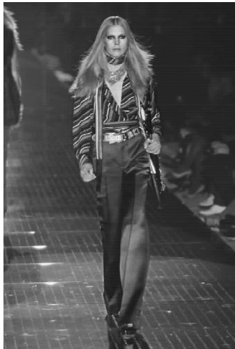
▲图 2-12-1(彩页 15)

的深度和真实。狂热炙烈的朋克浪潮下,撕裂的重金属、泛滥的硬摇滚、性感的紧身衣装束、炫耀的鲜亮色调、方兴未艾的黑人街头文化……这些具深刻时代烙印的 20 世纪 70 年代元素被设计师运用得如指掌。于是,极端的短裤、教士袍的檐状坎肩、搭扣款式的宽腰带,加上热带风情印花的冷艳铺陈,不由分说地就将你拽回至 70 年代喧嚣的迪斯科舞厅,你甚至有随着那些耳熟能详的节奏摇摆身体的冲动。细节处理一样精妙和耐看,中等尺寸的方形漆皮鞋跟、搭襟处的边线、遮盖半脸的茶色太阳镜片、曳动生姿的孔雀尾羽绘图,目及之处尽是岁月无声的永恒印记。(图 2-12-1)