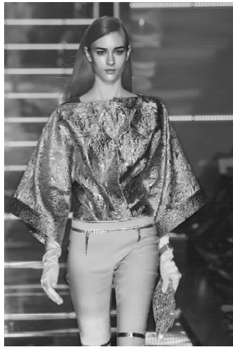
▲图 2-13-2(彩页 15)

除了中性风格,直率、华丽、温柔也在云澜这一季的发布会中完美表现了出来。选用淡淡的金银色作为设计的主色,简洁而又隐隐欲含着高贵气韵。曾到访过中国、游历过印度的云澜对古老东方文化有很深的印象,这款银色的厚缎上装,就融合了不少中装元素。宽袖连肩的平面式结构是典型的中装风格,厚缎衣身和袖口拼接的花纹都是传统的中国纹样,银色缎料配上凹凸花纹演绎出超级华贵,银色衫束上了紧身小马裤,利落而有点运动风格,整体上混溶了古今、东西方等多种对立元素。在细节上,设计师巧妙地在上装上开了个领口衩,银色镶条勾勒出马裤的腰线和裆位,此外在膝处还有贴条装饰,不能不佩服云澜的独到手法,而所有这些细节又不能不令人联想起设计师的建筑设计背景。(图 2-13-2)