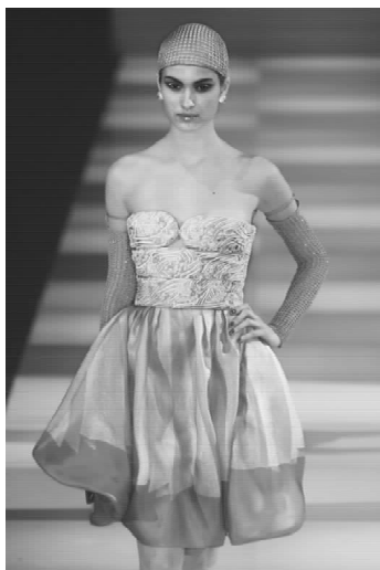
▲图 2-14-2(彩页 15)