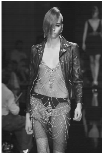
▲图 2-16-1(彩页 16)

1996年秋冬的设计中,设计师将主题转向哥特式的奢华风,他选择了多种面料,如尼龙、毛皮和皮革,都穿插在系列设计中。这款抹胸小黑裙,极端超短设计,衣料紧裹包臀,配合超长的皮手套,性感逼人,是设计师一贯的摇滚风格。黑色的披风,有哥特式风格的影子,传达诡秘的时尚精神,吊带上简单串绳的装饰仿佛把不羁压制在身体内部,这一切使其设计尽显高贵的放肆。在面料上,三种性格完全不同材质被设计师巧妙融和在一起,皮革的狂野、绸缎的光滑、雪纺的飘逸,拼出新鲜的感觉。领部的皮质黑带条是设计的亮点,显现出戏谑清冷,设计师从细节入手,给戏谑加上了缰绳,给欲望限定了边界,制造出一种疯狂的摇滚风情。(图 2-16-2)