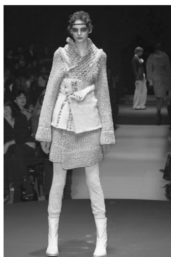
▲图 1-2-2(彩页 1)