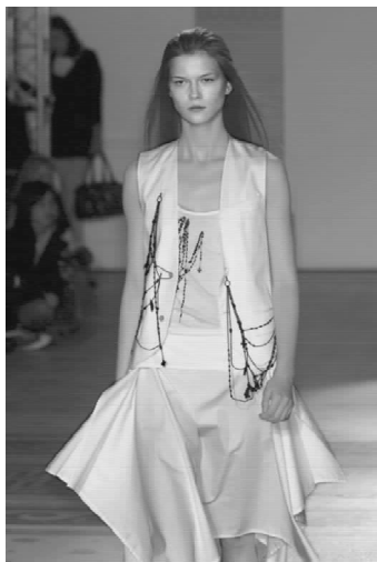
▲图 1-1-1(彩页 1)

每季 2012 年的最新设计,你都品味出品牌独具的时尚魅力。在其 2012 秋冬秀场中,厚实的粗棒针织成为主打,不同针法的运用幻化出出彩的肌理效果。粗针大衣在侧开领形上形成不规则的层层堆砌,这是整款设计重点,在视觉上别具冲击力。袖口的翻折与领部处理相呼应,并加重了服装的粗犷质感表现。宽松、舒适的长袍结构在腰间以束腰处理,带出几分轻松随意的休闲感觉。一抹艳丽的红色从密实的大衣底端窜出,与大面积的灰色相衬格外显眼明亮,仿佛一下子点亮了沉寂的冬季。这种设计手法正是设计师所要传达的 2012 年的设计内涵,即传统和现代、平淡和惊艳本为矛盾因子互为交替。(图 1-1-2)