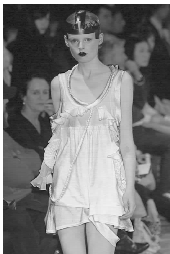
▲图 1-2-1(彩页 1)