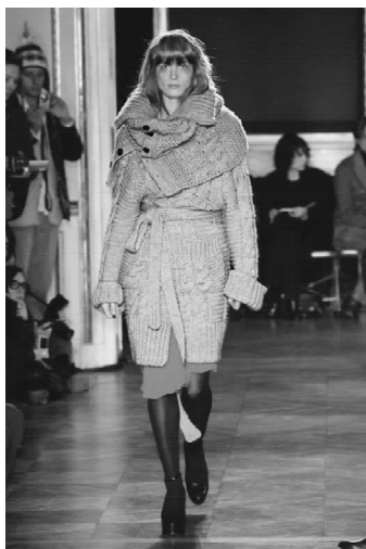
▲图 1-1-2(彩页 1)