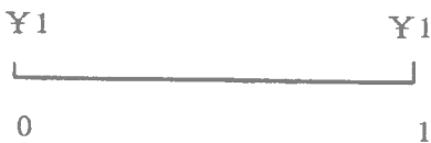
图 1—3 时间示图

公理 2 货币具有时间价值——今天收到 1 元价值的价值要高于未来收到 1 元价值的价值 财务管理中的一个基本概念就是货币具有时间价值，即今天收到 1 元与 1 年后收到 1 元的价值是不等的。如图 1—3 所示：