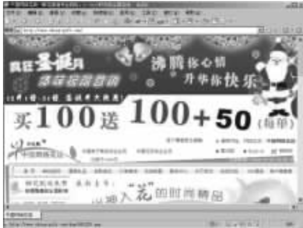
图 网络中国网络花店

一位母亲通过网购查看了几家在线鲜花供应商后，选择了喜欢的一家，订了一束鲜花作为生日礼物送给她的儿子。此时她的儿子正在外地讲学。生日的那天，她的儿子收到了鲜花供应商送来的母亲给他的礼物。