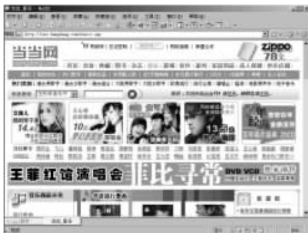
图 1-1 当当音乐

一位青年听说他最喜欢的一位演唱家新近出版了一份专集。他从网上连到一家电子音乐商店，下载并试听了几分钟这份专集，他很喜欢，于是就从网上订了一盒“悦悦”，第二天就收到了。