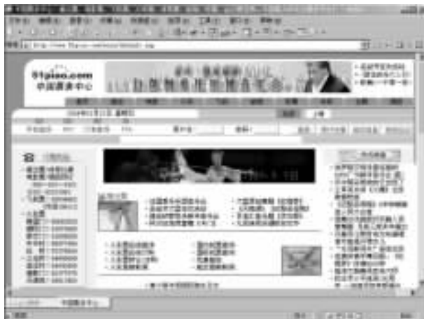
图 网络中国票务中心

一对新婚夫妇正在制订蜜月旅行计划，他们在网上找到一家旅行社。通过一种交互系统，这对夫妇查看了他们目的地的航班时刻，其中有多种选择方案。几分钟后，他们选择了一个行程方案并预订了机票。次日他们就收到了机票。