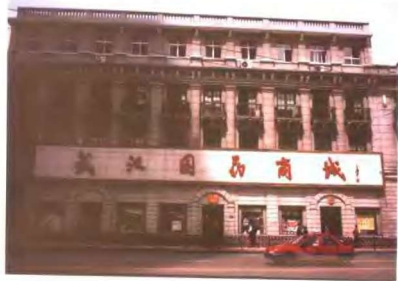
图为武汉市江汉区药材公司，原为京都达仁堂乐家老铺汉口旧址