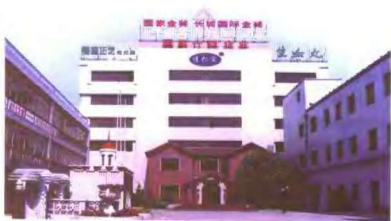
天津中山路达仁堂制药厂厂房全景