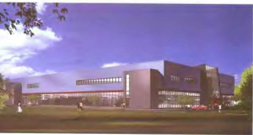
达仁堂在天津滨海新区新建的厂房外景