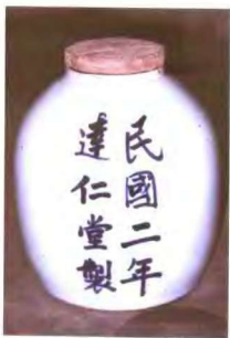
达仁堂文物——药坛子