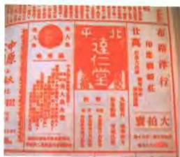
當年大仁堂在《大公報》上刊登他的廣告