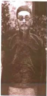
乐达仁为中药而忧 ——达仁堂创始人乐达仁