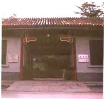
乐达仁私宅，建于民国初年，现为北京郭沫若纪念馆