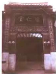
达仁堂估衣街旧址