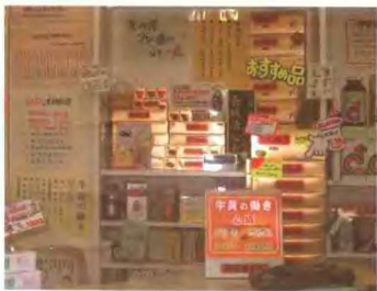
达仁堂的牛黄清心丸在日本称为长城清心丸, 图为日本药店一角