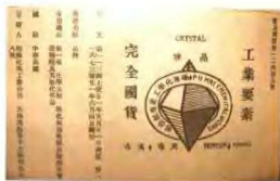
渤海化工股份有限公司註冊商標