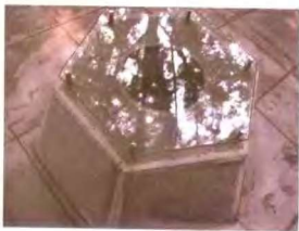
达仁堂私宅使用的水井，该井曾废弃多年，2000年5月恢复