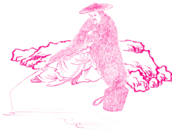
大钓得天下，小钓食鱼虾

得到的时候就会有所失去，失去的时候也会有所得，得与失是相伴相随的。要想取之，必先予之，懂得给予是为了取得，是从商的法宝。失去的多，得到的也多，失去后又重新得到的就会更多。表面上看起来大得者有如大失一样，大失者有如大得一样。