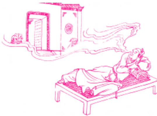
商海风云多变幻，兴衰迭替亦平常

兴旺的时间久了就可能会衰败，衰败的时间久了就可能会兴旺，兴衰是相互更替的。特别兴旺的商家，很多人的眼睛就会紧盯着它，想有大的作为就会受到很多的约束。比较衰败的企业，很多人都会忽视它，想有大的作为反而就比较容易。商事衰败就应谋求变革，通过变革求得兴旺，衰败之后再复兴就会比原来更兴旺。表面上看起来大的兴旺就好像衰败一样，大的衰败也好像兴旺一样。