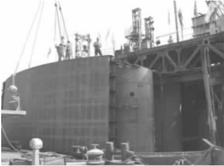
图 18 主 5 # 墩钻孔施工和无底钢套箱下沉平行施工