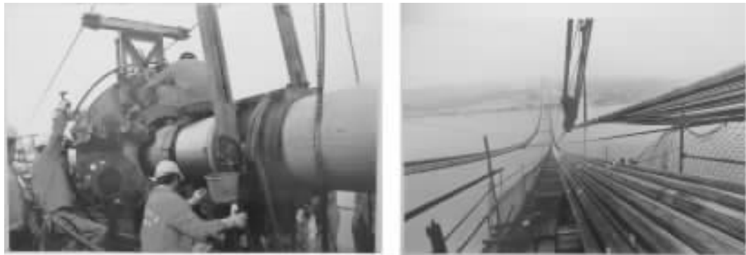
图 15 PPWS 法架设主缆