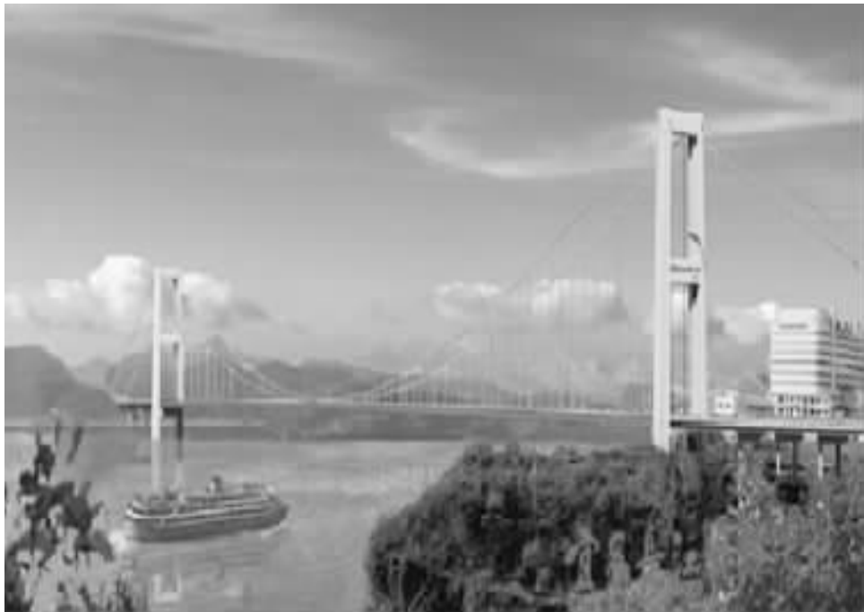
图 14 宜昌长江大桥

1998 年到 2001 年建成宜昌长江大桥 ,主跨 960m 悬索桥 ,是当时我国独立完成设计和施工的特大跨度悬索桥。