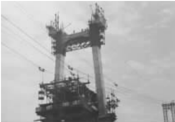
图6 滑升翻模施工索塔