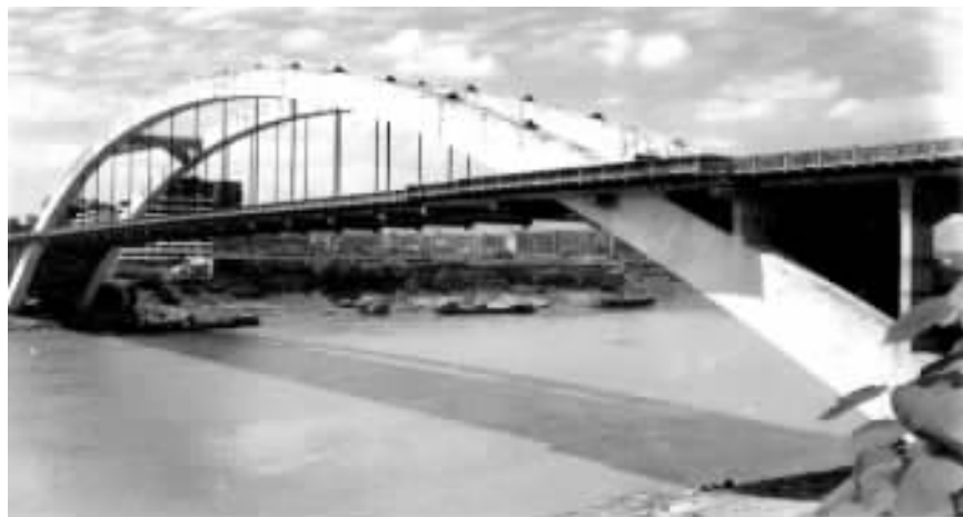
图 3 宜宾小南门岷江大桥

1986~1989 年建成,主跨 240m 中承式钢筋砼肋拱桥,型钢劲性骨架成拱。是当时国内最大跨度的砼肋拱桥。缆索吊机无支架吊装型钢节段成拱。