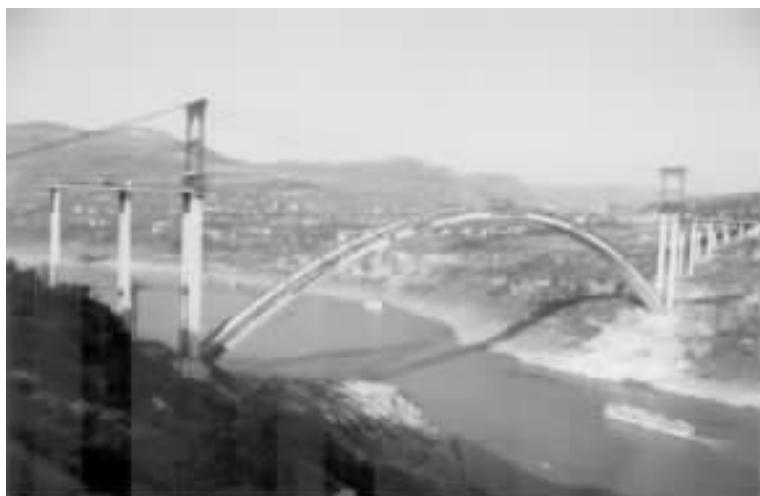
图 13 六工作面施工

索吊机体系复合组成。斜拉桥部分由索塔、钢管桁架和扣、锚索(含地锚)组成,调整扣(锚)索力使其水平分力之和等于“零”。缆索吊机体系的吊装塔铰结安装在扣(锚)塔顶,不设横向缆风,最大起吊能力 80t。安装误差 \leq 1/5000 ,满足设计要求,该项技术获国家实用新型专利(专利号:zL 99230802 X)。