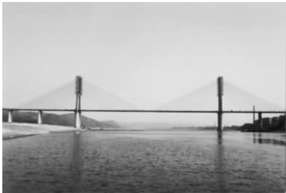
图 4 犍为岷江大桥