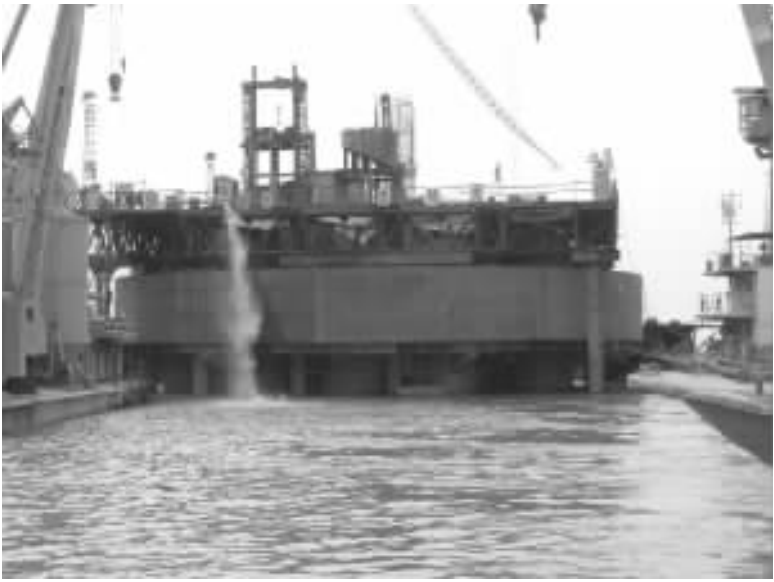
图 17 主 6 # 墩钻孔施工与有底钢套箱下沉同时作业