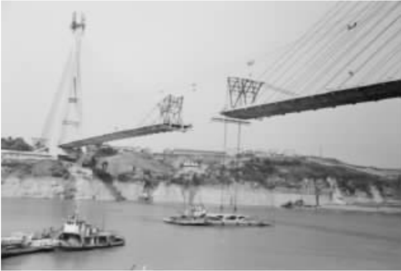
图9 三角吊机悬拼主梁

质优价廉,该桥的斜位索使用至今已逾十年,质量良好,斜拉索 PE 料的性能为:密度 0.934kg/ml,熔融指数 0.15g/10min,抗张强度: >17\text{MPa} ,易脆温度 <-85^{\circ} ,耐环境应力开裂 >2000\text{h} ,PE 护套设计厚度 5~7mm。