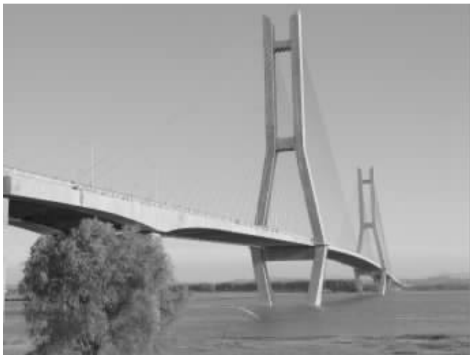
图 16 鄂黄长江大桥

φ3.0 钻孔灌注桩。采用钢套箱施工方案：在河床上抛掷沙袋稳定覆盖层，打入钢管桩搭设水上施工平台，上游抛拉锚稳定施工平台获得成功，采用有底钢套箱，完成部分钻孔灌注桩后，钻孔施工和下沉钢套箱施工同时进行，一个枯水期将索塔施工出水面，该施工技术为大型深水基础施工提供了一种新的方法。（注 6# 主墩由二航局施工）