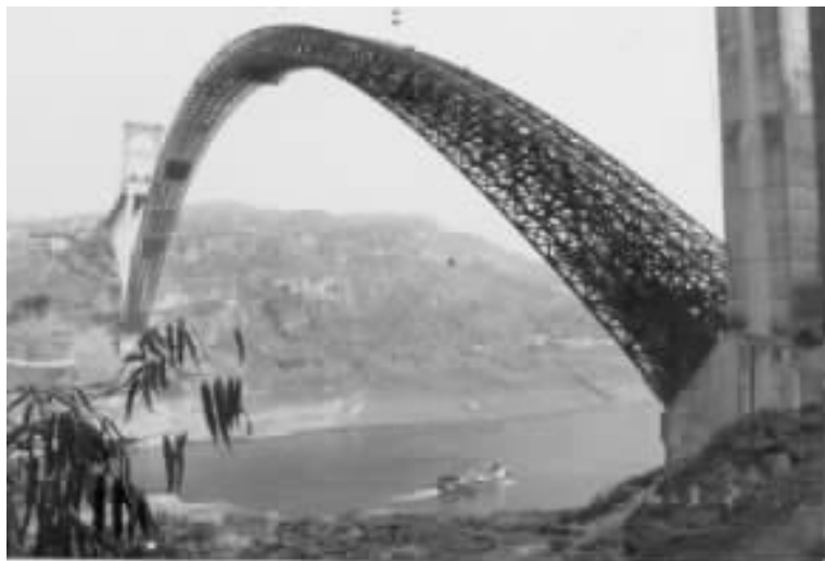
图 12 缆索吊机悬拼 36 段劲性

索吊机体系复合组成。斜拉桥部分由索塔、钢管桁架和扣、锚索(含地锚)组成,调整扣(锚)索力使其水平分力之和等于“零”。缆索吊机体系的吊装塔铰结安装在扣(锚)塔顶,不设横向缆风,最大起吊能力 80t。安装误差 \leq 1/5000 ,满足设计要求,该项技术获国家实用新型专利(专利号:zL 99230802 X)。