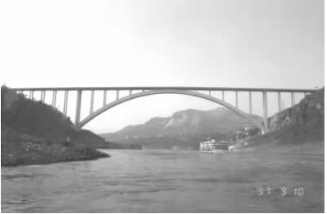
图 10 万县长江大桥

1994 年到 1997 年建成万县长江大桥,主跨 420m 上承式钢筋砼拱桥,钢管砼劲性骨架成拱,世界第一大跨砼拱桥,无施工先例,本桥创造的施工技术为建造更大跨度拱桥提供了样板。