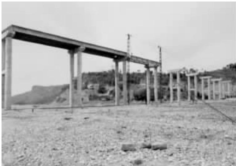
图 7 格构扒杆吊装 30mT 梁

五通岸的 13 孔 30mT 梁在河滩预制,无进场道路,采用两台格构扒杆将 60t 重的 30mT 梁抬吊 32m 高安装,每孔间的扒杆移位利用约鱼法行走。两副扒杆重 15t,使用钢绳 5t,5t 卷扬机 4 台,每天可安装 2~3 片 T 梁,3 个月完成全部 T 梁安装。成本低,安全稳妥。