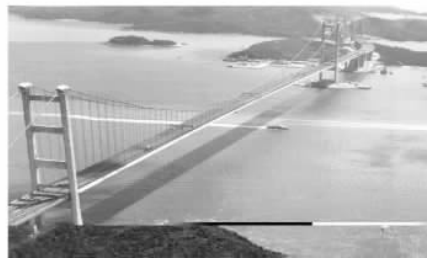
图 1-3 香港青马大桥

我国钢桥建设铆接结构进展到栓焊结构，从钢桁架梁发展到正交异性板桥面的钢箱梁，研制了板厚效应小( 56\text{mm} 厚)，焊接性能和韧性好的 15\text{MnVN}_q\text{—C} 桥梁钢，为我国建造大跨钢桁架桥、钢斜拉桥和钢悬索桥创造了条件。进入 20 世纪 90 年代后，我国经济发展飞跃到新台阶，需要建设更大跨径的钢桥。现代化悬索桥的发展，国外走了百余年的历程，我国从第一座现代化悬索桥建设始至今只有 10 余年的历史。到 20 世纪末，已建成 4 座大跨悬索桥，具有代表意义的是香港青马大桥，全焊钢箱梁结构，主跨 1377\text{m} ，1998 年建成(图 1-3)；江阴公路长江大桥，该桥为全焊钢箱梁结构，主跨 1385\text{m} ，1999 年建成通车(图 1-4)。