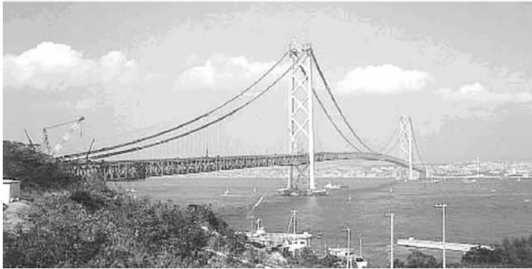
图 1-7 日本明石海峡大桥

20 世纪中叶时，第二次世界大战结束，各国经济迎来恢复发展时期，大量被破坏的交通设施需要修复。在电子计算机出现后，结构计算理论与方法的飞跃使工程师们爆发出巨大的创造力，使一些早期构思的、属于复杂的高度超静定的结构形式获得了新的生命力，异军突起的是斜拉桥体系。联邦德国于 1952 年便在达塞道夫(Dusseldorf)先后建成 3 座钢斜拉桥，主跨为 260~320m，形成独塔、双塔、双索面、单索面相匹配的典型斜拉桥体系，至今被誉为“斜拉桥家庭”。经过 50 年的发展，斜拉桥跨径已跃至 890m。