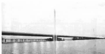
图 1-6 杭州钱塘江三桥

此外,结合我国情况,在修建钢筋混凝土桁架拱桥的基础上,还发展了预应力混凝土桁架拱桥与桁架 T 构桥。1985 年建成的贵州江界河大桥,为预应力混凝土组合悬臂桁架拱-梁体系,主跨已达 330m。