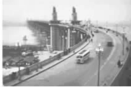
图 1-2 南京长江大桥

步过渡到栓、焊连接。在公路和铁路上修建了一些大跨度钢桥，如 1972 年建成的山东北镇黄河大桥，主桥采用 4 \times 112\text{m} 的栓焊连续钢桁梁桥。1993 年建成的九江长江大桥铁路部分长 7657.4\text{m} ，公路部分长 4215.9\text{m} ，跨度为 216\text{m} 。进入 20 世纪 80 年代，我国又发展了钢箱梁结构，1982 年在陕西安康建成箱形截面、栓焊结构的铁路斜腿刚架桥，跨径 176\text{m} ，是目前该种桥型铁路桥的世界纪录。1984 年在广东省建成了采用正交异性板桥面、栓焊结构的钢箱梁桥。