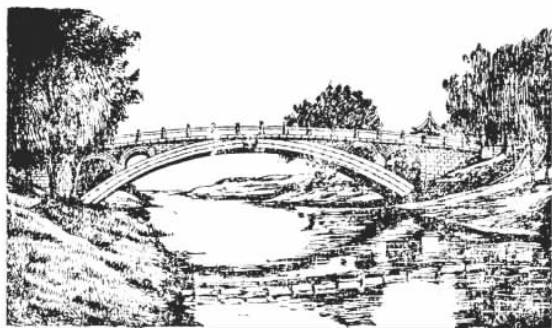
图 1-1 赵州桥

天然石料是大自然赋予人类最早的、取之不尽用之不竭的建筑材料。一旦人们创造了强有力的加工工具,石梁、石柱、石拱等结构无疑就普遍发展起来;又鉴于石料的耐久性,因此几千年来修建较多的古代桥梁要推石桥居首。我国古代桥工巨匠的辛勤劳动曾对桥梁建筑作出了卓越贡献。