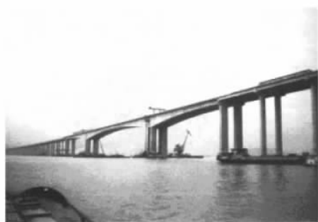
图 1-5 广东虎门辅航道桥