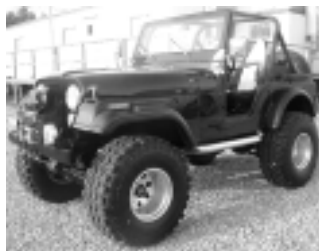
1971 年生产的 Jeep CJ5

增。如吉普的诞生地托利多专门生产传统的威利斯式的美式小吉普，而设在 South Bend 的 AMG（美国综合汽车公司）则负责生产吉普的变型车、改装车和专用车。