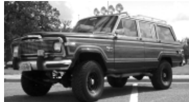
切诺基的前身大瓦格尼

如果你是一个熟悉现代 SUV（运动型多用途车）的吉普爱好者，那就一定会对瓦格尼（Wagoneer）这个名字不陌生，至少当你看到关于它的历史图片时，会深深感到与瓦格尼不曾谋面却也似曾相识。不错，因为瓦格尼就是近几年风光无限的 SUV 车系的开山鼻祖，所以也难怪我们看着它亲切了很多。自从吉普瓦格尼在 1962 年秋正式上市以来，它就一直保持着四轮驱动的技术先进性、造型新颖而时尚的内饰豪华性以及车身无比宽敞舒适的三大特点，所以在它成就了吉普汽车史上第一款民用车型封号之后的 30 年间，瓦格尼也为 SUV 车种的定型书写下重要的一笔。而由于其波及面之广，在网络上或是现实生活中，我们也随处可见它的买卖活动。可以说，它真正成为了最深入到人们生活中的代步工具，同时也完完全全地影响了几代人的思想与追求。