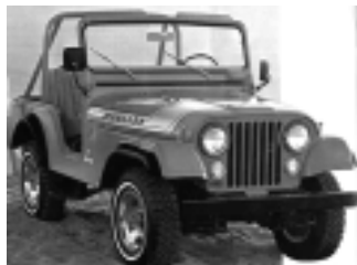
1972年生产的 Jeep CJ 系列

1972年，为了真正提高吉普公司产品的品质，树立吉普的非凡动力形象，AMC公司的新举措出台了。凡是AMC公司的产品，无论它是瓦格尼还是斗士 J-4000 或是普及型的 CJ 系列