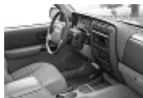
2001 年生产的切诺基的替代品 吉普自由人