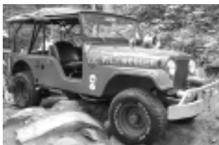
1972年生产的 Jeep CJ6

吉普车，此时都可以选装 AMC 的 V8 王牌动力发动机。吉普公司还不断完善很受吉普迷欢迎的 CJ5 和 CJ6 系列，他们为 CJ5 和 CJ6 准备了力猛无比的 V8 发动机、高效的制动器、更宽大的越野轮胎、视野更理想的挡风窗、更大且豪华的车厢等。年底，排量为 2 580 毫升的 6 缸发动机和 3 040 毫升的 8 缸发动机同时加盟吉普家族，吉普家族又一次得到了壮大。吉普公司向人们传达的理念是：“如果有个地方连吉普车都去不了，那么你就别考虑