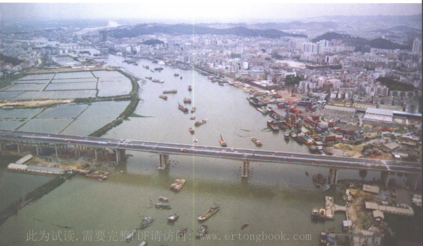
太平大桥主桥(航摄), 跨径 59\text{m} + 2 \times 106\text{m} + 59\text{m}