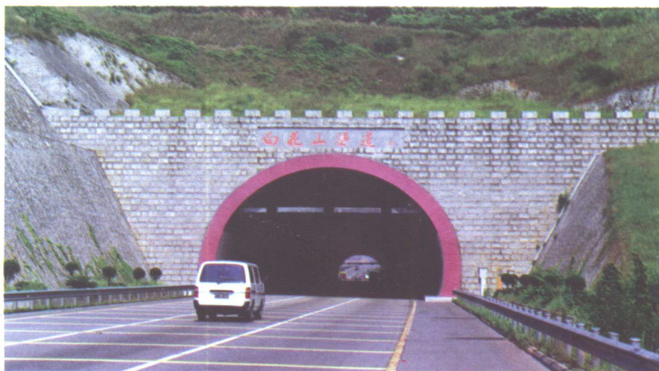
白花山左线隧道,长36m,端墙式洞口