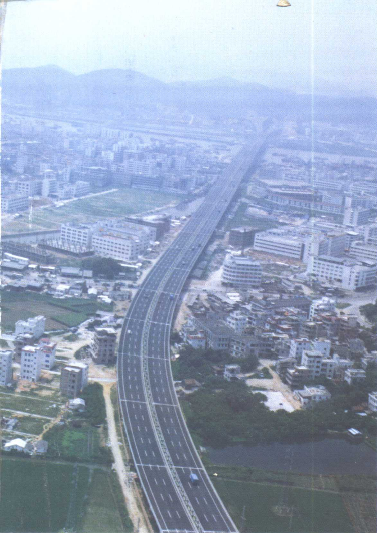
太平大桥鸟瞰(航摄), 全长左线 2 833.5m, 右线 2 776.5m, 穿越虎门镇, 跨越太平水道