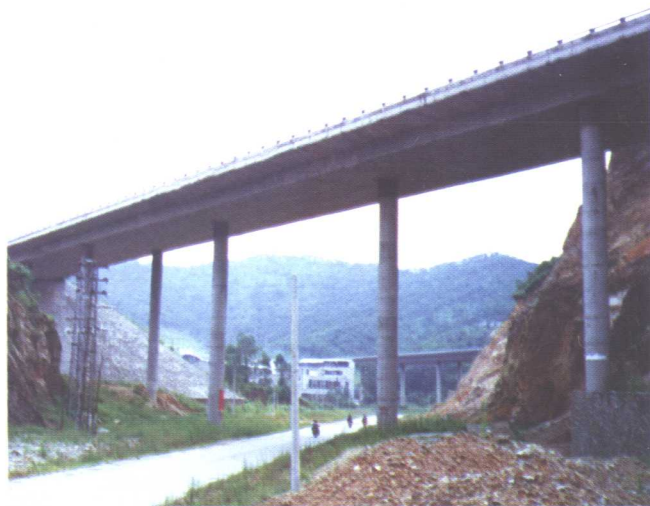
南面村2号桥，6孔，跨径 20-24.4\text{m} ，中墩为独柱墩，钢筋混凝土连续刚构