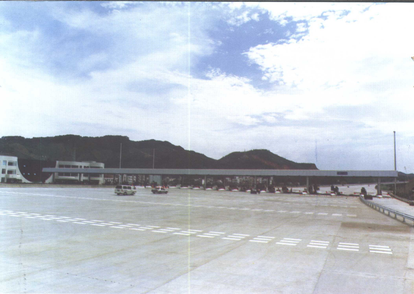
南沙收费广场和收费大楼。收费站有32个通道,全宽162.4m