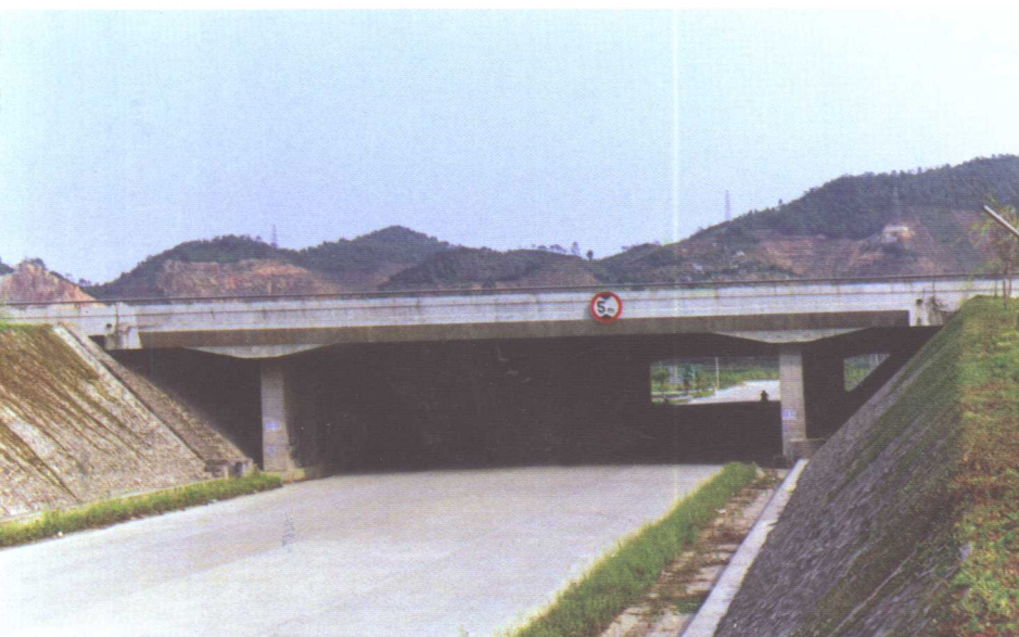
南沙互通立交桥，主跨 21\text{m} ，无桥台的双悬臂刚构加搭板。位于主收费广场前 R=2700\text{m} 平曲线上，宽 118.6-133.8\text{m}