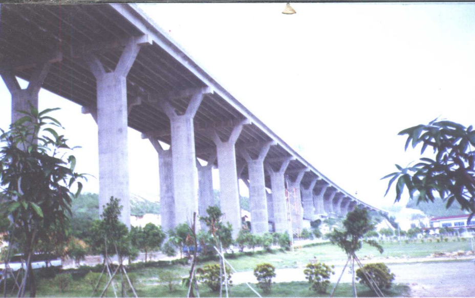
大石吓高架桥， 22 \times 30\text{m} 特大桥，带Y型墩的预应力混凝土连续刚构桥