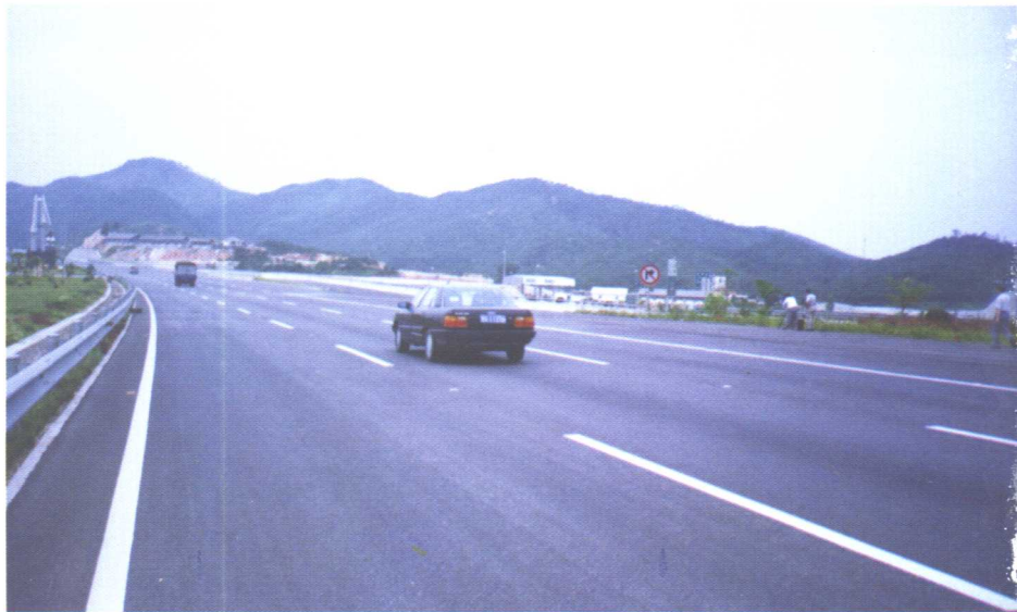
复合式路面，24cm 碾压式混凝土路面。上铺 5cm中粒式SBR改性沥青 混凝土面层