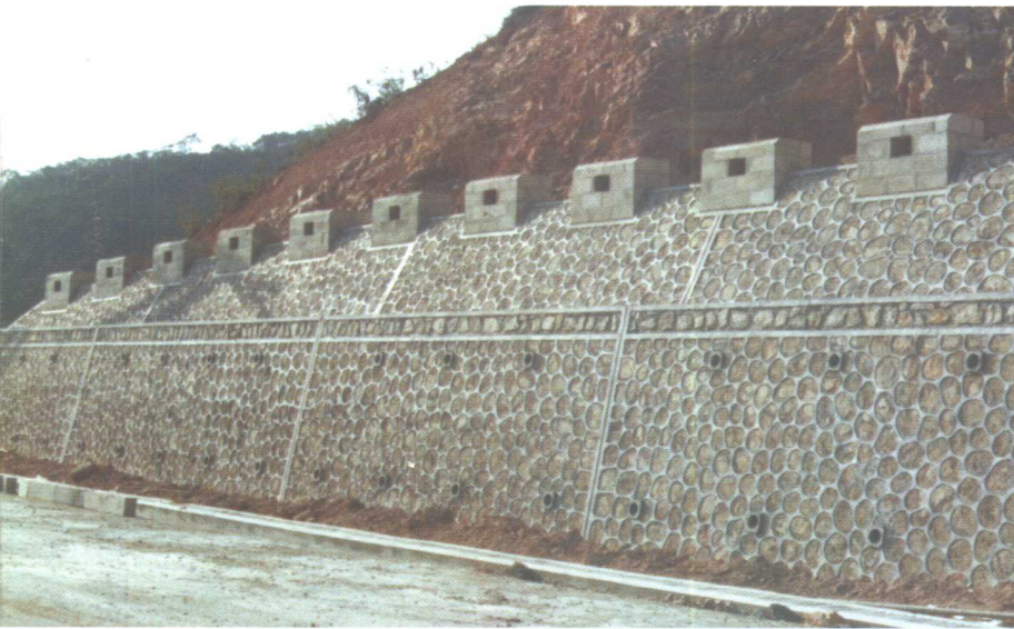
威远山路垂直挡土墙，采用带炮口符号的嵌入式墙帽