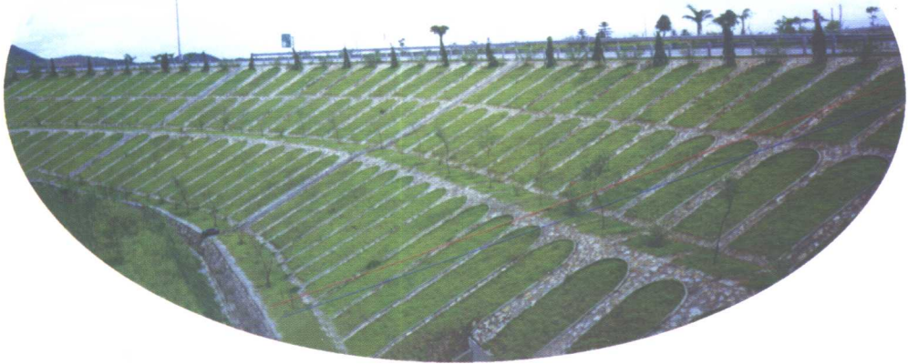
路堤边坡的三层拱式防护。既省材料，又美化环境