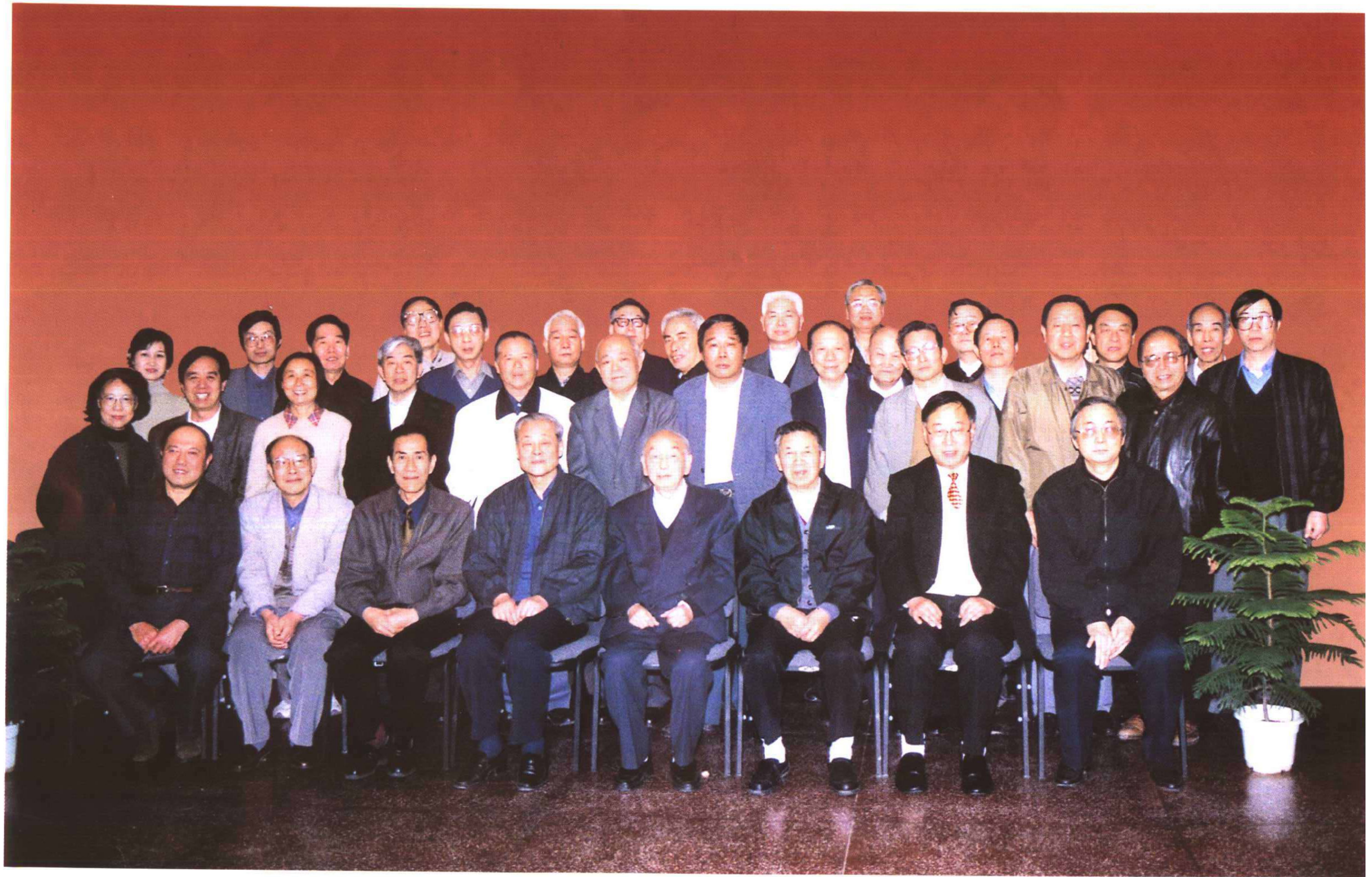
《中国西部地区环境演变评估》主要编写人员合影