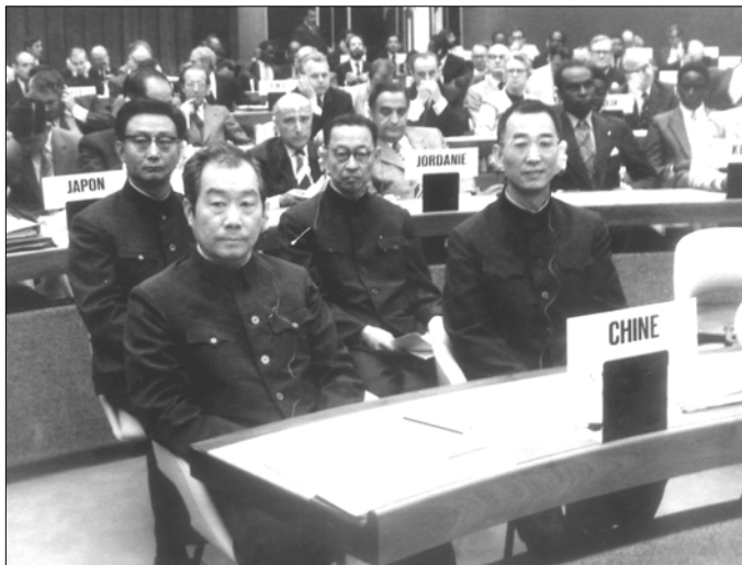
◀ 1972年，作者作为中国代表团成员之一，出席斯德哥尔摩联合国人类环境会议。

1972年，联合国为了顺应历史大趋势，在斯德哥尔摩召开了人类环境会议，这是人类第一次为表达对自己居住行星的关爱而采取的联合行动。这次会议犹如一座明亮的灯塔，指明了世界环境保护运动的航程。当时，我作为中国代表团成员之一，有幸参加了这次历史性的会议。我为会议报告中所展示的地球现状而深怀忧虑，也为人类的觉醒和行动而倍感振奋。这次会议，就像一把炽热的火炬，点燃了我心中的光明和希望。从那时起，我就下定决心要把毕生精力献给中国的环境保护事业。