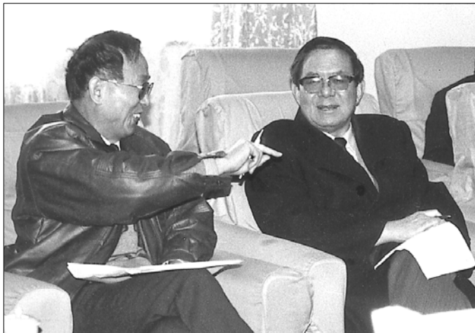
▶1990年，作者与宋健国务委员交谈。

这个时期，我作为国家环境保护局局长，参与了环境保护的一系列变革。最令我感到兴奋的是，环境保护被确立为中国的基本国策，并且成为全社会的共识。中国在现代化开始起步之时，就把环境保护提到基本国策的高度，表明了中国政府的远见卓识，当然，这也是中国特殊的国情所决定的。