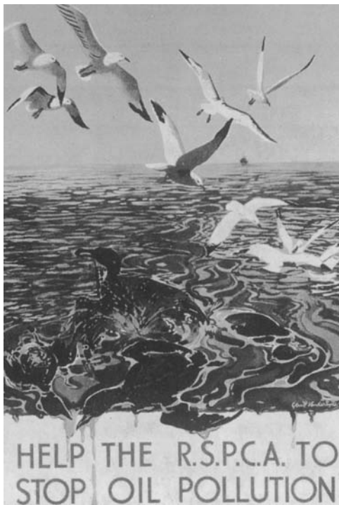
宣传污染危害水鸟的海报

从河流污染来看，其主要特点表现为：污染程度随河流径流量变化——在排污量相同情况下，径流量大污染轻，反之则重；污染物扩散快——河水是流动的，河流污染影响不限于污染发生河段，上游河段污染会很快影响下游；污染影响大——河流是饮用、渔业、工业、农业等主要水源，其污染影响可涉及到各方面。