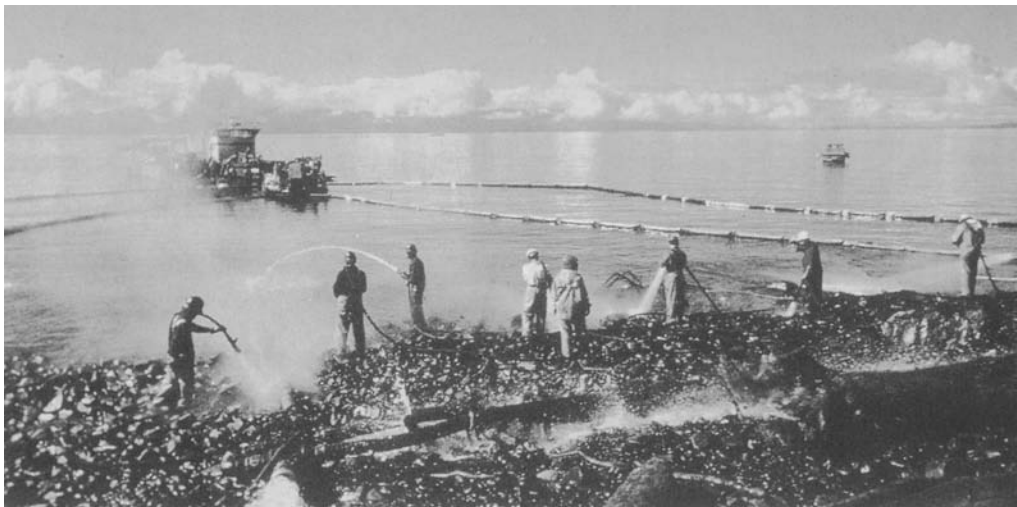
1989年美国阿拉斯加发生油轮原油泄露事故,工人们在用高压水枪清理油污

染水体;有的无毒,如蛋白质、脂肪等,但这些物质在一定条件下分解时也能产生有毒物质,如 \text{CH}_4 、 \text{NH}_3 和 \text{H}_2\text{S} 等,从而间接污染水体。水体中有机化合物大多数可为细菌所利用和分解,而在分解过程中消耗水中溶解氧,可使水中生物因缺氧而受害。有些有机物还能在水中形成泡沫、浮垢,引起水质浑浊和恶臭。