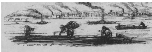
泰晤士河就这样藏污纳垢, 它供应着约翰的饮用水。