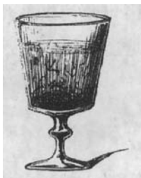
这就是约翰饮用的水。

这首诗图文并茂,形象而生动地说明了当年泰晤士河的水质。看看这组图片,就知道了什么是“藏污纳垢”。对此,人们早就有过种类类似的描述。1836年,维多利亚女王登基之前,有人描述了泰晤士河的糟糕状况:“这样,上帝为了我们的健康、娱乐和利益而赐予我们的高贵河流,已变成伦敦的公共污水沟。每天,大量令人作呕的混合物随水而入,而这水,就是欧洲最文明之都的居民的日常饮料。”到19世纪五六十年代,泰晤士河污染更加严重。1855年7月7日,化学家法拉第致信《泰晤士报》编辑,描写了他所见到的泰