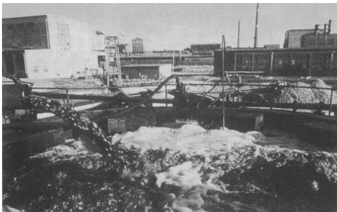
一工厂将废水排入河流

专家告诉我们,水体污染指的是由于人类活动排放的污染物进入河流、湖泊、海洋或地下水等水体,使水和水体底泥的物理、化学性质或生物群落组成发生变化,从而降低水体的使用价值的现象。