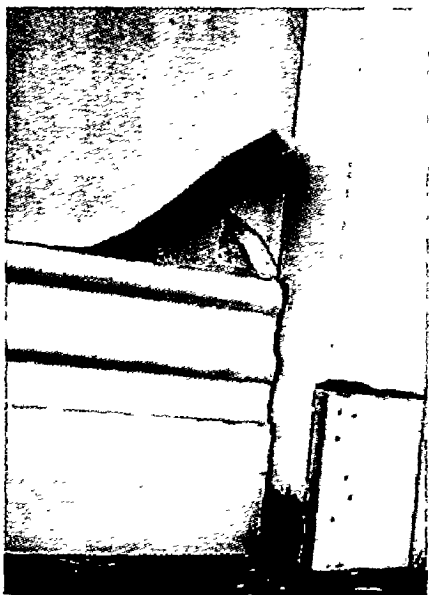
图1-2 劣质的施工质量