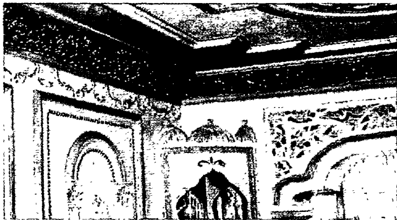
图 1-5 伊斯兰传统风格

皇权贵族的神圣。作为欧洲文艺复兴时期的产物，古典主义设计风格继承了巴洛克风格中豪华、动感、多变的视觉效果，也吸取了洛可可风格中唯美、律动的细节处理元素，受到了社会上层人士的青睐。特别是古典风格中，深沉里显露尊贵、典雅浸透豪华的设计哲学，也成为这些成功人士享受快乐，理念生活的一种写照。