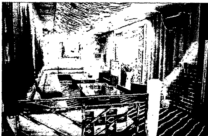
图 1-10 超现实主义

1-10)。如果运用到家庭装修中,不仅费用较高,而且时间长久后就会使人觉得乏味,甚至影响心情,得不偿失。