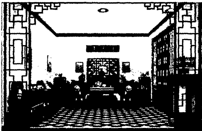
图 1-4 中国传统风格

(1) 中国传统风格 我国历史悠久,室内装饰装修的风格形态延续了建筑厚重规整、中轴线左右对称等特点,尤其是中国传统建筑的木结构装修内容丰富,如藻井、天花、罩、隔扇、梁枋装饰等,对现代装修均有深刻的影响。图 1-4 为中国传统风格。