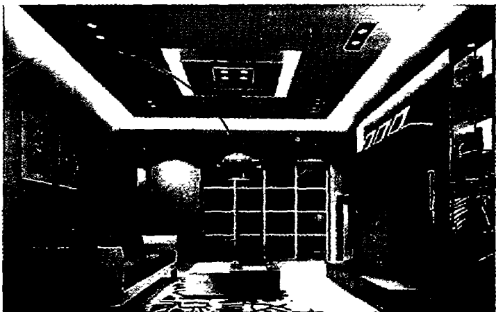
图 1-7 现代风格