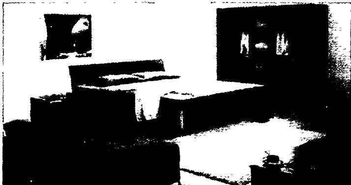
图 1-6 北欧风格