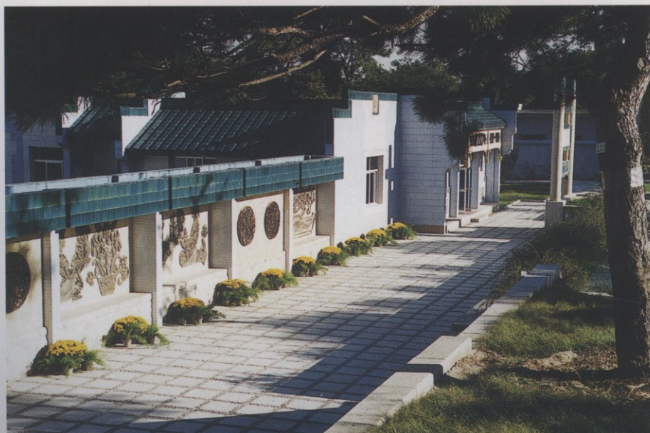
入口北侧利用 地势形成的 凹形通道