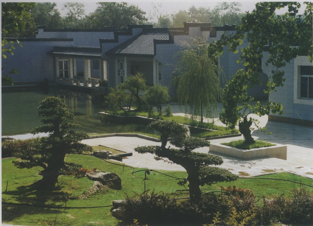
从园外看盆景园效果