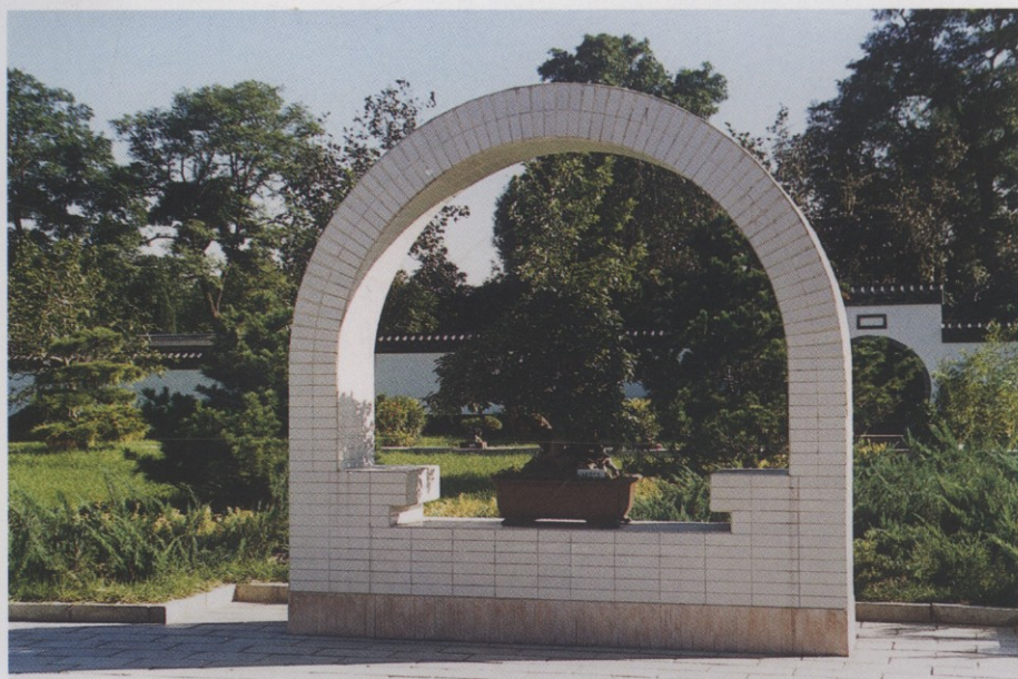
室外展场中的 小品式展台