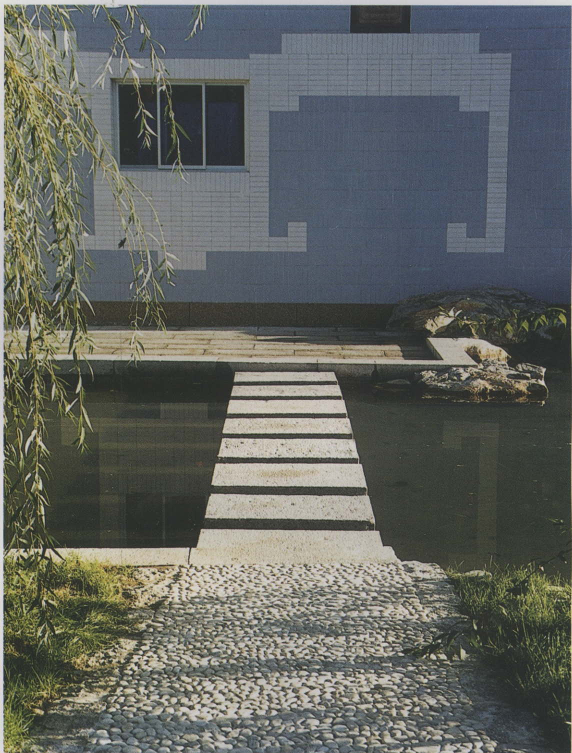
建筑装饰母题图案