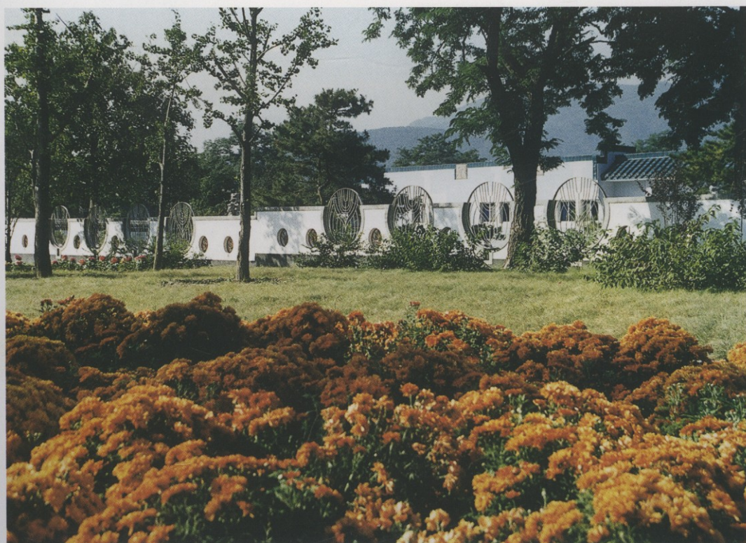
从绚秋园看盆景园