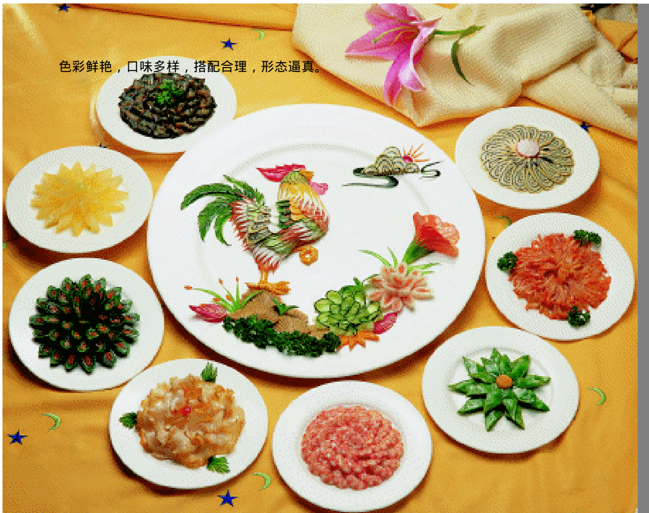
色彩鲜艳，口味多样，搭配合理，形态逼真。