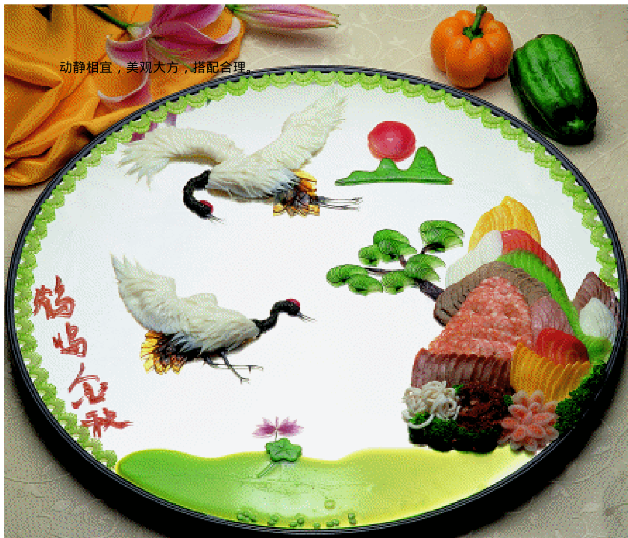
动静相宜，美观大方，搭配合理。