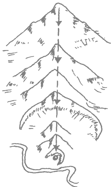
图 13 龙脉的流向（正面图）

河来划分：长江以南为南龙，长江、黄河之间为中龙，黄河以北为北龙。三大龙的起点都是昆仑山。