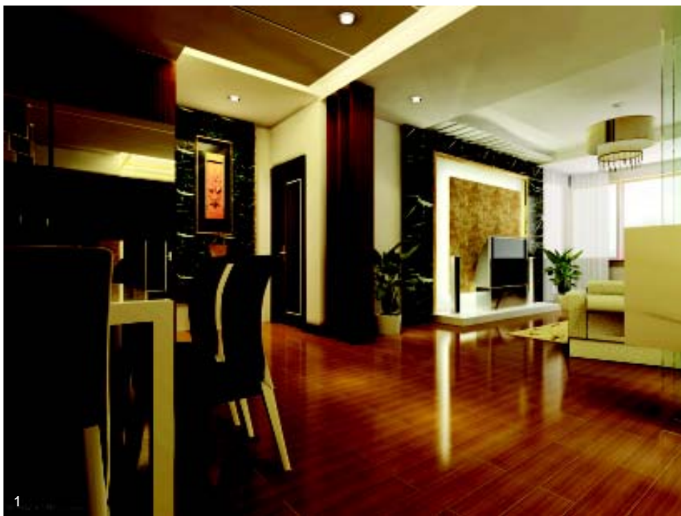
图 1.用大理石、实木地板、欧式家具来装扮客厅与餐厅，营造整个家居的欧式氛围。