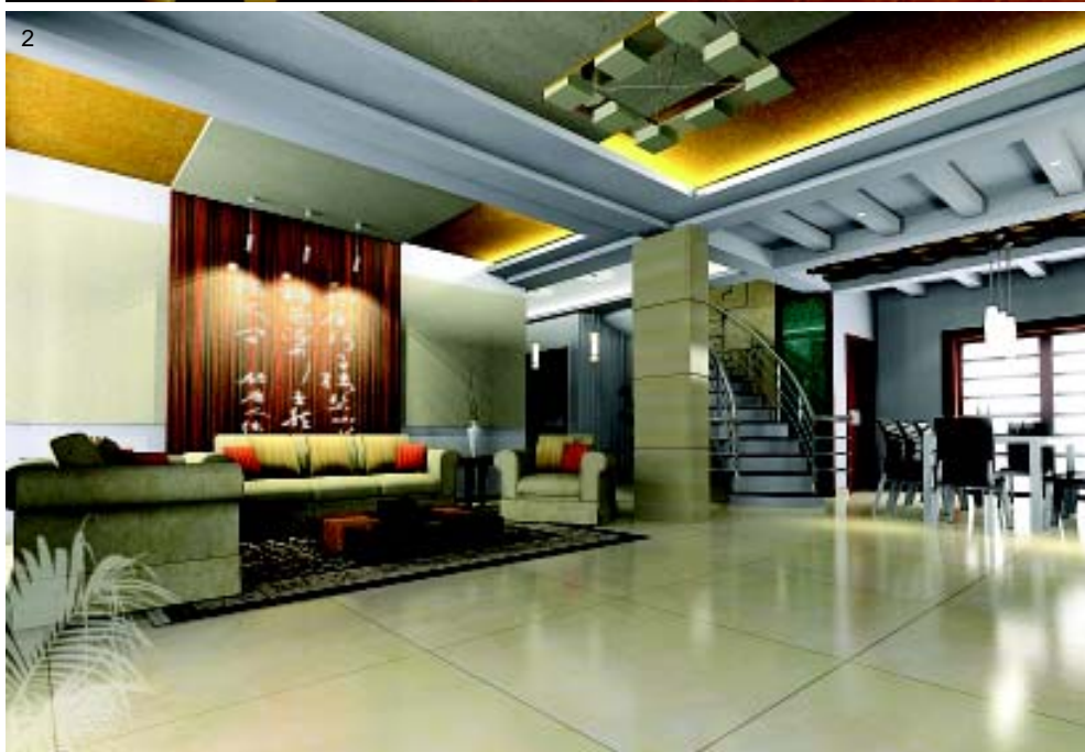
图 2.客厅的背景墙用面板刻字，创造出温文儒雅的生活氛围。