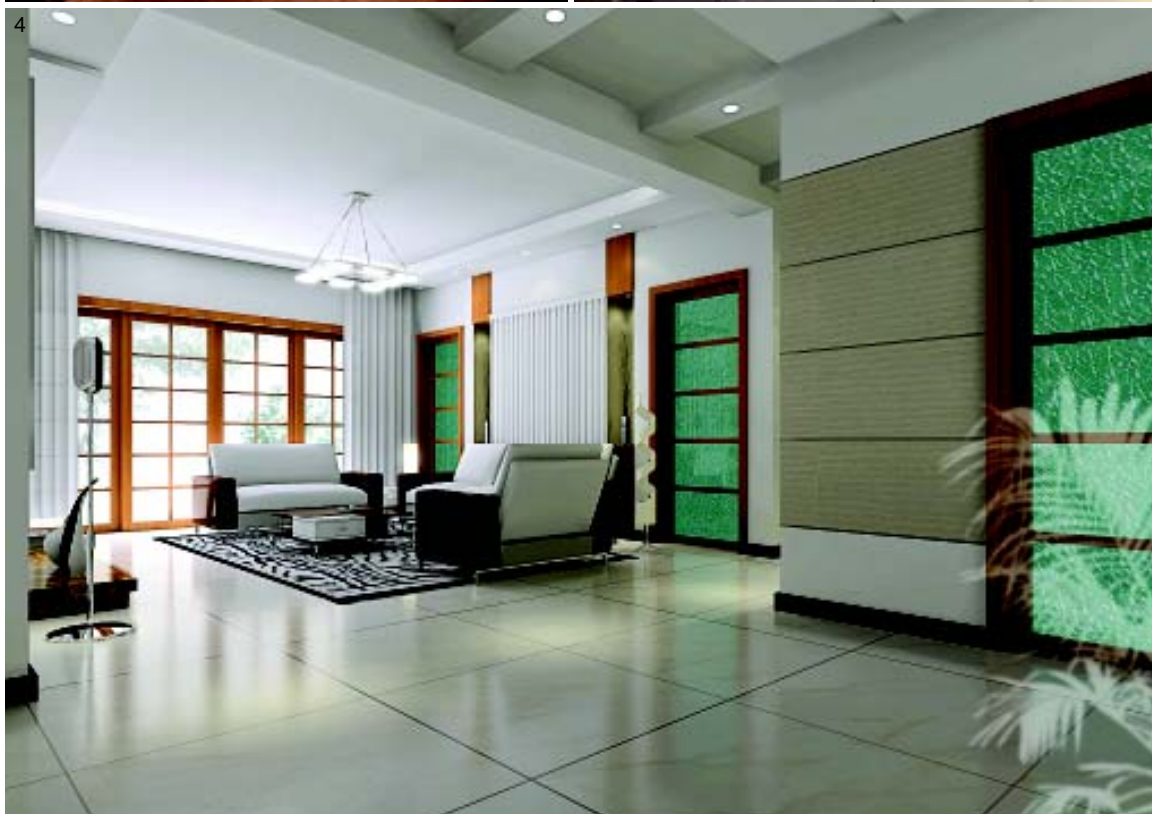
图 1. 书房和客厅相隔的一面背景墙采用清爽的米色，嵌上透明玻璃，别致又通透。