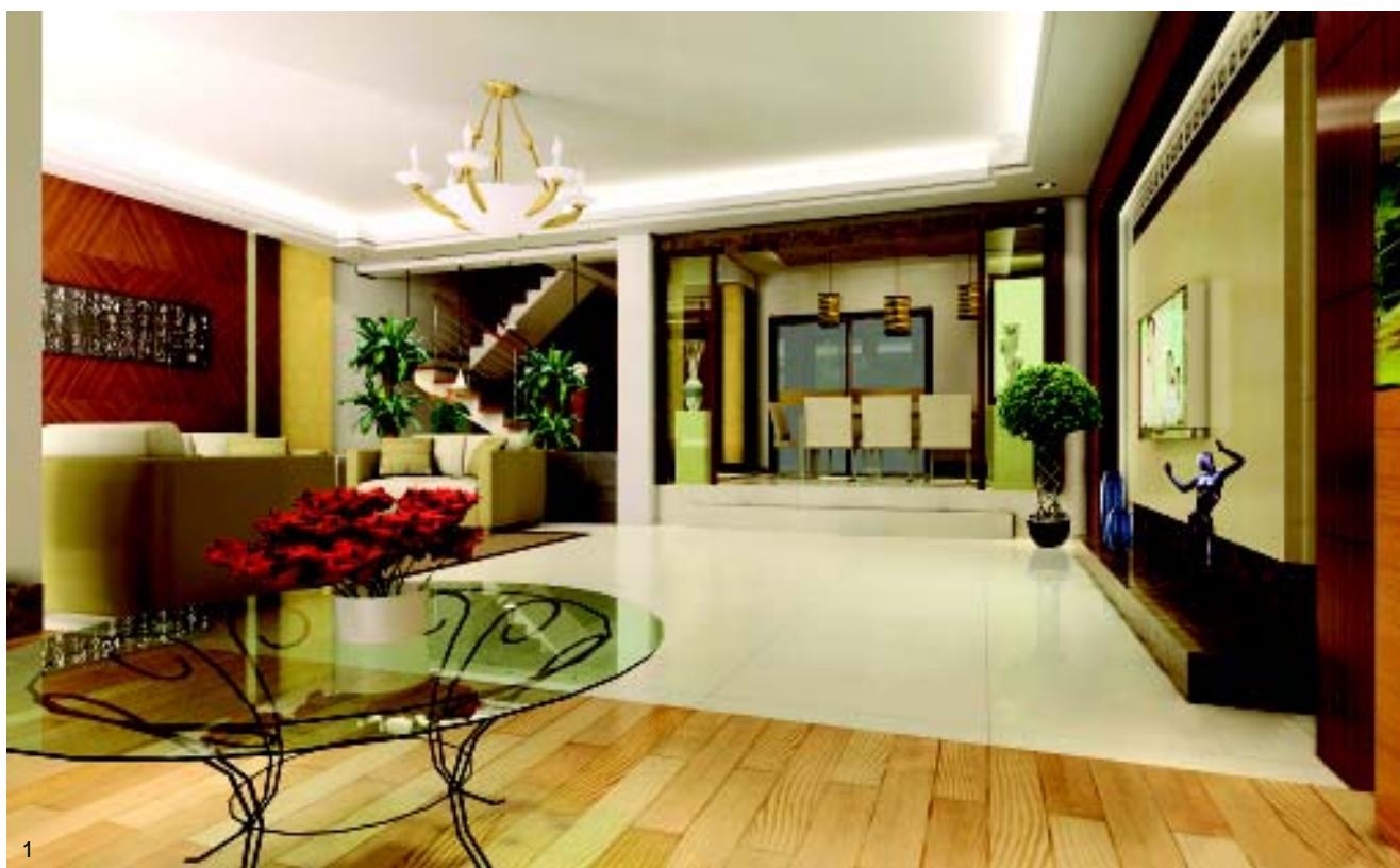
图 1. 客厅、餐厅和会客厅均用不同的地面材料铺装，表现不同区域的各自功能。

图 2/3. 餐厅的吊顶槽边的暖色调灯光与餐桌地面下的暖色调灯相呼应，营造浪漫的用餐氛围。