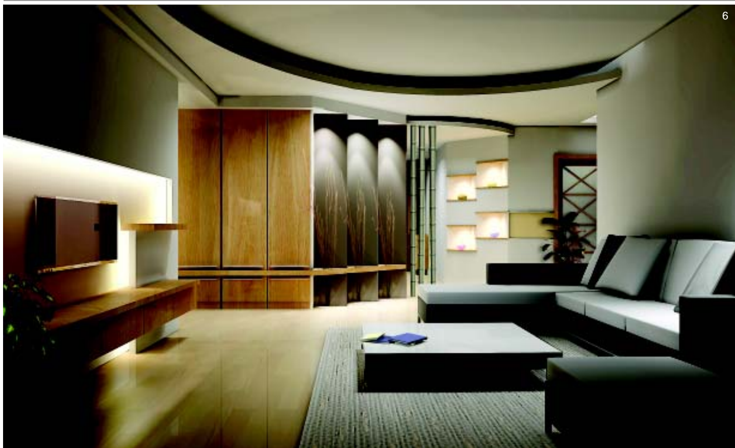
图 6. 客厅一边设计的三面成梯形的装饰架，配上毛竹的运用，体现出设计师的创意独特，散发着浓郁的人文气息。