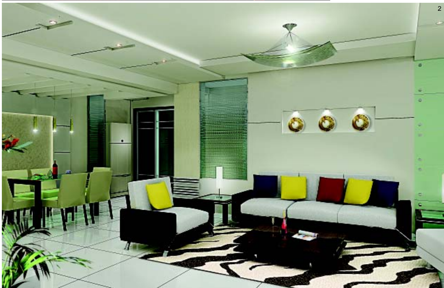
图 1. 嫩绿色的视听墙，没有过多累赘的装饰，此外运用射灯、同色系的布艺沙发来装点客厅的空间，显得清雅大方。 图 2. 磨砂玻璃与装饰壁龛结合的背景墙，让客厅充满明快的气氛。