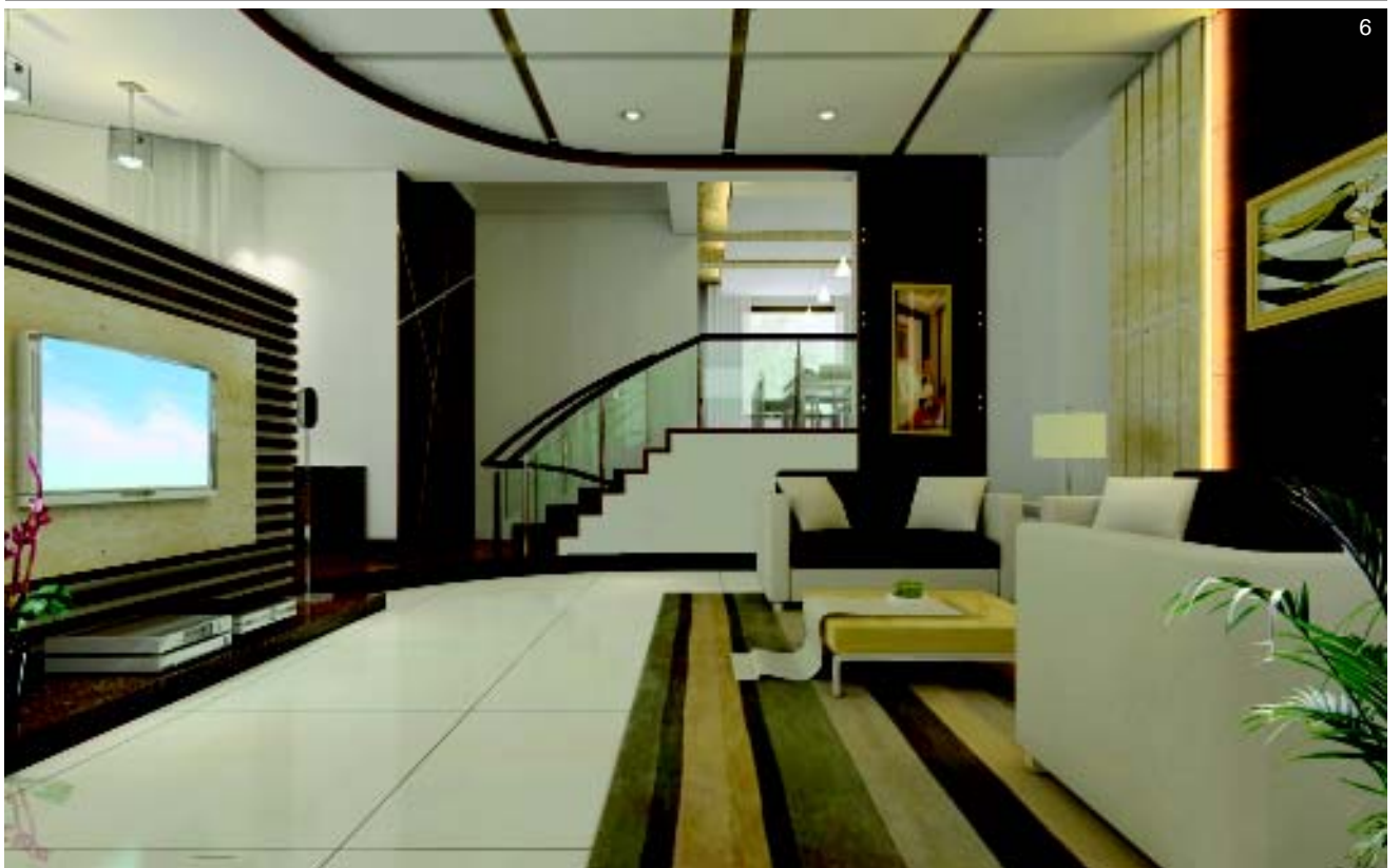
图 6. 客厅的视听墙选用横条石膏做的造型，描绘出空间的层次感。

图 5. 背景墙选用黑色调，搭配白色家具，衬托出酷绚的气氛，更显客厅空间现代、前卫。