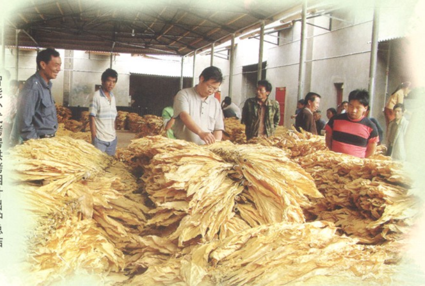
智能卧式烤房烘烤烟叶出炉总结