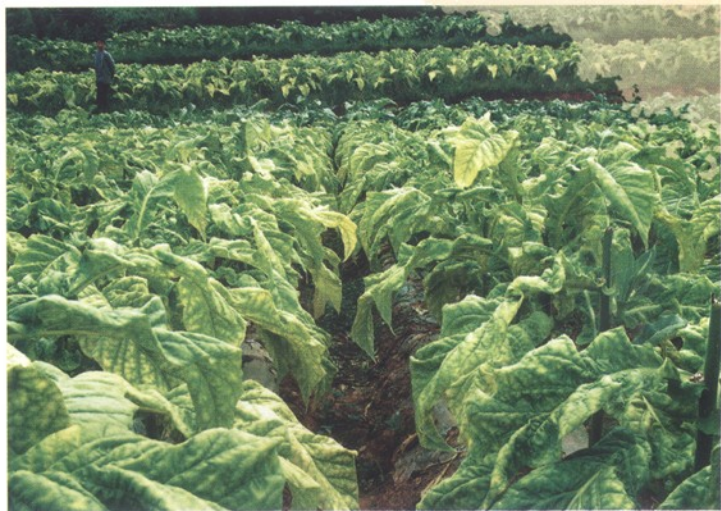
统一养好上部烟叶成熟度