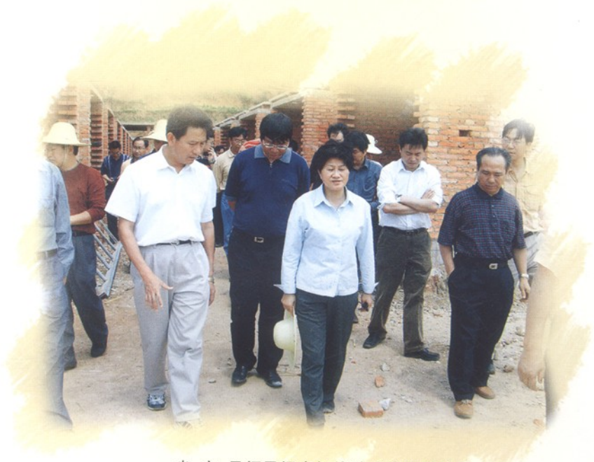
省、市、县领导视察智能卧式烤房群建设