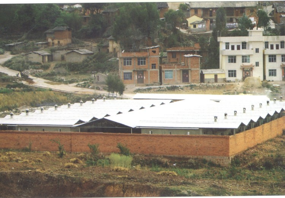
宁州镇大路南智能卧式烤房群