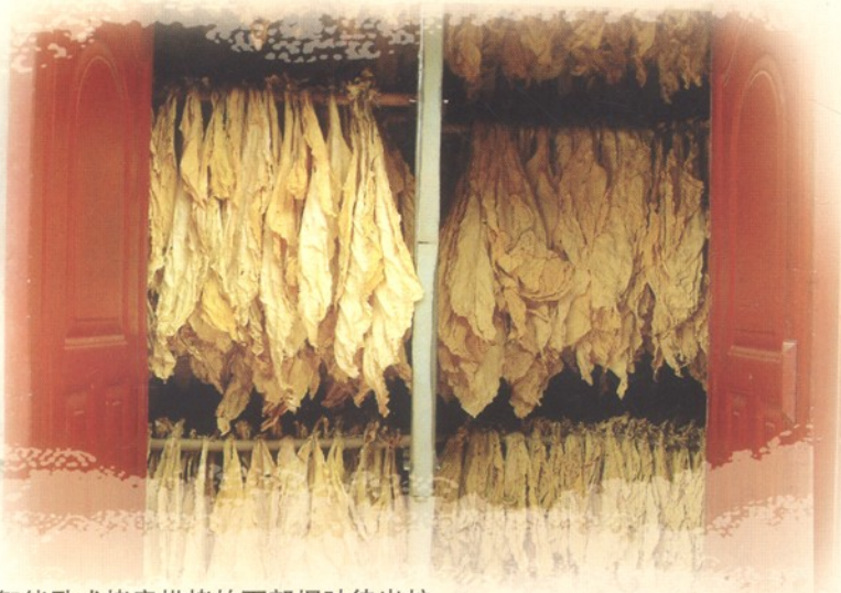
智能卧式烤房烘烤的下部烟叶待出炉