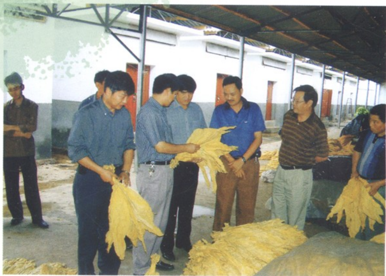
玉溪市烟草公司及县公司领导检查智能卧式烤房出炉烟叶