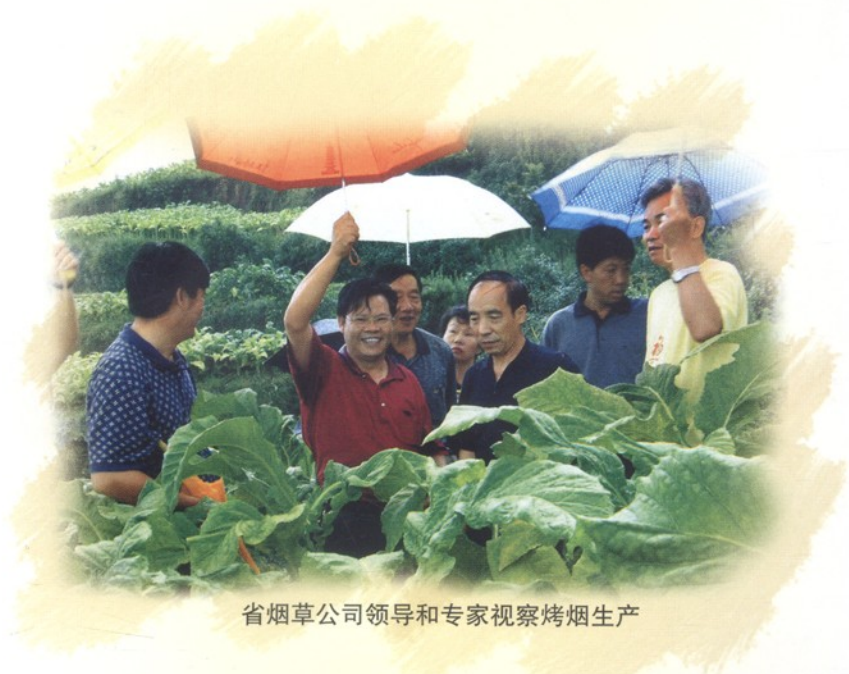
省烟草公司领导 and 专家视察烤烟生产