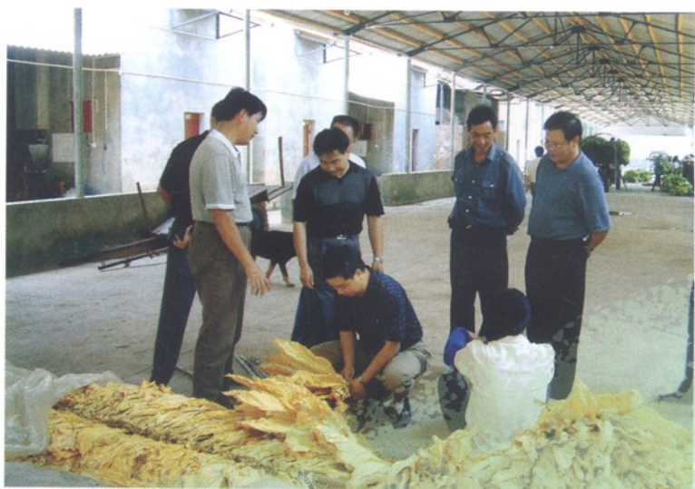
玉溪红塔集团、玉溪市烟草公司及县公司领导检查智能卧式烤房出炉烟叶