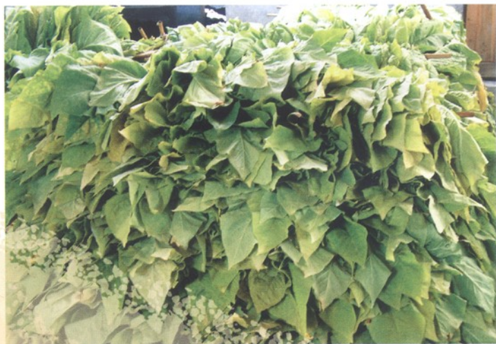
分类编烟待烤烟叶