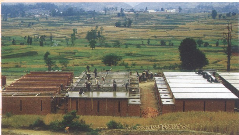
正在建设中的智能卧式烤房群