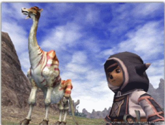
图 1-2 网络游戏——《最终幻想 XI》

(9) 该安排晚餐了, 走进现代科技与空间艺术完美结合、精心设计的整体厨房, 感觉这不是在做晚餐, 而是在从事另一种艺术工作。厨房设备包括双洗涤池“铁胃”(骨头及食物垃圾通过“铁胃”磨碎后, 流入下水道)、三眼及四眼燃气灶、拆洗方便的活动式自动排油烟机、煤气自动报警器和定时器。此外, 还有消毒碗柜、洗碗机、微波炉、电磁灶、电火锅、电饭煲、电烤箱等一些现代化厨房设备。水暖新产品有净水器、陶瓷阀芯水龙头和红外线感应水