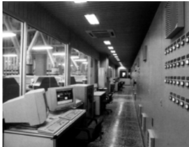
图 6 制粉厂的总控制室