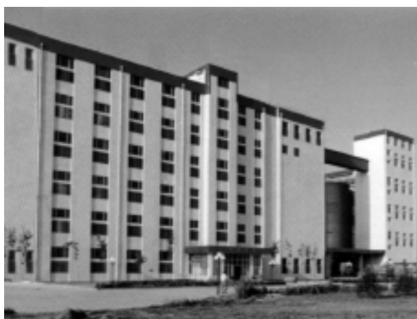
图 1 制粉车间的全貌