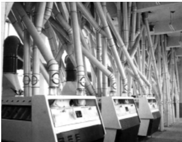
图 5 提纯物料的设备