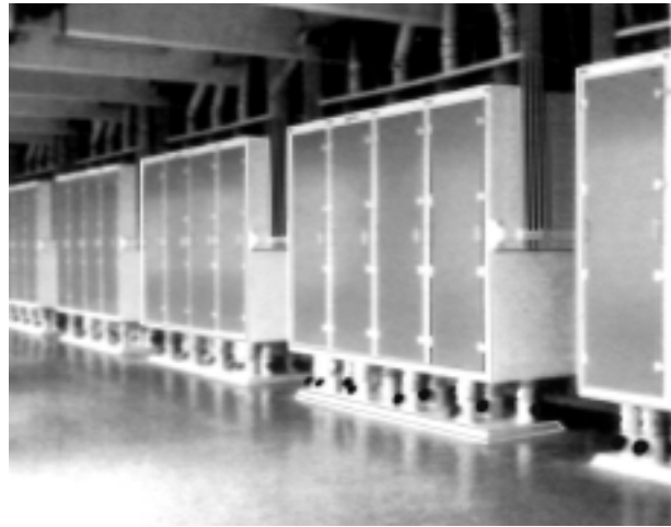
图 4 筛理设备