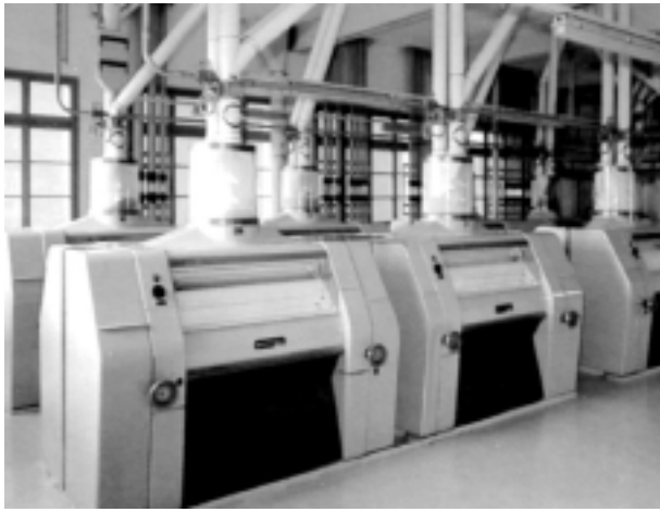
图 3 制粉车间的磨粉机