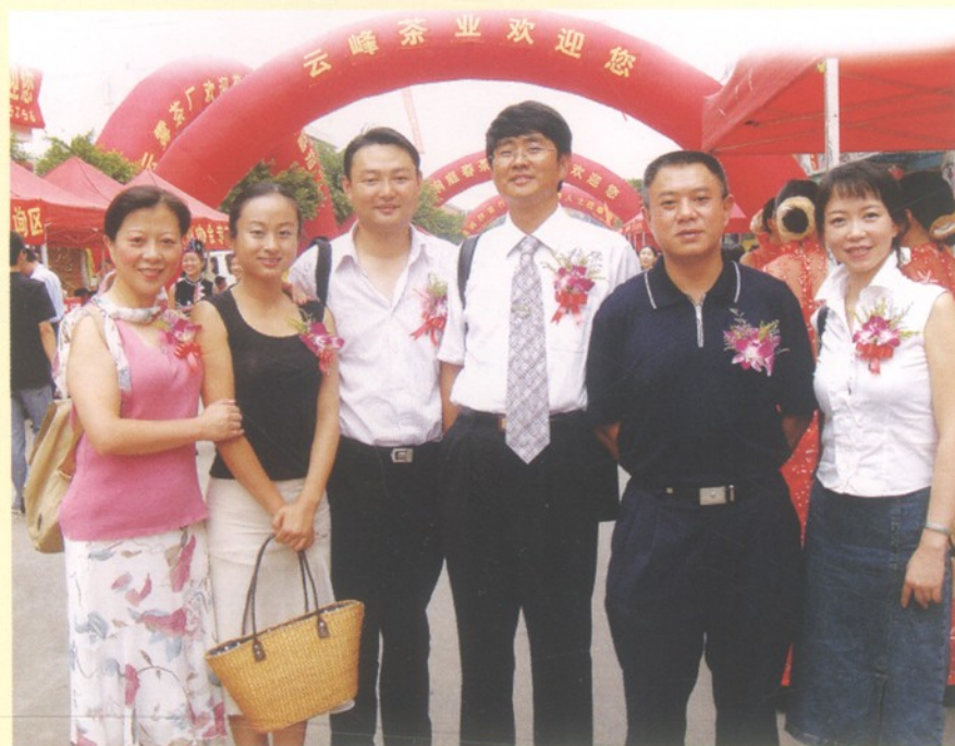
本书主要编写人员