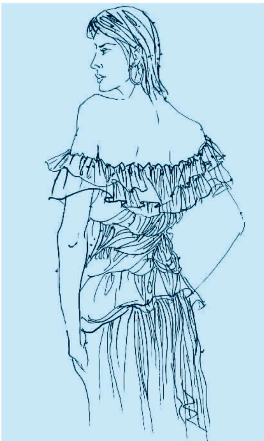
图 2-7 钢笔速写（一）