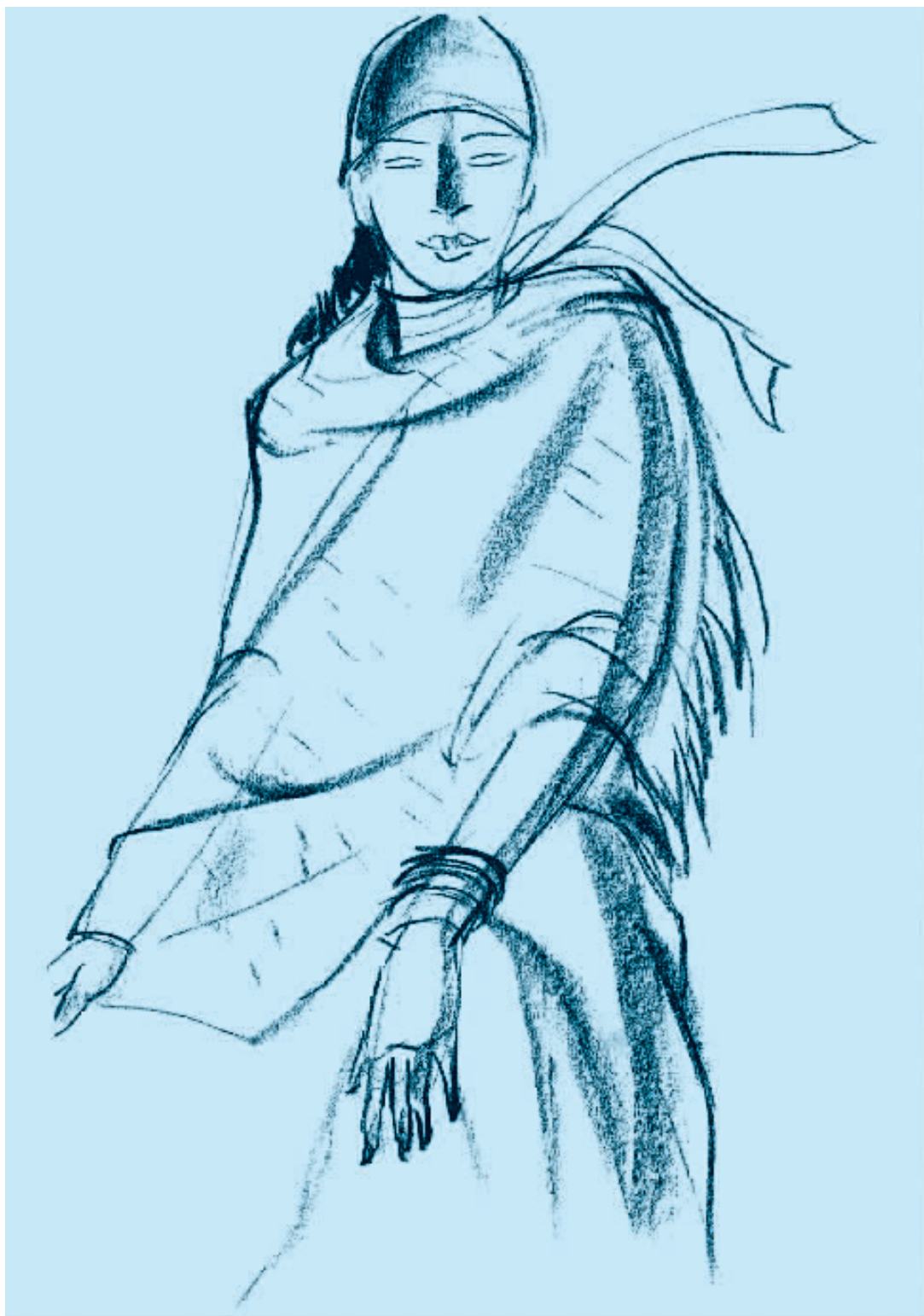
图 2-6 炭精条速写 (二)