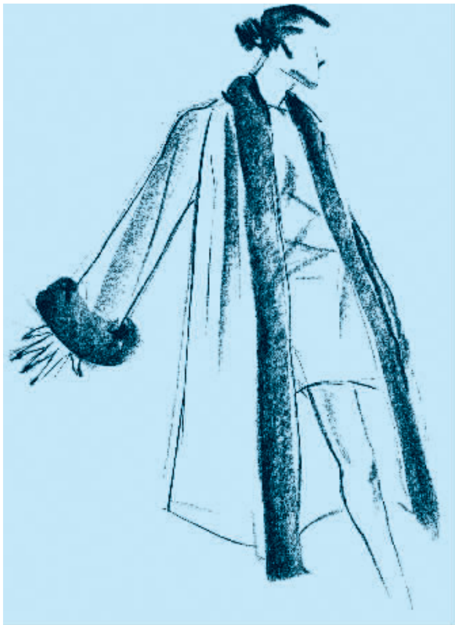
图 2-5 炭精条速写（一）

炭精条还可以与色粉笔结合使用，能表现更丰富的时装人物画。时装人物速写是以表现服装的款式为主，因此在重要部位可以加入少量颜色作为说明，以达到更准确、完美的表现效果。（图 2-5、2-6）