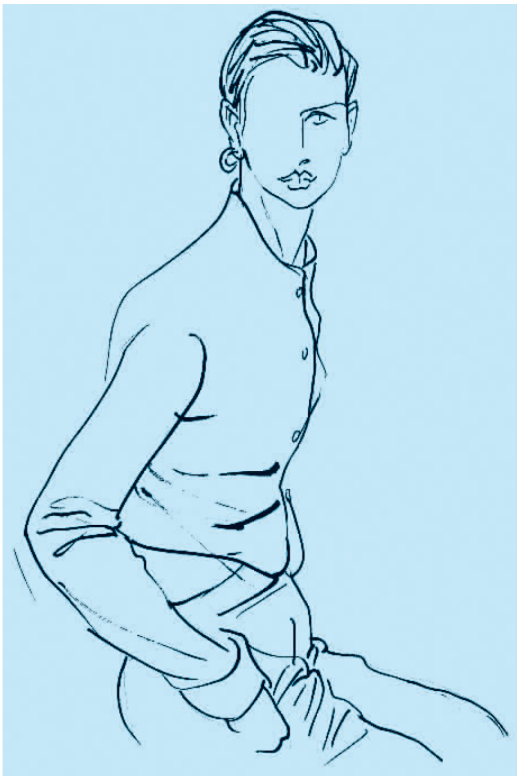
图 2-8 钢笔速写 (二)