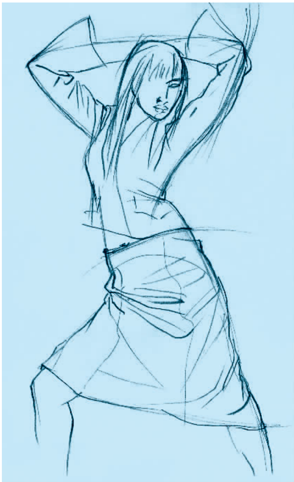
图 2-2 铅笔速写 (二)