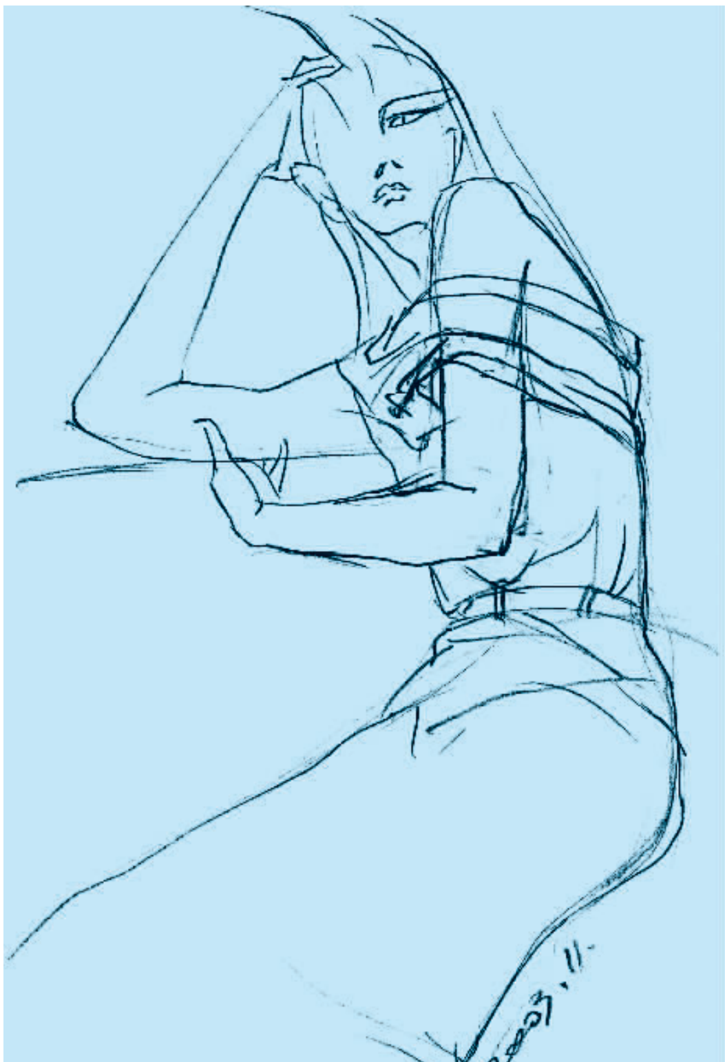
图 2-1 铅笔速写 (一)