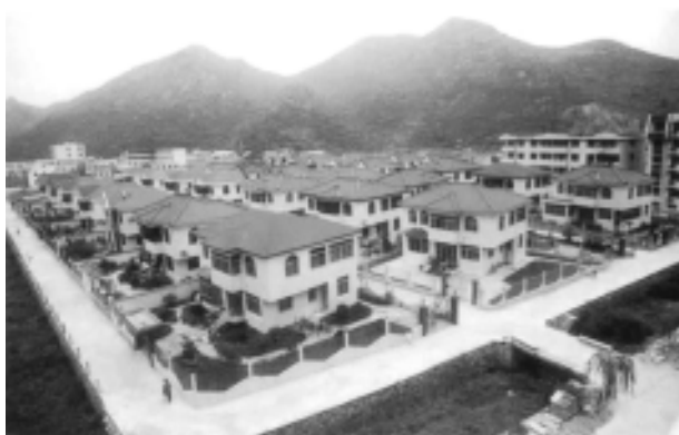
图 1.2 20 世纪 90 年代我国富裕农村景象