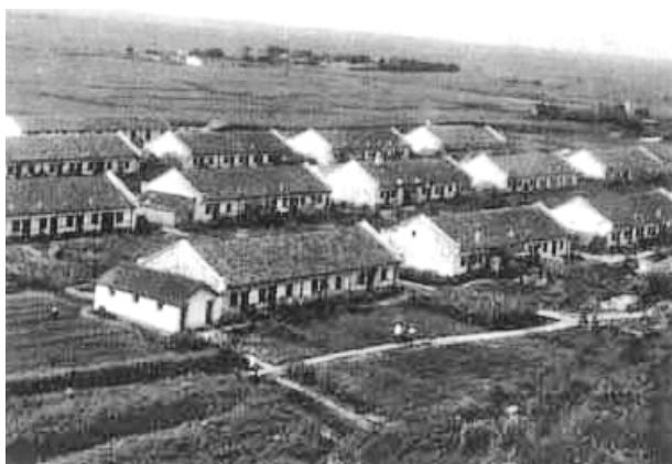
图 1.1 20 世纪 50 年代的我国农村景象