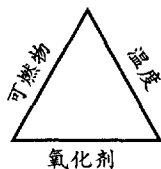
图 1-1-1 燃烧三角形