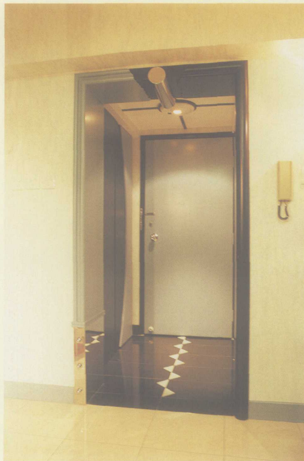
半黑色、半绿色组合的玄关区门拱，已道出了整间房子的主色调。