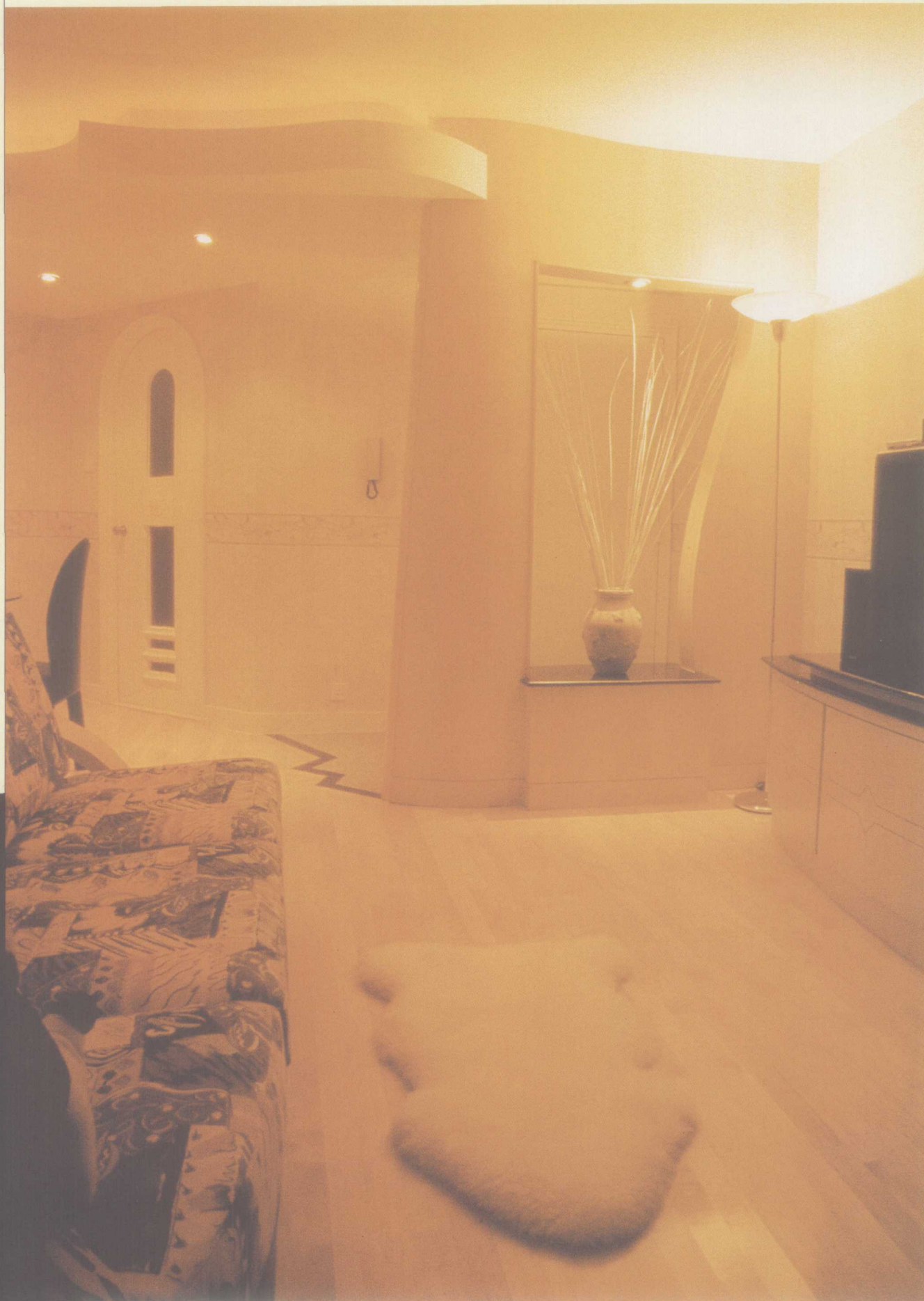
从客厅望向玄关的景观。