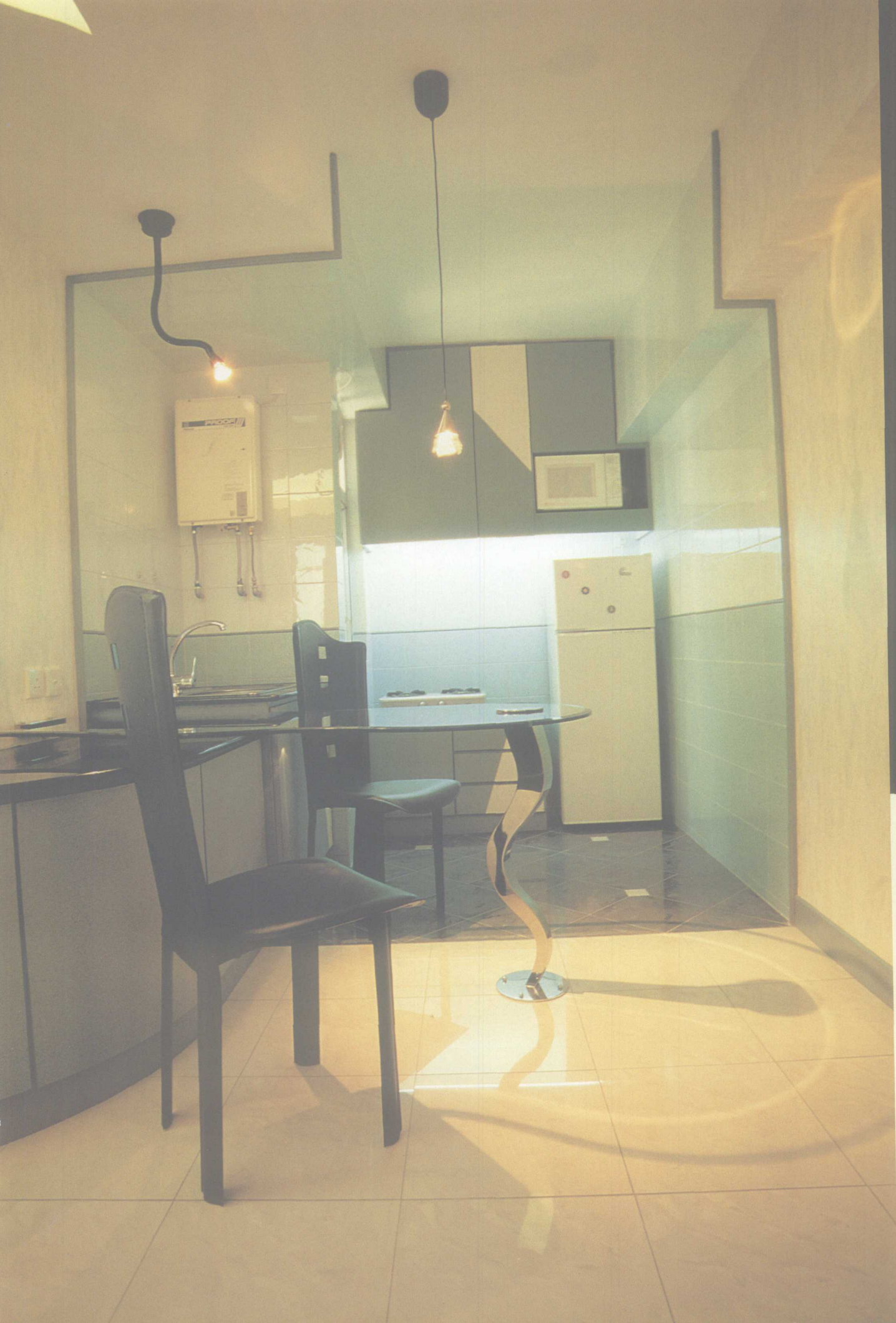
开放式的厨房，只在墙壁上用不同的材料来划分。