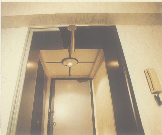
半裂开的门拱顶，特意设计了一条不锈钢圆筒来使之平衡。