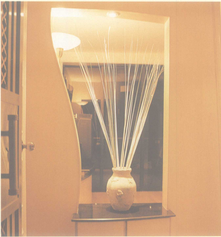
中空的弧形屏风，以“借景”的手法，巧妙地将客厅内的景致当作背景。