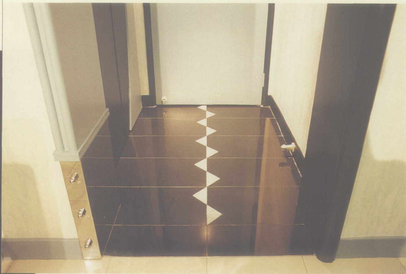
玄关的云石地台，饰以三角形的、模仿“鲨鱼牙齿”的图案。