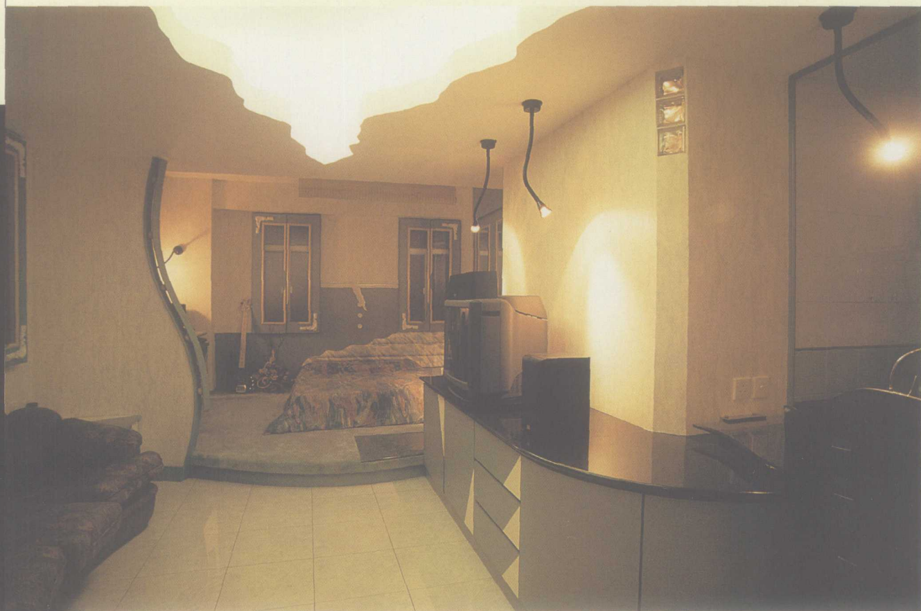
开放式的睡房与客厅连在一起，仅用高木台来划分。