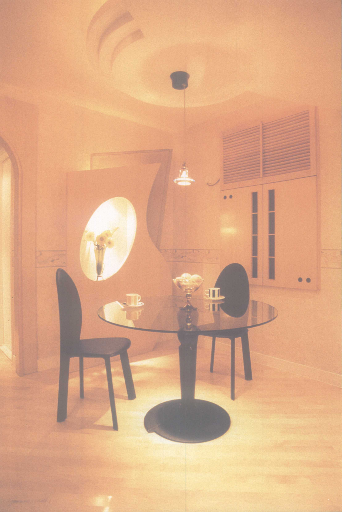
饭厅上方巨大的飞碟形假天花，与细小的吊灯形成强烈的对比。