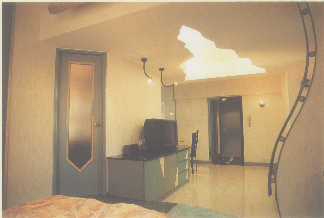
爆裂形的天花，使客厅营造出前卫的氛围。