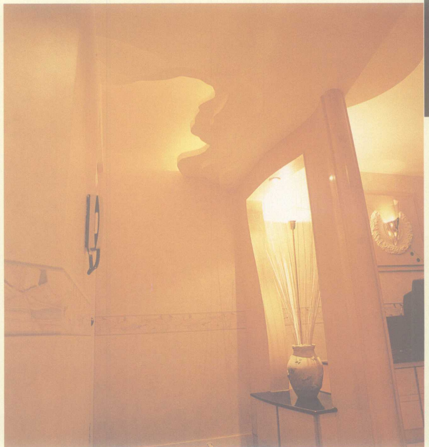
弧形的屏风，与断层状的假天花，凸显了玄关弧线的动感美。