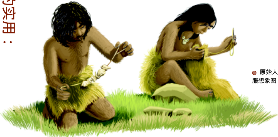
● 原始人缝制衣服想象图