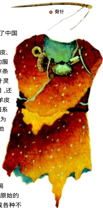
● 原始服饰佩饰展示图 根据出土的骨针、骨锥等制衣工具想象复原的这件原始社会服装，说明在纺织技术尚未发明前，兽皮成为原始人首选的服装面料。原始人佩戴用兽齿、海蚌等串成的饰物，除了起到装饰的作用外，还包含对渔猎胜利的纪念。