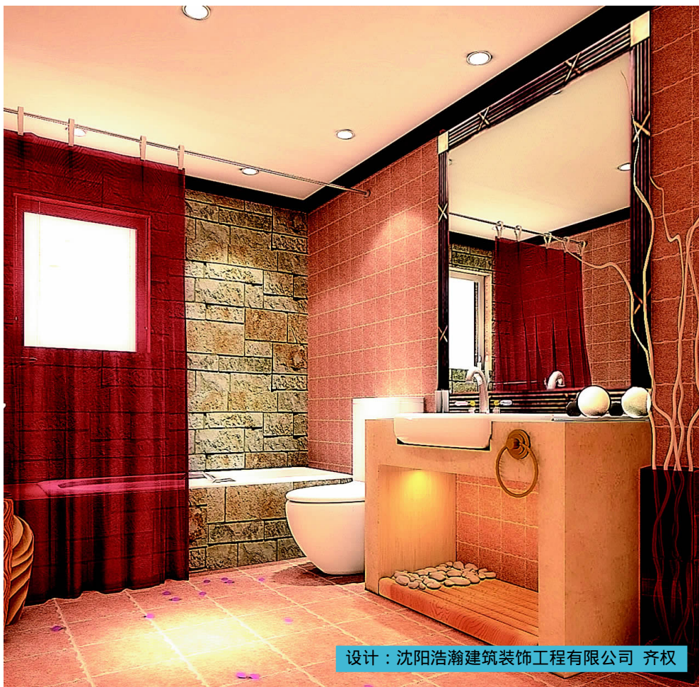
设计：沈阳浩瀚建筑装饰工程有限公司 齐权