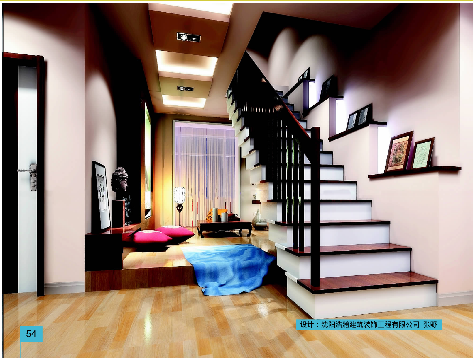
设计: 沈阳浩瀚建筑装饰工程有限公司 张野

4. 一端靠墙的楼梯还要考虑通行的方便和耐磨性,过陡的楼梯应在两侧分别设有扶手,或在一侧设有扶杆。墙面材料要耐污、耐磨,运用护墙板和壁纸都是不错的选择。