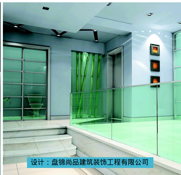
设计：盘锦尚品建筑装饰工程有限公司

凹入的墙面既像是壁龛,也像是工艺柜,底部的虚光和上部的射灯照明都使得这一局部墙面成为视觉的中心。