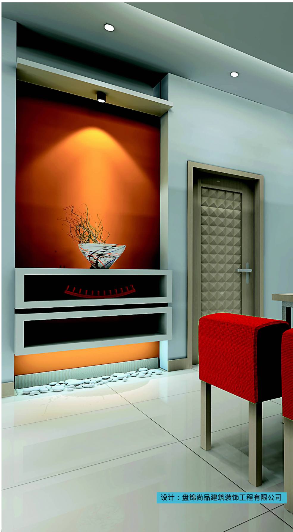
设计：盘锦尚品建筑装饰工程有限公司