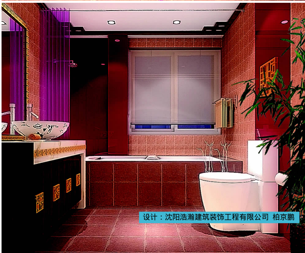
设计：沈阳浩瀚建筑装饰工程有限公司 柏京鹏

本方案对卫生间的墙面采用了分区的装饰手法,淋浴区选用粗犷而具有野性的材料,梳洗区则采用了典雅、高贵的装饰手法,两种材料和风格形成了对比,使卫生间显得更加美观、活泼。