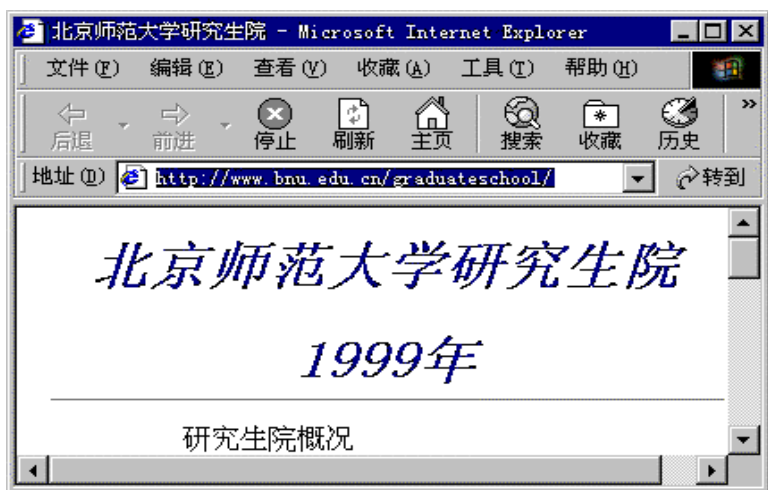
图 1-3 网页 index.htm

网页 (Web Pages 或 Web Documents) 是网站的组成部分。设计者可以根据需要公布的信息按照一定的方式分门别类地放在一个个网页上，包括文字、表格、图像、声音和视频等。网页可以看做一个单一体，是网络文件的一个元是存储在磁盘上的一个个单一的文件。图 1-3 是北京师范大学研究生院的网页 index.htm