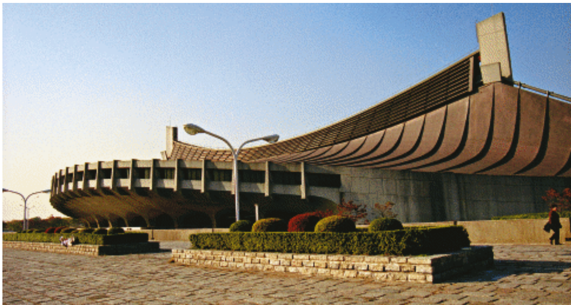
图 1-1 代代木体育馆

设计的特点,其自身的结构特征也在某种程度上决定了玻璃建筑的透明度。在此,结构造型设计的意义也就愈加明显。