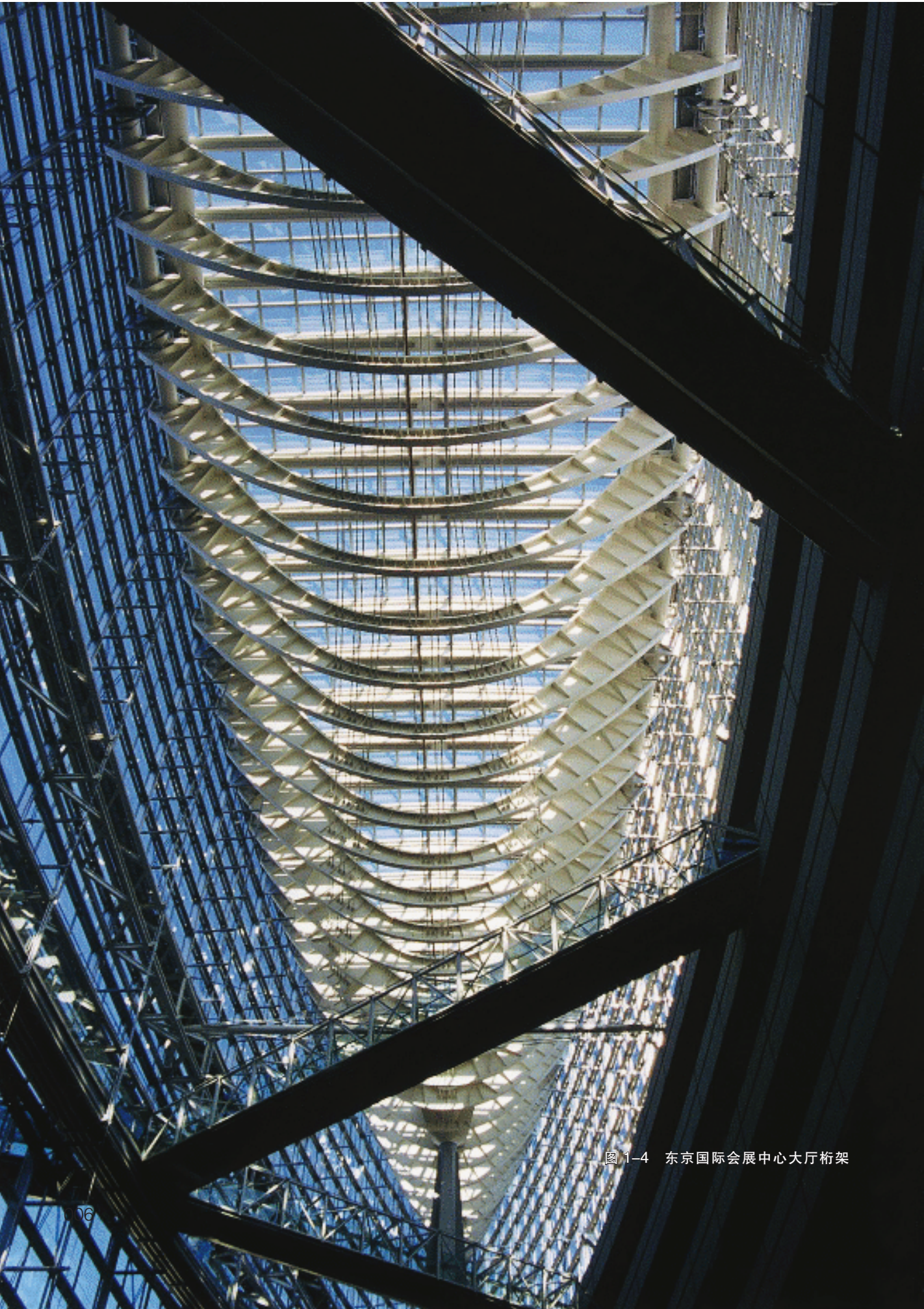
图 1-4 东京国际会展中心大厅桁架