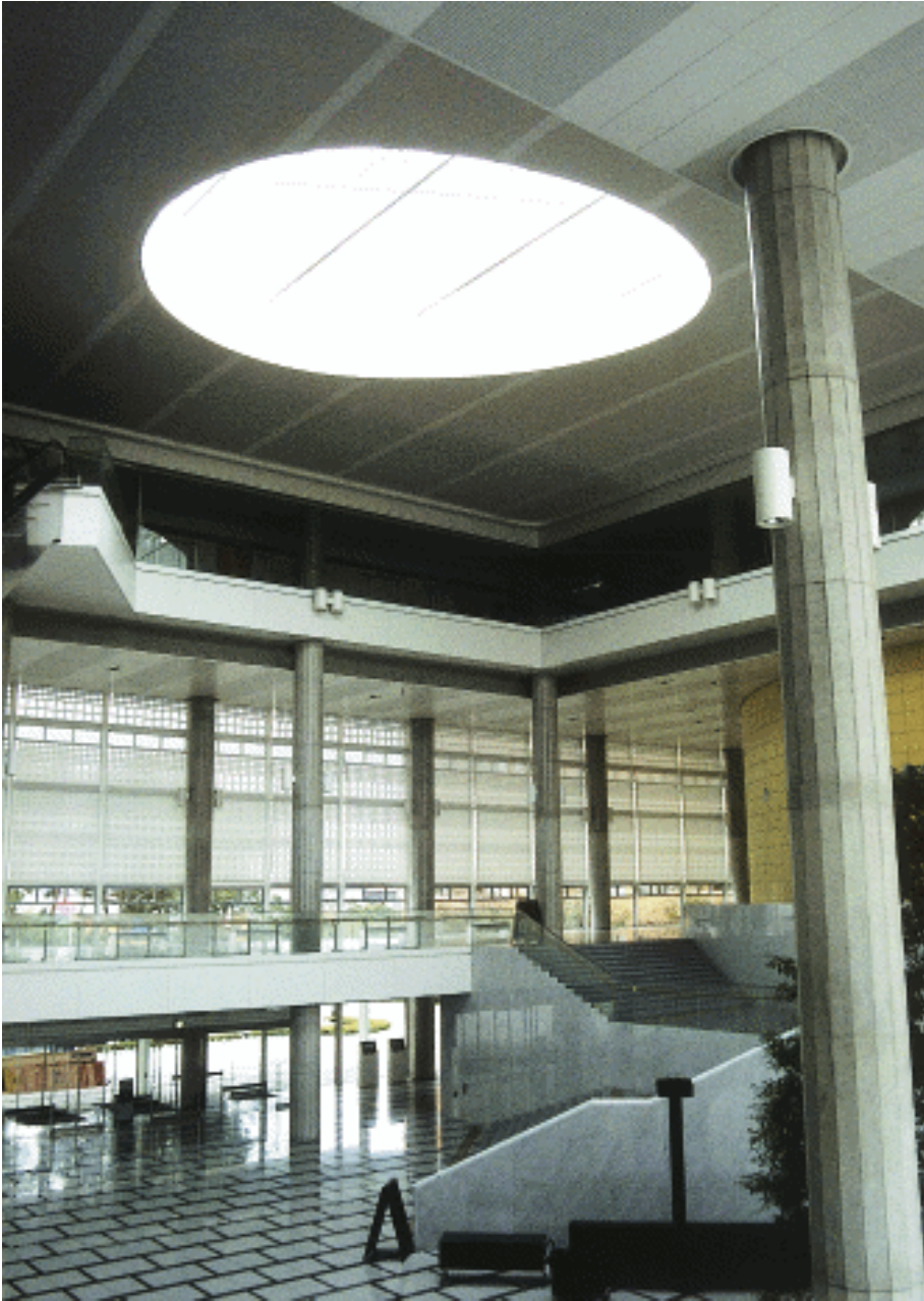
图 1-2 筑波国际会议场 中心大厅