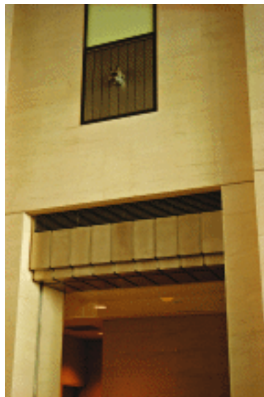
图1-5 东京某宾馆大厅墙面设计

总之,建筑设计应该是理性的技术设计与感性的空间设计相结合的产物,两者的结合渗透于结构、设备等各个具体环节,在日本当代的建筑设计中,将结构和设备作为造型表现的要素并入建筑整体空间设计构思的思路,越来越被大量的建筑师所接受,已成为现代建筑审美中一种必然的理性思维的体现。